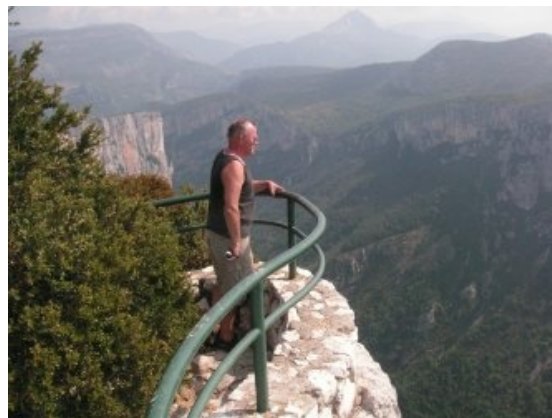
Vue over del af slugten

flere skarpe hårnålesving og en kraftig stigning op mod La Palud kom vi frem til skråvejen D23, som vi kørte ind ad som følge af Børges råd fra i går. (Vejen er delvis ensrettet den vej). Vejen ender i La Palud indenfor 1 km. fra hvor vi drejede ind, men vi kommer igennem fantastisk mange hårnålesving, stejle op- og nedkørsler, ser mange udsigter, der er ved at tage vejret fra en. Flere steder stod vi ud af bilen for at nyde nogle af de 14 markerede, særlige udkigspunkter. Nogle steder med dybe lodrette klipper, hvor fuglene fløj dybt under os, bjergbestigere på lodrette klippevægge, Dybe slugter med "grønt" vand i bunden, vandfald osv. Efter oplevelser som næsten tog luften fra en var vi fremme ved La Palud, hvor vi skulle vente ved et lyskryds – lidt under-