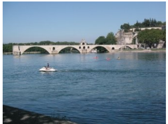
St. Bénezet broen

13€ synes vi at vi godt kunne nøjes med at se ned på vandet fra den bro vi skulle over på hjem til campingpladsen, og som lå kun 100 m. sydligere. Vi fulgte nu bymuren videre til vi igen var fremme ved den port vi var kommet ind ad. Vi vandrede lidt videre i de små gader og kom til sidst til en stor gade, hvor der lå et Supermarked. Da vi manglede flere ting til opholdet på campingpladsen fik vi købt forskellige fornødenheder, og vi besluttede os derfor til at gå tilbage til campingpladsen med det, og at vi så måtte nøjes med at få en forfriskning på campingpladsen. Efter at have fået en forfriskning i campingpladsens lille restaurant stod resten af dagen på afslapning og hygge ved campingvognen.