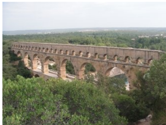
Pont du Gard

Et fantastisk bygværk åbenbarede sig for os – Det fantastiske kommer mere og mere frem, nå man tænker på at Romerne har bygget den i forbindelse med en "vandleledning" fra kilderne i Uzéz til Nîmes. "Vandleddningen er ca. 50 km lang og har et total fald på 17 m. og at "vandleddningen" skulle over kløften på Pont Du Gard, knap 49 m. oppe og med et spænd på 490 m. – Hvordan har de fundet højdeforskellene? Kendt Afstandene? Beregnet og afsat faldet? Transporteret og løftet blokkene? ??????. Solidt må det være lavet for det var her i området store regnskyl i 2002 skyllede campingpladser, huse og træer væk. Efter at have set på Pont du Gard, både nedefra og oppefra, gik vi tilbage til nutiden på par-