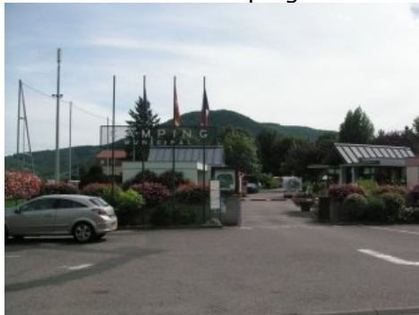
Camping Les Cigognes

motorvejsafgifterne. Første strækning op mod motorvejen mod Bourg-en-Bresse tog vi på landevejen, hvor der næsten ingen trafik var på dette tidlige tidspunkt. Vi kom på motorvejen ca. midt mellem Bourg og Annecy, så vi havde skåret et pænt stykke af ved at tage genvejen. Vi trak en billet i betalingsanlægget ved indkørslen på motorvejen og fulgte nu "Den hvide motorvej" frem mod Bourg, hvor vi tog motorvejen op mod Dijon. Vi havde set, at motorvejen slog "et stort slag" mod vest og nord ved Dijon, så vi kørte fra motorvejen ved Bersallin ca. halvvejs mod Dijon og fulgte landevejen N83 frem mod Besancon, hvor vi igen kørte på motorvejen mod Mulhouse. Vores teori om at vi sparede tid ved at "skære hjørner af" mener vi selv af vi fik syn for idet vi her mellem Besancon og Mulhouse blev overhalet af nogle biler som var let genkendelige, og som vi kunne huske havde overhalet os før vi kørte af ved Bersallin. Helt sikker er i hvert fald at vi havde sparet motorvejsafgifter, som eller var store nok – Vi nåede inden Alsace at betale ca. 37 €. Fremme ved afkørsel 15 som går op gennem Alsace, var vi færdige med vores motorvejstur for i dag. "Citronen" havde også lige set sit "fødehjem" i Montbéliard, hvor der stod mange lillesøstre og kusiner udenfor fabrikken. Vi fulgte landevejen op gennem Alsace til vi drejede af for at komme frem til camping-