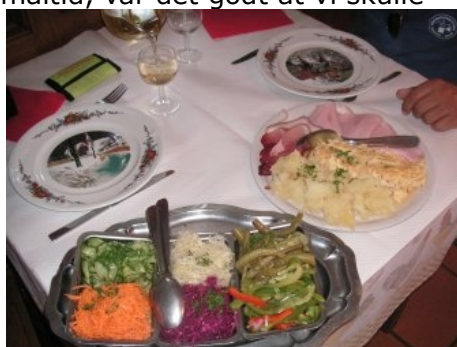
Platt de Alexis

trave de 300 m. op ad den stejle grusvej til bilen. Nu kunne vi, en fantastisk oplevelse rigere, køre videre frem ad vejen og over Kaysersberg tilbage til campingpladsen. At køre den vej var vi lige ved at fortryde, for lige så god som asfaltvejen var nede fra Riquewihr, lige så ringe, med store huller, var de første 7 km. mod Kaysersberg. Efter de 7 km. kom vi endelig ud på god vej og kunne nyde landskabet og byerne på turen tilbage til Turckheim. Vel hjemme på campingpladsen fik vi sluppet af og hygget os inden vi til aftensmad hentede en "Tarte Flambe" ved den salgsvogn som stiller op på campingpladsen. Nu var vi godt mætte og kunne slappe af resten af aftenen indtil vi skulle i bad.