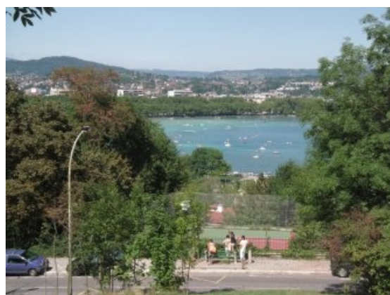
Udsigt fra campingpladsen

Således opfrisket eller hvad det nu hedder, så var vi klar til den videre færd på etappen rundt om søen. Flere steder undervejs kunne vi se, ikke skriften på væggen, men de navne der var skrevet på kørebanen for at opmuntre rytterne. Vi blev også opmuntret på turen, men det var mere den