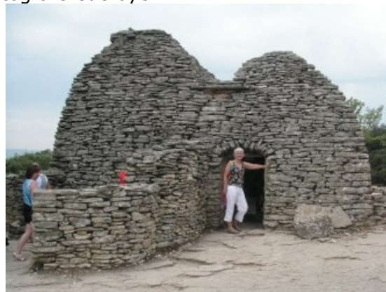
Village de Bories

Lige før Gordes viste et skilt til Village des Bories. Vi "smed bilen" på parkeringspladsen og spadserede ned ad den smalle vej frem til Village des Bories, en spadseretur på godt 1½ km. hver vej. Vi var rundt i museet som består af gamle stenhuse, hvor stenene er stablet i en lidt buet pyramideform. Det var spændende at se hvordan man i "gamle dage" havde levet i disse stenhuse uden vinduer – De sidste beboere skulle have forladt byen så sent som for 150 år siden. Efter at have set på husene vandrede vi tilbage til bilen på parkeringspladsen, hvor vi fik lidt vand efter den varme gåtur. Turen gik nu videre frem mod Gordes, hvor vi kunne nyde udsigten til byen som ligger "klistret fast" på en klippetop. Vi kørte helt ind i midten af byen, og ned af en meget