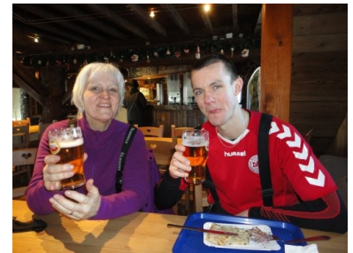
En lille forfriskning

havde 4 små kasseroller, så vi måtte have alt i gang – Det gik fint og snart var aftensmaden klar. Hvis jeg selv skal sige det, så var dagens måltid mindst dobbelt så godt, som det i aftes hvor vi var ude at spise og havde betalt det tredobbelte.