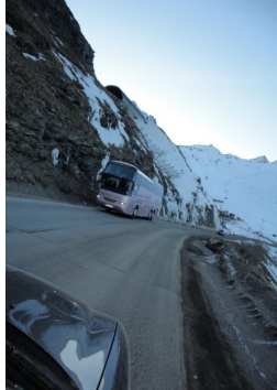
Bus på vej mod Val Thorens

det var lidt af en prøvelse at forstå hinanden. Efter noget "bøvlen" havde vi fået løftet porten halvt op, men kunne ikke komme videre. Heldigvis kom der en anden franskmænd, som åbenbart var blevet alarmeret, og han fik åbnet porten ved at åbne elskabet og "gøre et eller andet" i det. Vigtigst var, at vi nu kunne komme ud med bilen. Vi parkerede den på vejen ud for stedet vi boede, selv om vi vidste det var forbudt, men vi skulle jo have pakket det om, som vi havde smidt ind i bilen i aftes. Der kom flere busser, som skulle hente meget unge mennesker, som skulle hjem. Der kom også en bil som havde blåt lys på taget. Vi blev lidt betænkelige for om det var politiet, men det var heldigvis en ambulance (hvis man kan sige sådan). Hvad den skulle fandt vi