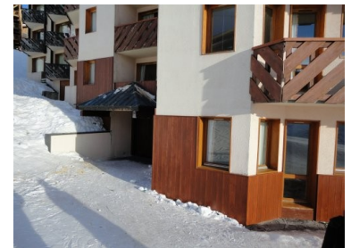
Indgangen til skikælderen

Vi fik kørt rundt i skiterrænet omkring Val Thorens, og fik tid til at komme ind på et af stederne på pisten, hvor der blev skænket ud – vi fik os et glas varm rødvin (Vin Chaud), vel det nærmeste man kommer en Glühwein, hvis man er i Østrig – Den var rigtig lækker, bedre end Glühwein var vi enige om – Lad os nu se hvad vi siger efter et par dage. Efter en del dejlige skiture kørte vi lige forbi, hvor vi bor. Så vi smed skiene i skirummet, og tog elevatoren op til lejligheden, hvor vi fik lidt frokost som vi havde købt ind til aftenen før. Vi fik en af de små fine franske øl til maden.