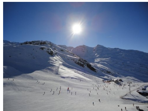
Sol på pisten