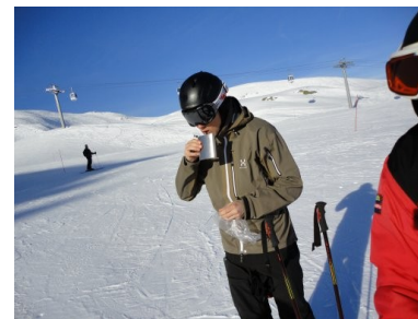
Tid til Fætter Bernhard

Efter frokost tog vi den store lift, der førte os op på bjergtoppen, så vi kunne køre ned i dalen mod Meribel Montarret, hvor vi havde kørt dagen inden. Ligesom de andre dage blev der indlagt enkelte små pauser, hvor vi fik en "Fætter Bernhard" (Fernet Branca) fra Pers lommelærke. Tiden var efterhånden så fremskreden, at vi tog liften, der gik op mod Val Thorens. Da vi tog den sidste stolelift mod toppen, hvor vi kunne køre mod Val Thorens kunne vi se, at vi sagtens kunne nå endnu en tur ned af bjerget mod Meribel Montarret, ad en super løjpe. Vi havde nu fået endnu en god oplevelse i Meribel dalen og tog stoleliften mod Val Thorens.