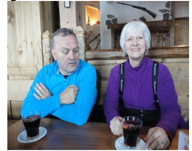
Vin Chaud – Hot Wine

for at køre rundt i Meribel Montarret. Vi skiftedes lidt til at køre foran og hen ad ved halv 11-tiden, var det blevet tid til en lille opkvikker, så vi fandt en hytte, hvor vi fik os et glas "hot wine", som vi faktisk finder bedre end "Glühwein" i Østrig. Da vi havde fået vores "Schwungwasser", kunne vi igen klare strabadserne på skipisterne – Næsten bedre end før. Vi brugte formiddagen på at køre lidt rundt i terrænet i Meribel Montarret, inden vi tog over bjergryggen for at prøve området omkring Les Menuires. Undervejs ned mod byen fik vi lidt frokost i en af restauranterne, der lå ved siden af pisten. Vi kørte ned gennem byen Les Menuires som