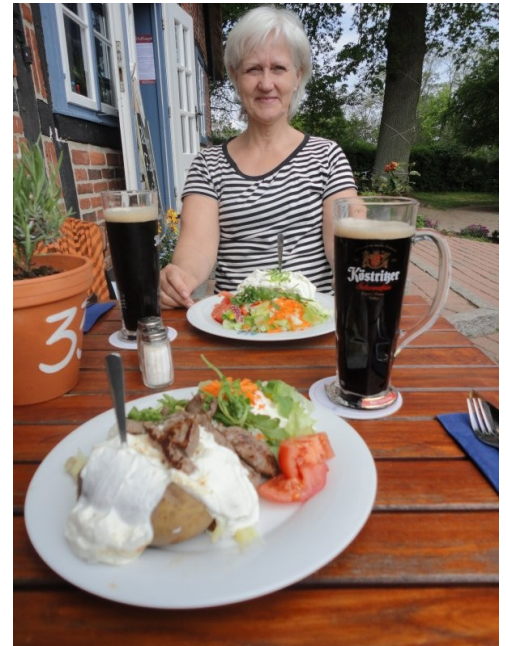
Fokost på Prinzeninsel