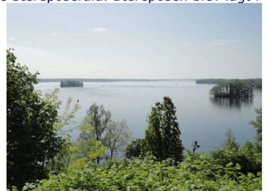
Udsigt fra slottet over Grosser Plöner See