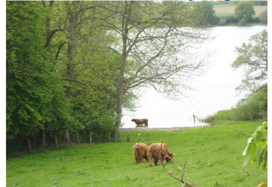
Kleiner Plöner See

kunne komme over åen, der fortsatte frem til den næste sø. Lige efter vi var kørt over åen, kom vi til en Biergarten. Selv om vi var lidt tørstige, fortsatte vi, da det ikke var nogen andre der, og det ikke så hyggeligt ud. Snart var vi ad de små veje kommet frem til Landesstrasse 76, hvor vi tog cykelstien mod Plön. Da vi kom frem til motortrafikvejsbroen, blev vi ledt under vejen og ad stier gennem kolonihaver, var vi snart inde ved starten af gågaden, hvor vi havde parkeret cyklerne om formiddagen, da vi var på indkøbstur. Vi kørte videre til campingpladsen, hvor vi noget ømme bagi, fik cyklerne parkeret og låst. Da vi ikke havde fået en øl undervejs gik vi hen på campingpladsens lille restaurant, hvor vi i solen kunne nyde en kold Königs Pilsener Fadøl, mens vi nød udsigten ud over Grosser Plöner See med udflugtsbåde, sejlbåde og kanoer. Efter vi havde betalt for øllen, gik vi tilbage til campingvognen, hvor vi spiste en laksesandwich til frokost. Vejret var fint, så bagefter nød vi det gode vejr i solen foran campingvognen med at læse og skrive lidt på beretningen. Efterhånden var klokken ble-