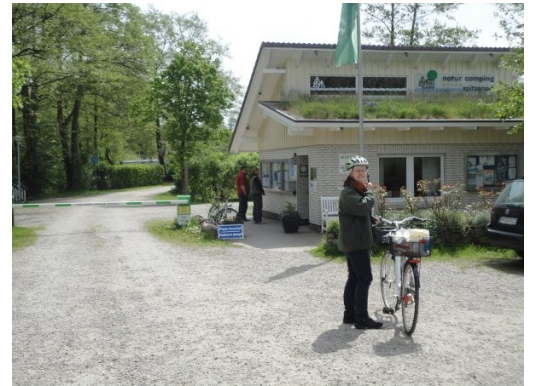
Indgangen til Naturcamping Spitzenort

hjemmefra. Da vi havde fourageret og nydt det i solen, var det efterhånden blevet tid til, at vi skulle orientere os om, hvordan der så ud på campingpladsen, som ligger på en landtunge ud i Grosser Plöner See. Undervejs på rundturen nyder vi udsynet over søen, og må erkende, at det ikke bliver til en tur på cykel rundt om søen. Det er for langt. Efter at have undersøgt campingpladsen og afprøvet nogle af faciliteterne, bliver vi enige om, at vi vil gå op til Koppelsberg, for at se hvad det for aktiviteter, de har på det Evangeliske Jugend, Freizeit und Bildungsstätte, Koppelsberg. Vi tager "tennisskoene" på og går ad cykelstien op til stedet, hvor vi går gennem porten ind på området. Her er opstillet landbrugs- og skovdyrknings-