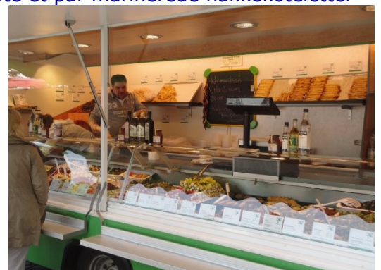
Den Græske Ostemand i Plön