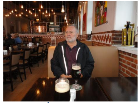
På Skagen bryghus

"bundvandet", og da vi skulle til at køre forbi vejen ind til Lønstrup, fik vi øje på et skilt med wc lidt inde af Lønstrupvejen. Hurtigt blev rattet drejet, og jeg tror, jeg glemte blinkeren, men vi fik os lettet og kunne nu fortsætte ad vejen mod Lønstrup. Fra Lønstrup kørte vi samme vej ud af byen, som vi havde gået i forgårs. Snart var vi fremme ved Klitgård Camping & Hytteby, hvor vi brugte kortet til at lukke os ind på campingpladsen. Fremme ved campingvognen fik vi bilen parkeret og skyndte os ind i campingvognen, så vi ikke nåede at blive alt for våde. I campingvognen var det noget køligt, for vi havde slukket for varmen, da vi kørte i formiddags.