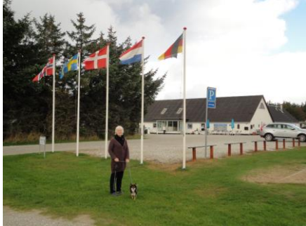
Klitgård Camping & Hytteby

Efter en god nat søvn stod vi op ved godt 8-tiden, og fik morgenmad og hyggede os. Lidt før kl. 11.00 vinkede vi farvel og satte kursen ad landevejen mod Ålborg. I udkanten af Ålborg valgte vi at tage Humlebakken op forbi Øster Uttrup Kirke og kørte ned på motorvejen mod Limfjordstunnelen. Igennem tunnelen var hastigheden sat ned til 50 km/t. Hvorfor, fandt vi ikke ud af, men kom uden problemer frem til, hvor motorvejen deler sig. Vi fortsatte ad motorvejen mod Hirtshals, og da vi senere kørte forbi Brønderslev, snakkede vi om, at jeg som barn havde været på ferie i Brønderslev. Hvordan mon der ser ud der, hvor jeg ferierede for små 50 år siden. Det må vi se efter en gang, når vi ikke har campingvognen spændt efter bilen. Vi fortsatte videre, og drejede af ved Vrå afkørslen. Nu gik det ad mindre veje forbi først Vrejlev Kloster og senere Børglum