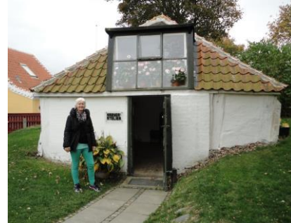
P. S. Krøyers Atelier