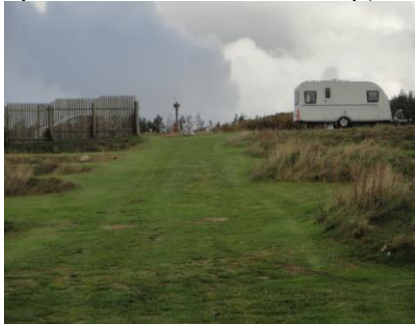
Campingvognen på bakken