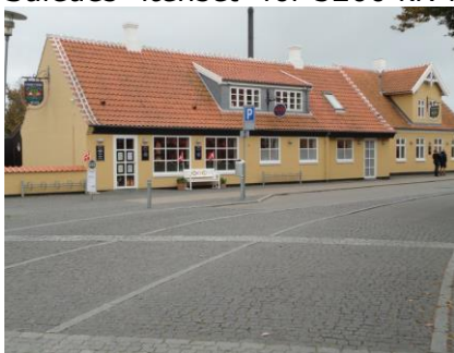
Slagter Munch's butik

Slagter Munch's butik, hvor vi købte et par spegepølser, og nogle peberbidder (med og uden chili). På vej ud af Skagen syntes vi, at vi havde fortjent en øl, så vi gik ind på Skagen bryghus , hvor vi købte 2 Skawskum, som vi nød. Det endte med, at vi købte nogle forskellige øl med hjem, både til gave og til eget forbrug. Nu var klokken efterhånden blevet 15.30, så vi begav os hjemad mod campingvognen. Det var begyndt at regne, men vi besluttede os alligevel for at køre over Hirtshals, så vi lige kunne tage et vue over havnen. Krabbekløer blev det ikke til denne gang. Da vi var blevet lidt trængende, holdt vi øje på om der kom et toilet, så vi kunne læse