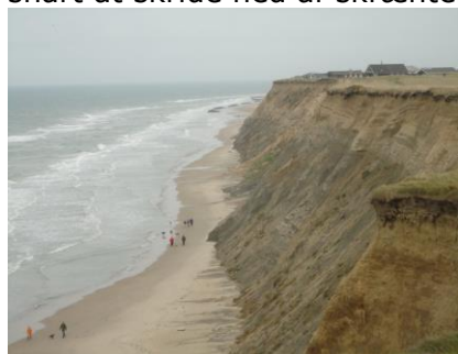
Klinten ved Lønstrup