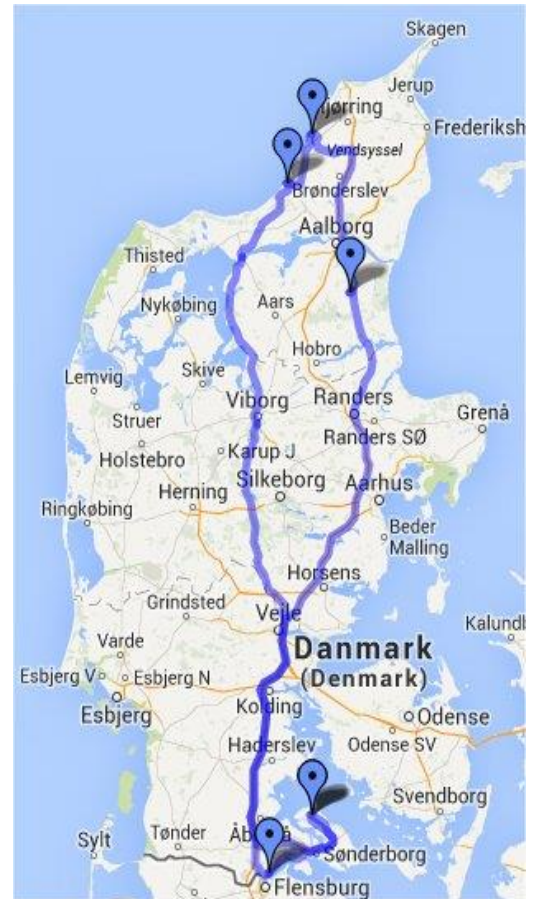
Den planlagte efterårs tur