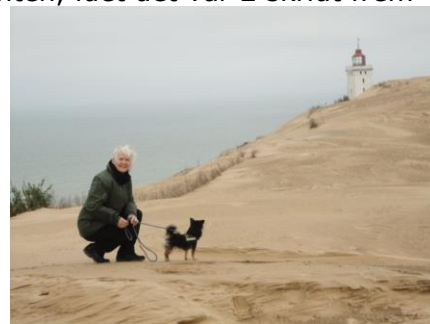
Rubjerg Knude Fyr

var større ting på stranden, eller hvis mågerne lettede et stykke foran os. Det så sjovt ud, når han forfulgte en lille fjer, som blæste af sted foran ham. Når han fangede den, slap han den straks, og så fløj den endnu en gang med ham bagefter. Vi gik i afslappet tempo mens vi nød havet, stranden, klinten og vejret, hvor solen indimellem tittede frem og gav det hele et fantastisk flot lys. Snart var vi fremme, lige syd for Rubjerg knude fyr , hvor vi kunne gå op ad skræntens løse sand. Vi måtte holde nogle pauser undervejs op ad skrænten, idet det var 2 skridt frem og 1 tilbage. Da vi var kommet op på klinten fik Chico snoren på, og vi kunne gå de sidste 2 – 300 m til fyret. Det gik op og ned af store klitter bestående af løst sand. Vi kunne se, at der var sket nogle skred i klinten, for fyret stod efterhånden ret tæt på kanten. Vi fortsatte op og ned af sandklitterne nord for fyret, og kunne se Lønstrup og resterne af Mårup kirke , som vi tog bestik efter. Nede imellem Havtornen fandt vi markeringen af Nordsøstien, som vi fulgte mod nord. Op og ned ad bakke slyngede stien sig gennem havtorn og lyng, og snart var vi fremme ved resterne af Mårup Kirke, som efterhånden ligger meget tæt på skrænten. Vi fortsatte videre ad Nordsøstien frem mod landingsstedet ved Lønstrup. Vi kunne se, at der efterhånden var flere sommerhus, som lå i fare for snart at skrیده ned af skrænten. Nogle var til salg, andre var rømmet og tømt for værdier. Ca.