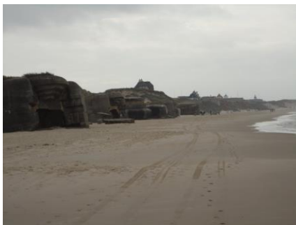
Bunkers på Løkken Nordstrand