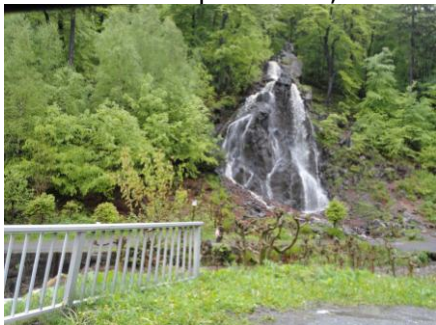
Vandfald ved Bad Harzburg