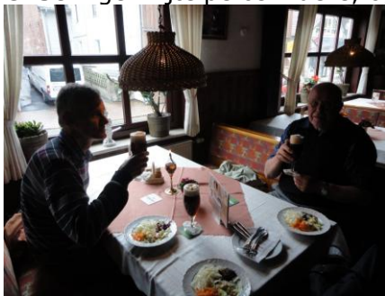
Middag på Mykonos