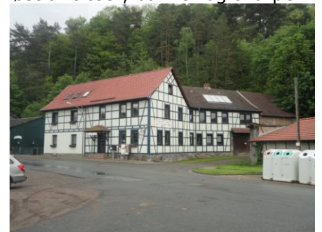
Landgasthof und Pension zum Felsenkeller