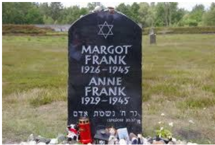
Mindesten for Anne Frank og hendes storesøster