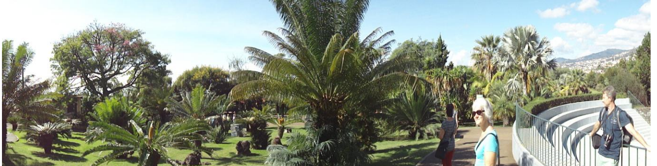
Fra Jardim Botânico

en godt nok smal sti, men stort set uden stigning eller fald. Vi var fremme ved den lette del. Indimellem forsvandt levadaen ned i rør for senere at komme frem igen. Et stykke tid efter vi var gået under motorvejsbroen, kom vi frem til starten af bebyggelsen i Funchals udkant, og skulle