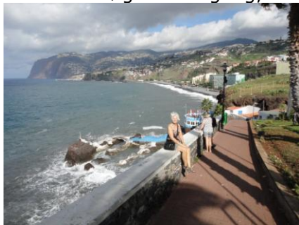
Udsigt fra Lidoen mod vest