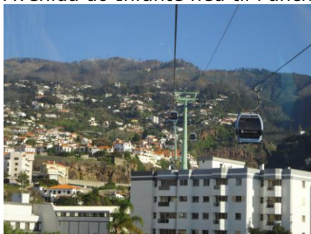
Udsigt mod Monte

Efter en god nats søvn stod vi op kl. 08.00. Airconditionen havde været tændt det halve af natten og hjulpet os med at have en perfekt sovtemperatur. Vi fik en dejlig morgenmad på altanen, hvor solen skinnede ind til os. ☀ Fra altanen kunne vi konstatere, at bjergtoppene var helt uden skyer og lå i sol, så vi besluttede os for at tage en længere tur på egen hånd op til Monte, Botanisk have, og gå ned til byen. Kl. 09.15 begav vi os ned ad Estrada Monumental og videre ad Avenida do Infante ned til Funchal centrum. Vi gik videre langs havnen og frem til svævebanen