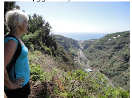
Udsigt ud ad dalen