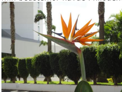
Estrelcia - Påfugleblomst

at gå ind til Funchal centrum. Vejret var sol og skyer, og med en temperatur på 27 °C, var det et perfekt vejr til at vandre i. Undervejs fik vi fotograferet nogle Estrelcias - Madeirablomster eller Påfugleblomster, som de også kaldes. I markedshallen kan man i øvrigt købe 10 stk. til 5 €. Det var nu ikke det, vi købte i markedshallen, men til gengæld fik vi smagt på og købt en masse forskellig frugt, som vi kan spise til morgenmad eller frokost. Vi kan nævne 4 slags Maracuja, Bananer, Æblebananer samt Philodendron frugt. Den sidste har jeg godt nok aldrig hørt om, selv om min bedstemor havde Philodendron i stuen, men den smager godt! Uden for markedshallen var vi