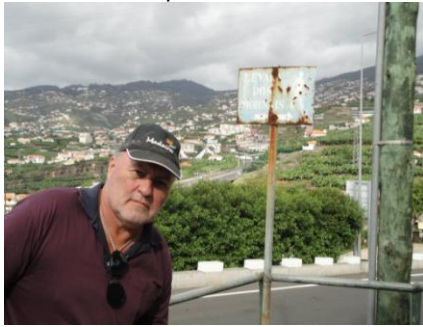
Vi fandt Levada dos Piornais

skulle tage bus 3 nede fra Avenida do Infante, lige efter vi var kommet over slugten ned mod byen. Buskort med 4 ture til bybusserne fik vi købt kiosken lige ved siden af hotellet, og vi kunne begive os ned mod byen ad Estrada do Monumental. Da vi var gået over broen over slugten, gik vi over på den modsatte vejside, hvor bussen skulle standse. 50 m før vi var ved busstoppestedet kom bussen, så vi fik lidt travlt med at skynde os hen for at komme med bussen. Det lykkedes, og vores buskort bippede os ind. Busturen var en oplevelse.