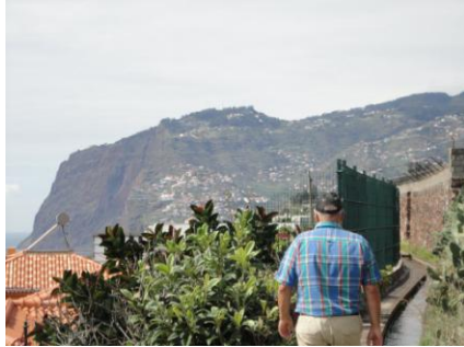
Langs Levada dos Piornais