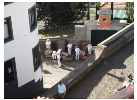
Udsigt ned til Monte slæderne

et stort maleri, hvor Maria stiger til himmels båret af jublende engleskarer. I sidekapellet ligger Østrig-Ungarns kejser Karl 1 i en sort sarkofag. Efter at have besøgt kirken, gik vi forbi monteslæderne og forbi svævebanen, vi var kommet op med. Vi gik videre til svævebanen Teleferico Monte – Jardim Botânico , hvor vi betalte 2* 16 € for en retur og indgangsbillet til den Botaniske have. Vi svævede ned over den brede og dybe Riberio de João Gomes, hvor der på grund af årstiden stort set ikke løb vand. En rigtig flot tur. Fremme ved Jardim Botânico gik vi rundt i et par timer i den 80.000m 2 store have, hvor vi så utallige spændende planter og træer. En stor oplevelse, som vi kan anbefale andre at prøve. Efter besøget var det tid til at tage svævebanen tilbage til Monte, hvor vi havde set et skilt til Levada do Bom Sucesso. Stien ned til Levadaen startede lige neden for bjergstationen på svævebanen, og bestod af en 2-3 m bred stenbelagt stil med enkelte gadelamper. Vi startede på det, vi troede skulle være en let levadavandring ned mod byen, men efter ca. en kilometer blev stien nærmest til et "gedespor" nedad i den vilde slugt, vi lige var svævet hen