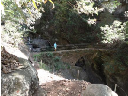
På vej mod Levada do Bom Sucesso

over. Det gik ned, det gik op, ad stier hvor der var lavet trappe-trin af træ eller sten. Trappetrinene, hvis de kan kaldes sådan, var støttepunkter, når det gik op og ned på den vilde dalside. Nogen steder var træer væltede, så vi måtte kravle under eller over for at komme videre. Undervejs mødte vi nogen, som gik modsatte vej, så vi følte os ved godt mod. Inden vi nåede frem til den værste del, gik vi forbi flere ældre, som gik sammen vej som os. Fremme ved den vildeste del tænkte vi på, om de nu kunne klare det. Efter en meget lang tur ad den vilde sti, nåede vi endelig frem til Levada do Bom Sucesso, som var helt tørlagt, og ikke så ud til at blive brugt mere. Nu gik vi langs levadaen på