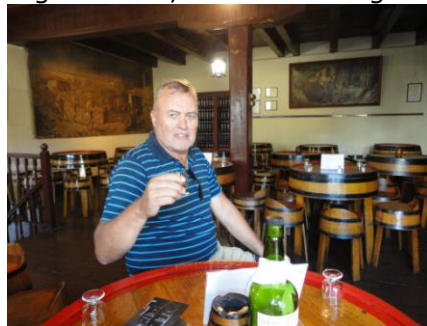
Prøvesmagning af Madeira

Vi vågnede veludhvilede kl. 08.30, og efter vi havde fået morgenmad, gik vi kl. 09.50 fra hotellet for at tage ind til Funchal centrum. Vi havde stadig 2 ture på hver vores buskort, så vi valgte at tage bussen, som ankom lige før vi kom hen til busstoppestedet. Heldigvis var der en del, der