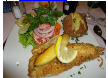
Espada med Banan

doen, som vi fulgte helt frem til hotellet. Vel ankommet til lejligheden var det tid til lidt hygge på terrassen, inden vi måtte under bruseren for at få sveden skyllet af og gå ud for at Spiese (spise). Vi havde valgt at gå til Spies "Velkomstmøde", da vi ville spise på "Solar da Ajuda" , hvor de holdt mødet. Vi ville have velkomstmiddagen, bestående af Hvidløgsbrød, Suppe, Espadafilé (fisk) med banan, frugtdessert, kaffe med likør eller brandy, og ½ flaske vin, for 24 € pr. person. Det var rigtig lækker, og nok af det. Efter maden kunne vi heldigvis "vralte" de 100 m hjem. (I luft linje har vi under 5 m til deres indgang, da vores lejlighed ligger på første sal næsten over restauranten). Vi hyggede os lidt på terrassen, inden vi besluttede os for, at finde den Poncha-bar, som vores guide Cliff havde fortalt om, som lå et par gader længere ud mod vest nede ved lidoen. Vi fandt let derud og fik en Poncha Regional hver for 5 € i alt. Det var en rigtig god Poncha, og vi besluttede os for at besøge dem nogle flere gange, da et glas Poncha er en rigtig god afslutning på en super dag. Så var det bare hjem for at få børste tænder og vælte om i køjen, for at indhente noget af den manglende søvn, så vi kunne være klar til morgendagens program. Hvad der kommer, ved vi ikke. Vi lader os overraske af vejret, og lægger planer ud fra det. – Godnat!