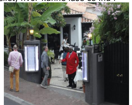
Udsigt over til O' Dragiero

Inden vi spiste aftensmad, på altanen, fik vi skrevet mail til vores kære derhjemme, og jeg fik skrevet lidt på beretningen. Aftensmaden nød vi på terrassen, mens vi fulgte med i hvad der skete på de restauranter, som lå side om side op ad gaden på den anden side af vejen, set fra vores altan. Specielt er der en restaurant skrå over for vores altan, hvor en "farvet" står og prøver at få gæster ind på restauranten – Det er meget underholdende, at se hvordan det lykkes, med friske bemærkninger og et glas Madeira for lige at gøre det sidste. Vi er blevet helt overbevist, og skal derover for at spise en af dagene. Efter aftensmaden var det tid til at gå til køjs og hvile ud til morgendagens oplevelser. Vi har talt om at det skulle være lidt en slappedag, men lad os nu se.