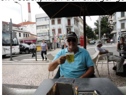
Øl ved Mercado dos Lavradores