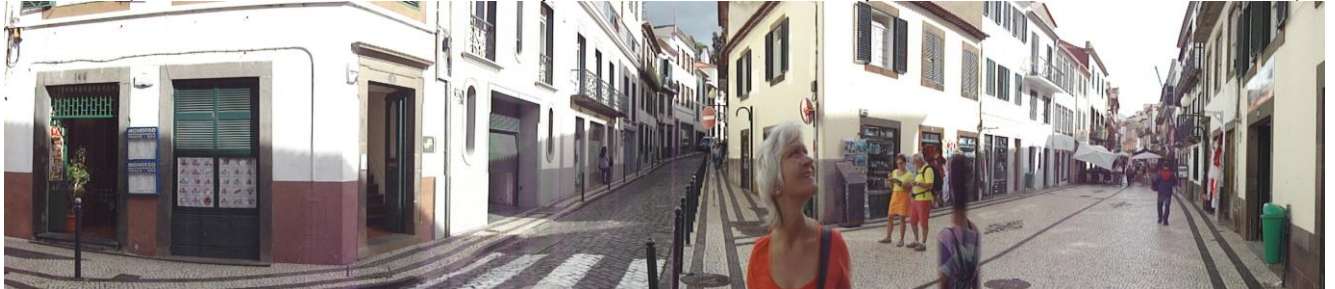
De små gader i Funchal