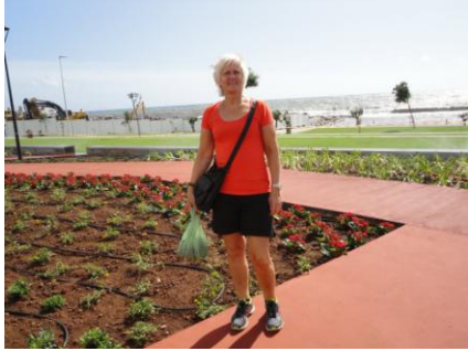
Det nye anlæg ved havnen

de eneste, der var også andre der ville se anlægget og udsynet over de store bølger, som slog ind