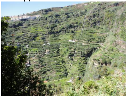
Den vilde dal Socorridos