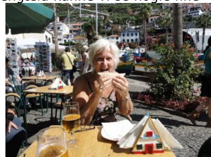
Frokost i Camara do Lobos