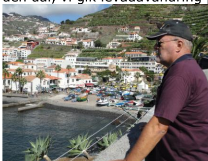
Udsigt over Camara do Lobos

vejen ned kunne vi rigtig nyde synet ud over det lille fiskerleje, og se bådene, der var trukket op på land. På en af bådene var der hængt fisk op til tørring – Hvilken fisk ved jeg ikke. Vi satte os ved en af de små barer, der er ved havnen, og fik lidt frokost bestående af en Tun-sandwich og en dejlig kold øl. Fra vores plads kunne vi se over til det sted, hvor Churchill have siddet og lavet sine malerier, når han var på Madeira. Hvilket han ofte var. Der er i dag en restaurant, som selvfølgelig hedder Churchills Place. Efter at have nydt øllen og sandwichen begav vi os samme vej tilbage mod vores hotel. Efter at have passeret det lille bådeværft, kunne vi se ind til Coral bryggeriet , som ligger gemt lidt inde bag cementfabrikken. De laver stort set alt det øl, der drikkes på Madeira – Og det smager rigtig godt! Man kan