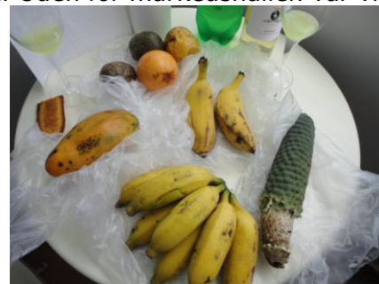
De indkøbte frugter