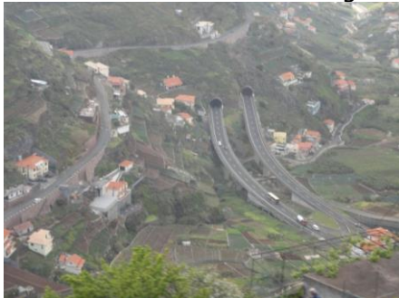
Udsigt fra bussen

Efter en dejlig lang nats søvn, vågnede vi veludhvilede og jeg var frisk igen, og efter morgentoi-lette var vi klar til at få morgenmad kl. 07.30. Efter morgenmaden gik vi ned til mødestedet ved