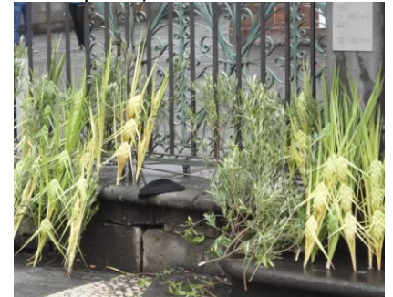
Palmegrene foran domkirken