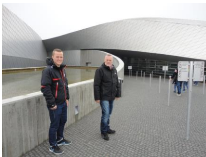
Den Blå Planet