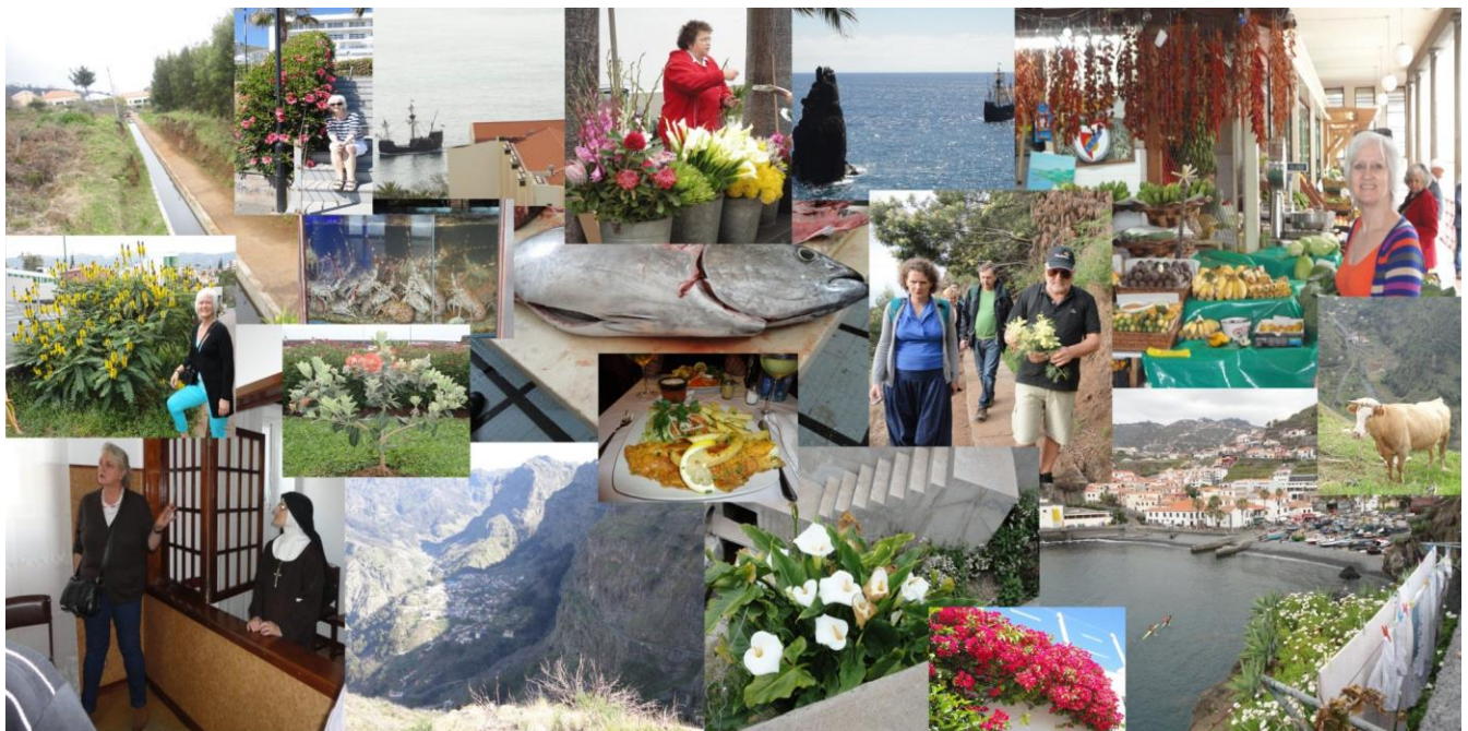
Stemningsbilleder fra Madeira