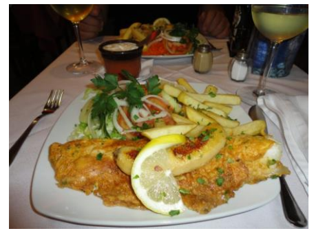
Espadafisk med banan

Spies havde at vælge mellem, men gav også forskellige fif, hvis man ikke ville deltage i deres arrangementer. Efter mødet fik vi en "velkomstmenu" bestående af 4 retter, med Espada-fisk som hovedret, og Kaffe og Brandy som afslutning. Efter at have spist en fantastisk velsmagende og spændende menu, "væltede" vi ud af lokalet, og var nødt til at gå en omvej hjem til hotellet, imens vi "slog mave". En oplevelse af et måltid og til den pris! Hjemme på hotellet fik vi et bad, inden vi godt trætte kunne slappe af og gøre klar til morgendagens oplevelser på Madeira. Nu er der kun at sige Godnat og Obrigado! (Kvinde: Obrigada!)