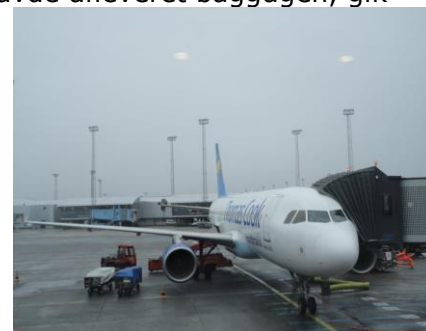
Thomas Cook til Madeira