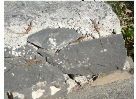
Firben i solen