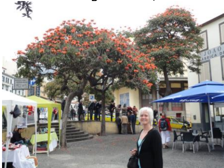
På vej til øl-pause

vi drejede op i de gamle smalle gader. Vi gik gennem Rua de Santa Maria, hvor der var masser af små serveringssteder / cafeer. De var ikke åbne endnu, så vi fortsatte frem til floden Riberia de