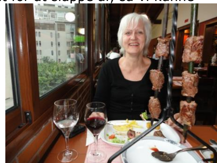
Der spises Espetada

land de stammer fra. På vej ud af parken drejede vi lige forbi porten ind til præsidentens bolig, hvor der stod en betjent på vagt. Vi fortsatte ud ad Estrada Monumental og kom efterhånden frem til vores hotel, Four Views Monumental, hvor vi afsluttede dagens tur kl. 17.10. Vel oppe på værelset var vi blevet godt trætte, så vi besluttede at lægge os lidt for at slappe af, så vi kunne være klar til, at gå ud for at spise senere på aftenen. Vi havde besluttet os for, at vi ville gå til restauranten " Frango da Guiia ", for at spise "Espetada". Restauranten ligger på første sal, hvor der er en Fiskerestaurant i stueetagen, og på første sal er det så en kødrestaurant – Egentligt smart! Inde i restauranten blev vi modtaget af et meget venligt, vidende og hjælpsomt personale. Vi fik bestilt en hummercremesuppe med et glas hvidvin. Da vi ville have " Espetada ", ville vi også have rødvin til, men vi kendte ikke rødvinns mærkerne, så tjeneren spurgte lidt ind til og anbefalede en rødvin til 15.50 €, som vi selvfølgelig tog. På kortet var rødvin fra 14 € til 64 €, så vi må sige, at han var menneskekender og ikke bare ville "score kassen". Han var som sagt meget hjælpsom og opmærksom – lige en tjener efter midt hjerte. Efter et velsmagende måltid var vi tilbage på værelset kl. 21.40, hvor vi hyggede os, indtil vi gik i seng, for at være klar til morgendagens strabadser – Morgendagen bliver vist hårdst for bussen.