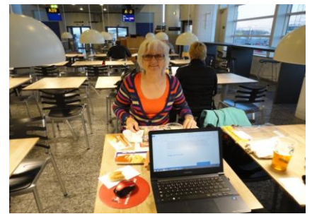
Ventetid i CPH