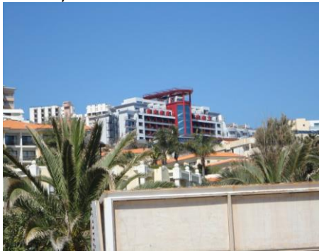
Hotel Four Views Monumental