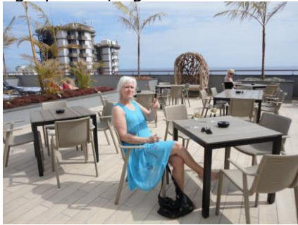
Hvidvin ved poolen