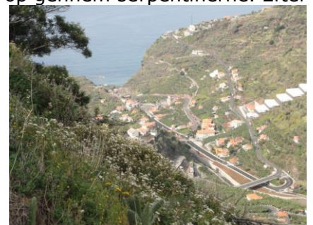
Udsigten på Levadavandringen