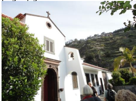
Santa Clara Klosteret

I dag havde vi meldt os til turen ind til Nonnernes dal , så vi stod op kl. 07.10, så vi kunne være klar til at "hoppe på bussen" kl. 08.55. Efter morgenbuffeten, denne dag med et lille glas champagne, gik vi ned til Porto Mare, hvor vi stod på bussen. (Champagnen er der hver dag). Dagens