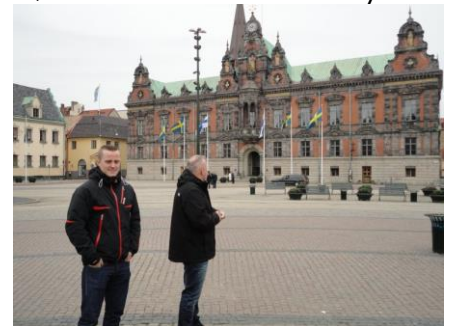
Carl Adolfs Torg