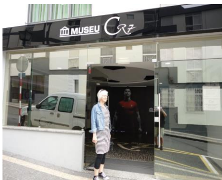
Christiano Ronaldos Museum