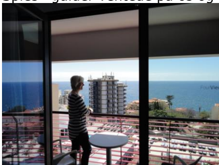
Udsigten fra værelset

tørsten og sad og nød en Poncha eller to på terrassen sammen med lidt saltede chips. Efter en times tid ville vi gå ud for, at se lidt på omgivelserne, men da vi kom ned, var de rødblusede ved at sætte bagagen ind i receptionen, så det fik vi lige smidt op på værelset, inden vi gik en kort tur på Lidoen. Vi gik ned forbi Gorgulho, som jeg havde boet på for godt 30 år siden. Det så lidt simpelt ud i forhold til, hvor vi boede nu. Vi fortsatte ned langs Lidoen og nød udsigten over vandet og de mange buske / træer med blomster. Der blev fotograferet til den "store guldmedalje", så flot var det. Nu var det snart tid til at gå til velkomstmødet på Solar Da Ajuda , som lå lidt oppe ad sidegaden ved hotellet. Guiden fortalte spændende og levende om Madeira, og hvilke ture