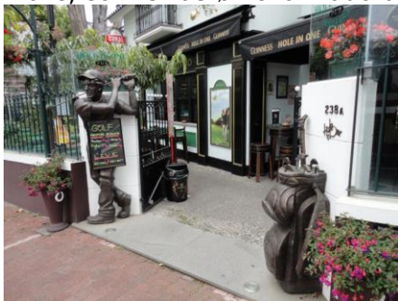
En Pub i Funchal