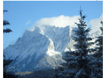
Udsyn mod Zugspitze