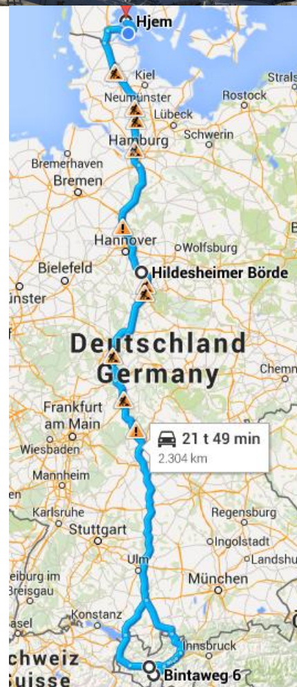
Den planlagte tur (ud og hjem)