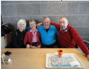
"20 års jubilæum"

Som de andre dage vågnede vi klokken 07.30, men denne gang var det vores sidste dag på ski for denne gang. Denne gang skulle vi tage vores støvletasker og skiposer med op i skikælderen, så vi var klar til at pakke dem væk, når vi kom ned om eftermiddagen. Vi fik skistøvlerne på og