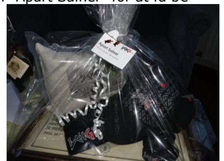
"15 års Urkunde"