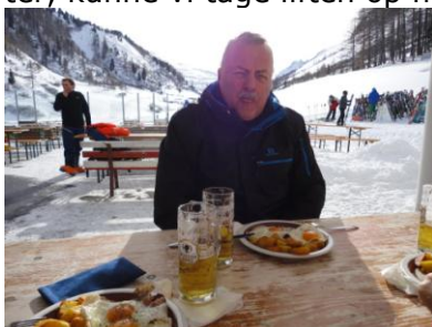
"Kold frokost" på Bodenalp

Da vi stod op kl. 07.30, kunne vi, på vores 26 års bryllupsdag, se solen ramme spidsen af de højeste bjergtoppe. Efter morgenmaden gjorde vi os klar til, at gå op til liften, som kørte igen efter arbejdet i går. På turen op til liften kunne vi se, at solen nu ramte et større stykke af bjergtoppene. Vi fik hentet skiene i skikælderen og kom op til liften, hvor der var kø, men efter 5 minutter, kunne vi tage liften op mod Pardatschgrat. Klokket 09.10 kunne vi gå ud i solskinnet. Vi