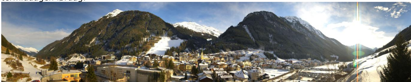
Ischgl 22. januar 2015