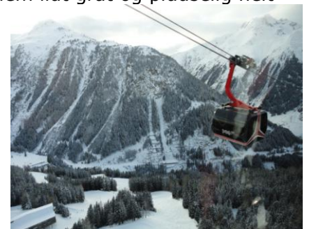
Udsigt fra liften – Ny Lift