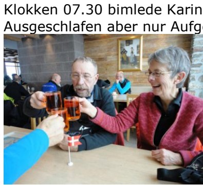
Tid til en "Jagertee"