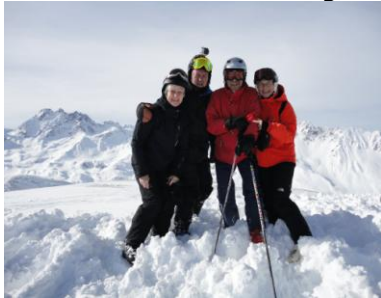
Fire venner i sneen