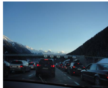
"Mautstelle am Arlbergtunnel"

Klokken 20.40 krydsede vi Elbtunnellen, også kaldet "Lakridsgrænsen" (Der findes kun god lakrids nord for). Fremme ved Hildesheimer Börde, kl. 22.25, var det som sædvanligt tid til, at "Flammen" fik slukket tørsten, og vi andre fik lettet os lidt, inden vi fik en god kop kaffe og en Laksemad til at køre videre på. Efter en god ½ times tid, gik det videre ned ad A7. Da vi var inde for at få en kop kaffe på Hildesheimer Börde, undrede vi os over, at vi var de eneste, der var der – Det har vi aldrig tidligere prøvet. Vi kom også til at tænke på, at der faktisk ikke var ret meget trafik på Autobahnen – Hvorfor mon? Længere fremme prøvede vi at køre uden, at kunne se baglys foran os og heller ingen forlygter bag os. Underligt.