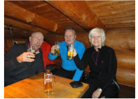
Afterski på Nickis Stadl