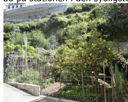
Citrontræ i Rio Maggiore

stop i Cinque Terre. Vi fik hoppet på det korrekte tog og kunne stå ud på stationen i den sydligste af byerne og gøre klar til at gå det halve af turen gennem Cinque Terre. Temperaturen var efterhånden oppe på ca. 25 °C, og der var ikke mange skyer på himlen. Vi gik ind for at købe vandrekort, for at gå på Cinque Terre-stierne i 2 dage, men vi fik at vide at Via dell Amore, som er Cinque Terre stien langs vandet til Manarola er lukket pga. fare. Stien fra Manarola og til Corniglia var allerede lukket pga. skred, da vi var her sidst for 4 – 5 år siden, og stadig ikke repareret. Vi fik at vide, at vi kunne købe vandrerkortet, som også gav mulighed for at tage toget til Corniglia, men at vi også kunne gå ad andre stier, op over bjergene, og at det ikke krævede vandrerkort for at gå til Manarola og Corniglia. Jeg tænker, vi var heldige, at vi ville starte i syd enden, for havde vi startet i nordenden, så havde vi nok købt et 2-dages vandrerkort. Nu kunne vi vente til en anden dag, og nøjes med at betale € 15,- i stedet for € 29,-. Vi gik først hen for se, hvor Via dell Amore startede, og her var stien lukket med en gitterlåge. Der fra hvor vi stod, kunne vi ikke se problemer med stien, men da den ligger helt ude på kanten mod havet, så kan et stormvejr have ødelagt den. Da