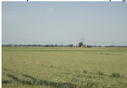
Po deltaets flade landskab