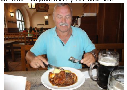
Schweinshaxe und ein Maas Dunkel