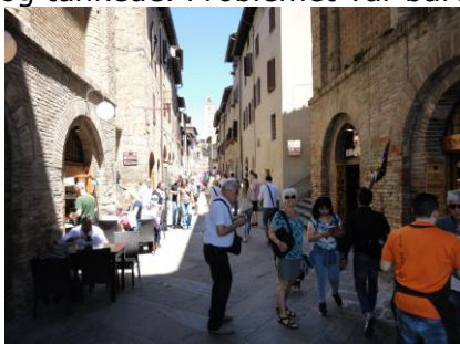
I San Gimignano

Da det er søndag, sov vi lidt længere end vi plejer, og da vi stod op kl. 08.20, var det til 15 °C og solen, der skinnede fra en skyfri himmel, så vi kunne nyde morgenmaden, mens vi ledte efter små skyer på den flotte blå himmel. Vi fandt ingen. I dag var så dagen, hvor vi ville lidt rundt i Toscana, for at nyde det flotte landskab og de flotte byer, så ved 11 tiden kørte vi fra campingpladsen. Først skulle vi lige finde en tankstation, og GPS'en sagde straks, at der var en i landsbyen, så vi kørte forbi. Den var bare lukket, så vi fortsatte mod Siena, og i Volte Basse, stod nogen og tankede. Problemet var bare, at man skulle betale forud med penge, og da vi kun havde € 50