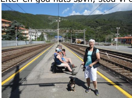
Stationen i Deiva Marina

Efter en god nats søvn, stod vi op kl. 08.00. Temperaturen var allerede oppe på 16 °C og stigen. Vi havde besluttet os for, at vi skulle ud at gå i Cinque Terre. Vi nød morgenmaden i fred og ro i det dejlige solskin, og kl. 10.30 kunne vi tage campingpladsens lille "shuttlebus", som kørte os de 3 km ned til stationen. Vi havde besluttet os for, at starte gåturen fra Rio Maggiore og tage samme rute som sidst, vi var i Cinque Terre. Der var problemer med billetautomaten, så vi gik over i en tobaksforretning, hvor vi købte billetter til Rio Maggiore og retur. Tilbage på stationen ventede vi lidt på toget, som vi skulle tage til Levanto, og der skifte til et andet tog, som kørte i fast rutefart mellem Levanto og La Spezia. De tog som kom længere væk fra kørte direkte igennem uden