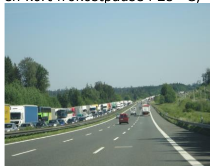
14 km Stau

til køen, kunne vi se "staklerne" der holdt så langt øjet rakte, og det blev ved. Kl. 13.00 var vi nået frem til "Innere Deutsche Grenze", hvor vi fik tanket og holdt en kort frokostpause i 25 °C, inden vi fortsatte ind i Thüringen. Vi kom igennem flere vejarbejder, men uden forsinkelse af betydning, så kl. 16.45 var vi fremme ved campingpladsen "am Mahlower See" og kunne tjekke ind for 2 overnatninger. Temperaturen var 27 °C, da vi havde stillet campingvognen op og kunne nyde en "rejsegilde øl" i skyggen foran campingvognen. Senere gik vi over til badesøen på den anden side af gaden, hvor der er en restaurant, og her fik vi et par Schnitzler med tilbehør som aftensmad. Og selvfølgelig en fadøl til. Tilbage ved campingvognen slappede vi af og kiggede lidt på U- og S-Bahn nettet, så vi er lidt forberedt morgendagens udflugt.