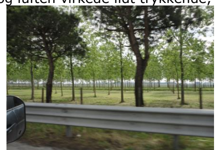
Opstammede træer med hø-slet under

Efter endnu en varm nat med 20 °C stod vi op kl. 08.00, hvor vi spiste morgenmad, inden vi gik op for at afregne € 61,60. Tilbage fik vi gjort klar til turen mod Venedig. Markisen havde vi taget ned i aftes, så vi undgik duggen. Der var en del skyer på himlen, og luften virkede lidt trykkende, som om der skulle komme regn, hvad vejrudsigten også havde truet med. Da vi var færdige med at pakke og koble campingvognen på bilen, måtte vi vente 5 minutter på, at der kom en og kobledede strømmen fra. Kl. 09.45 trillede vi ud fra campingpladsen i 22 °C, og med skyer hvor solen tittede frem indimellem. Ude ved den "bumpede" vej fra Ravenna til Venedig, satte vi kursen mod nord mod Camaccio, hvor vi så et par Traner ved Po deltaet. Vi fortsatte over Po sletten, der var flad så langt øjet rakte, og det var faktisk langt, selv om der var mange træer på sletten, for de var alle opstammede i 3 - 4 meters højde, og så