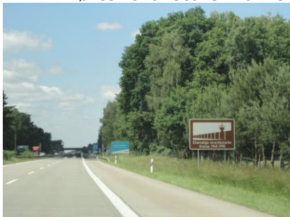
Innere Deutsche Grenze