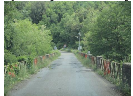
På vej mod Siena