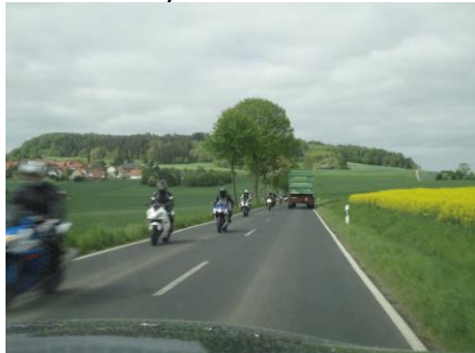
På vej fra Am Hohen Hagen

Efter en god nats søvn stod vi op, fik morgenmad og gjorde os klar til at køre videre. Kl. 10.20 kørte vi ud af campingpladsen, temperaturen var nu nede på 9 °C og selv om det var overskyet, kunne vi nyde en fantastisk flot køretur ned fra Am Hohen Hagen med op til 10 %, gennem Erholungsgebietet ved Gausturm og kl. 10.50 kørte vi ud på A7 med retning mod syd. Trafikken var ikke så slem som i går, så vi slap helt uden kø på dagens tur. Undervejs hørte vi at vejrudsigten for i morgen, i Kasseler Berge, var mulighed for snebyger eller slud på steder over 800 m.o.h. Vi nød turen, som bød på både skyer og solskin, og fremme ved Riedener Wald holdt vi kl.