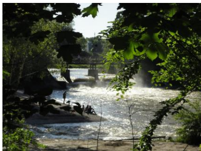
Solen nydes ved Isar