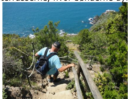
Smuk udsigt, svært terræn

Over en lang strækning var der kun små stigninger og fald på stien, som indimellem gik gennem træbevoksning og gav en dejlig skygge for solen, som bagte ned fra en næsten skyfri himmel. Vi kunne se Corniglia dybt under os, og det så ud, som vi bare gik forbi byen, men snart begyndte det, at gå stejlt ned mod byen, ja vi kunne ikke se byen, men fornemmede at den lå et stykke bag os. Også her var der lagt sten som provisoriske trappetrin, med stor variation af trindhøjden, helt op til 50 cm. Det sidste stykke begyndte der at være rigtige trappetrin, som aflastede benene lidt, men vi kunne godt mærke, at det var godt vi havde besluttet os for at gemme resten af Cinque Terre til en anden dag. Nede i Corniglia fandt vi en bar, hvor vi bestilte 2 normale cola og 2 fadøl. Først drak vi colaen for at få oprettet sukkerballancen, og bagefter nød vi øllen. Vi havde ikke glemt Chico, som fik lidt af det vand, vi havde med til ham og et par godbidder. Efter at have nydt den