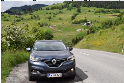
På vej mod Serfaus, Fiss, Ladis

Så er det blevet weekend igen, så vi sov lidt længere end de andre dage. Vi stod først op kl. 08.45, hvor temperaturen var 14 °C i skyggen, for solen skinnede igennem skyerne, men nåede ikke helt ned til os i dalen. Efter vi havde spist morgenmad gik vi kl. 10.00 en tur over på den anden side af floden Inn, hvor selve byen Prutz ligger. Vi gik en tur gennem midtbyen, inden vi gik tilbage til campingpladsen, for det vi havde glædet os mest til lå foran os, nemlig en køretur