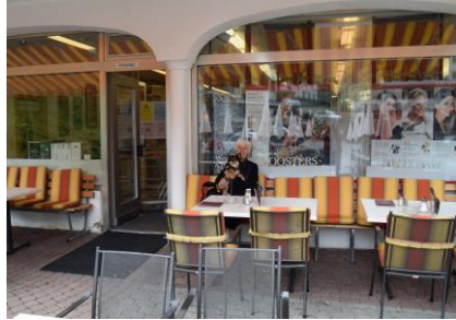
Ved Hermelindes i Samnaun

billeder, og kunne høre kobjælderne fra en flok køer, som gik ude på marken. Nu gik det igen nedad mod Ried ad en stejl, smal vej med mange serpentinesving og flotte udsigter. Nede ved den store vej, satte vi GPS'en til at finde til Samnaun, som kun lå 30 km væk. Samnaun har vi kun besøgt om vinteren, så vi ville gerne se hvordan den så ud uden sne. Også her kørte vi ad en smal, stejl (13 %) kurverig vej med masser af hårnålesving. På vej op mod Samnaun fik vi nogle stænk af regn på ruden, og da vi parkerede udenfor byen, var der også vand i luften. Ikke noget