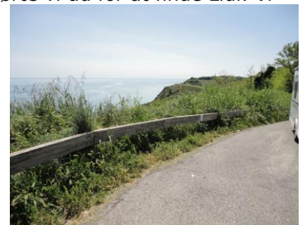
Udsigt over Adriaterhavet