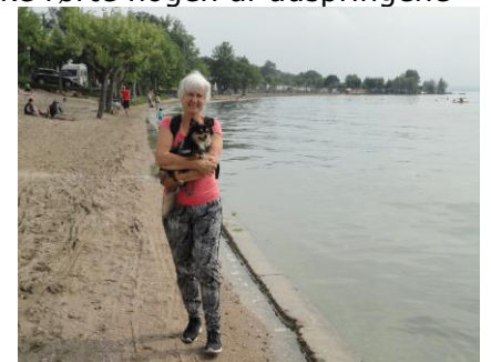
Stranden ved Fossalta