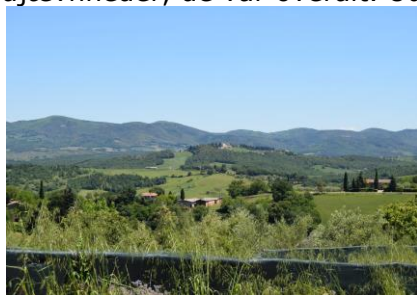
Det Toscaniske landskab

At vågne mandag morgen og se ud ad vinduet, gav noget af en overraskelse, efter gårsdagens vejr, og at der havde være stjerneklart og "blodmåne" i aftes. Det var næsten helt overskyet, og mange af skyerne var mørke, da vi stod op kl. 08.30. hvor temperaturen var 15 °C. Jeg behøver vist ikke at skrive "i skyggen", for der var "skygge" over det hele. Der var blevet lidt huller i skyerne, og temperaturen var steget til 17 °C, da vi kl. 09.45 kørte ud ad porten fra campingpladsen, med kurs ad de små kurvede veje mod Siena. Ved Siena kørte vi ud på motorvejen, men denne gang, modsat af i går, nemlig med retning mod Perugia. Vejen mod syd fra Siena var lige så ujævn som den mod nord, og når der ikke var trafik bag os, kunne jeg køre slalom mellem huller og store ujævnheder. Et sted kunne vi se en golfbane, der havde i hvert fald et hul helt op mod vejen. Lige efter vi kørte ud af Toscana og ind i Umbrien, havde vi udsigt ud over en meget stor sø, Lago Trasimeno. Selv om vi kørte gennem flere tunneller, så blev vi ved med at følge søens nordlige bred. Ca. 10 km før Perugia drejede vi af, for at køre ad mindre veje mod Fano, og vi glædede os til at blive fri for ujævnhederne, men Italien fattes penge, så fra at vejen havde været umulig, så blev det en katastrofe. Her kunne vi ikke komme uden om huller og store ujævnheder, de var overalt. Ud over der var skiltet med ujævn vej, var der også hastighedsbe-