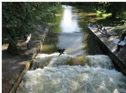
Der surfes på Isar

ren hjemad. Vi kunne mærke, at vi var tanket op med frisk energi, så gåturen hjemad tog kun 5 kvarter, og da vi nåede den lille bro ved campingpladsen kunne vi se, at der var mange unge mennesker, som nu stod på surfbrædt på "stryget" under broen. Chico syntes dog at vi hellere skulle gå hjem end stå og kigge, så han trak af sted med os, og kl. 18.15 kunne vi, med 21 °C i skyggen, og 26,5 °C i campingvognen sætte os ud i solen og nyde et par store glas vand og efterfølgende et enkelt glas rødvin. Vi havde haft solen skinnende fra en skyfri himmel næsten hele dagen. Vi nød et glas rødvin mere i solen, inden de høje træer begyndte at skygge for solen, og vi trak ind i campingvognen for at hygge os til sengetid. Vi har haft en utrolig dejlig dag, med overraskende meget sol – Det havde vi ikke forventet efter alle de skyer, der var på himlen, da vi gik i seng i går. Nu er vi spændte på hvordan vejret bliver til vores videre tur i morgen med kurs mod Berlin. ☺