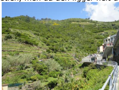
Mellem Rio Maggiore og Manarola

det allerede var før sidste sæson at stien blev ødelagt og 5 – 6 år siden den næste sti blev ødelagt, undrede vi os over at man ikke havde repareret dem eller lavet nye. De tjener mange penge på de tusinder af vandrerere som hver dag, betaler € 7,50 for at gå 1 dag på stierne. Nå, vi fulgte de andre vandrerere gennem byen, og snart kom vi frem til, hvor stien mod Manarola begyndte opstigningen ad nogle fine trapper. Det varede dog ikke længe inden det blev natursti, hvor trin af forskellig højde var hugget i klippen, eller naturstenene var lagt som trappetrin. Det var en meget hård gåtur / klatretur op ad bjerget, men hele besværet værd. Vi havde det ene fantastiske vue efter det andet,