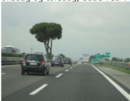
På vej mod Lazise

Da vi var i Lidl i går, talte vi med en dansker, som fortalte, at det skulle blive regn og dårligt vejr onsdag og torsdag, både ved Venedig og ved Gardasøen. Da vi vågnede her til morgen kl. 08.25