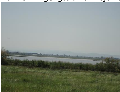
Ja, det er Flamingoer

Det var dagen, hvor vi ville videre til næste sted, men vi havde ikke travlt, da der kun var 109 km, så vi stod op kl. 08.15. Solen skinnede fra en skyfri himmel, og det var 16 °C, da vi fik morgenmad. Kl. 10.25 havde vi betalt € 40,80 for 2 overnatninger, og var klar til at forlade campingpladsen Panorama i 23 °C. Vi havde valgt, at vi ville undgå "betalingsveje", da vi havde god tid, og vi gerne ville se lidt til landskabet og de byer, vi kom igennem. Der var nu ikke meget at se i byerne, idet der var omfartsveje de fleste steder. Ved Rimini kom vi til et stort lyskryds, hvor der gik negre, undskyld farvede og ville vaske ruder for bilisterne, når de ventede ved rødt lys. Vi fortsatte nu ud over Po sletten, hvor landskabet var helt fladt, helt ind til bakkerne op mod San Marino. Til gengæld var vejen så ujævn, at bulerne her var højere end ujævnhederne i det flade