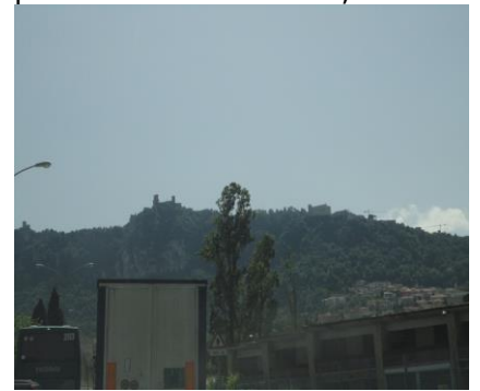
Udsigt mod det gamle San Marino