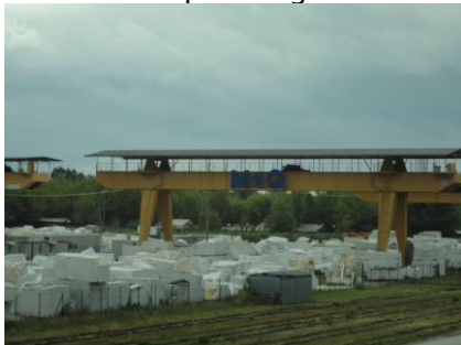
Marmorblokke ved Carrara