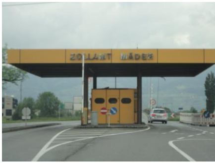
Grænseovergangen til Schweiz

ud på sydsiden, var det en helt anden verden. Temperaturen var nu 14 °C og flot solskin, som vi nød de næste 15 km, hvor det gik 8 % nedad. Efterhånden steg temperaturen til 17 °C i solen, og vi gjorde holdt og fik et pølsebrød til frokost. Vi fortsatte ad de sidste 10 km med 8 % og efter endnu flere kilometer, hvor det gik nedad med mindre %, kom vi til Bellizona kl. 12.40, hvor temperaturen var 20 °C, og solen stod ned fra en skyfri himmel mellem bjergene. Vi havde helt lyst til at finde et sted at stoppe, for udsigten var fantastisk ligesom vejret. Fremme ved Lugano havde temperaturen sneget sig op på 21 °C og da vi kørte over grænsen til Italien sagde den 22 °C, så vi fortsatte mod Milano med højt humør. Før Milano måtte vi betale motorvejsafgift 2 gange, tilsammen € 5,30. Om vi havde fået solstik, ved jeg ikke, men vi kiksede en afkørsel i Milano, og måtte tage næste afkørsel for at komme tilbage på rette spor, og så gik det mod Genova, efterhånden i 24 °C og høj solskin. De sidste kilometer ad motorvejen ned mod Genova var en oplevelse, hvor vi tilsyneladende kører på den gamle vej, og trafikken modsat kører igennem tunneller på en nyere vej. Der var masser af udfordringer på vores del,