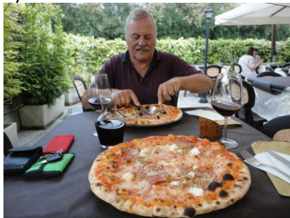
Nej Karins Pizza er ikke større

Så er det weekend, og så skal det ikke være, som det plejer. Selvom vi vel har haft den varmeste nat på turen, og havde haft lidt besvær med at sove, så stod vi alligevel op kl. 08.00. Vi skal jo nyde når det er weekend. ☺ Solen skinnede fra en skyfri himmel, og det var allerede 20 °C, det