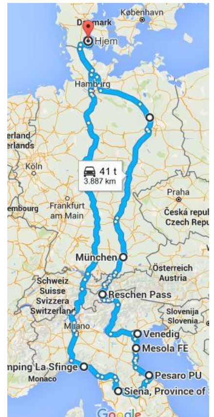
Lige nu er dette bedste bud på ruten.