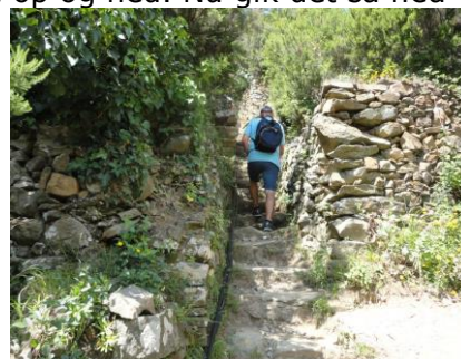
Op ad mod Volastra