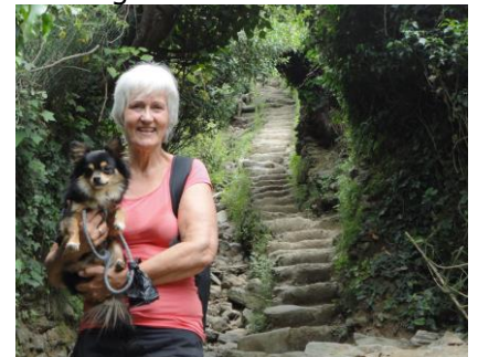
Mon vi klarer trappen?