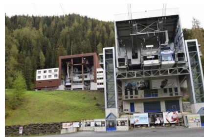
Liftene i Samnaun