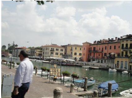
Kører igennem Peschiera del Garda

Efter en aften hvor der kom en tordenbyge på en lille times tid, havde det givet en dejlig frisk luft, så vi kunne sove lige til kl. 08.30. Der var 16 °C udenfor og 19 °C i campingvognen, så det havde givet en dejlig afslappende søvn. Selvom det var skyet da vi stod op, var der kommet hul i skyerne, så solen kunne komme frem, da vi kl. 10.30 kørte ud på vores tur rundt om Gardasøen.