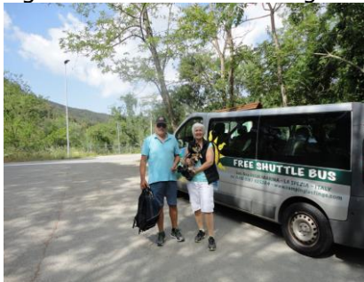
Shuttlebussen i La sFinge