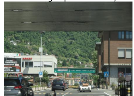
Grænsen mod Italien

med skarpe kurver og smalle spor på motorvejen, men en dejlig oplevelse at prøve. Ved Genova skrev de på skiltene, at Tifosis til Genovas kamp skulle køre af ved Genova Ovest, så vi fortsatte mod Genova Oest og efter ca. 25 km med utrolig mange tunneller, kunne vi kl. 17.00 dreje af mod Deiva Marina. I betalingsstationen, skulle vi betale € 21,90 for motorvejskørslen. 10 minutter senere holdt vi i 19 °C ved receptionen ved campingpladsen La sFinge. Der var desværre ingen ledige nummererede pladser, men vi kunne få en overnatning på pladsen lige inden for receptionen, så den tog vi. Vi blev faktisk på pladsen flere dage, idet vi fandt den plads bedre end de små nummererede pladser med skygge. Vi nød en ankomst øl foran campingvognen, og fik set os lidt omkring, inden vi fik aftensmad og hyggede os, indtil vi gik til køjs. Her kl. 21.00 er der stadig 17 °C udenfor.