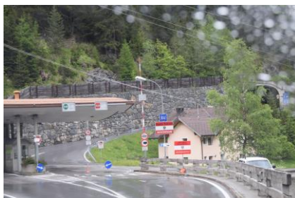
Grænsen mod Samnaun

særligt, men vi tog paraplyen med som sikkerhed. Vi gik op til Hermelindes, hvor vi plejer at holde pause om vinteren. Vi fik den samme plads foran butikken, og nød som vi plejer en kop varm chokolade mit Zahne (vi manglede dog rommen). Temperaturen var højere end den plejer at være, når vi har siddet der, men dog kun 13 °C. På skift var vi inde i den toldfrie butik for at se, om der var noget der kunne friste. Det regnede imens vi nød vores chokolade under markisen, og da vi havde betalt kunne vi gå ned til bilen, mens der kom nogle enkelte stænk. Fremme ved Shell tanken fik vi tanket diesel til € 0,856 pr. liter. Det billigste på turen og anden gang i et toldfrit område. Vi kørte samme vej tilbage, da der kun er 2 veje ind til Samnaun, og vi ville ikke køre en stor omvej. Vi kunne nu nyde de flotte udsigter, mens vi kørte ned mod vejen fra Reschenpass mod Landeck og sætte kursen tilbage til "Aktiv Camping" i Prutz. På vej tilbage fik vi handlet lidt i et supermarked der hedder "MPPreis", og det var en sjov oplevelse, for nogle af priserne var 1+1, altså 2 varer til et styks pris, andre var billigere pr. styk hvis man købte 2, men de fleste var som andre steder til den skiltede pris – Vi skulle i hvert fald se os for på prisskiltene. Da vi kom tilbage stod resten af dagen i afslapningens tegn.