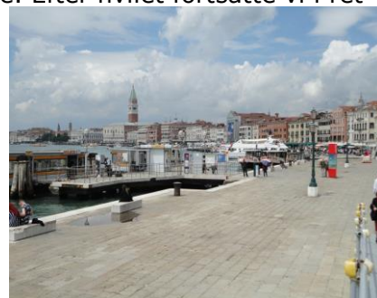
Riva Degli Schiavoni