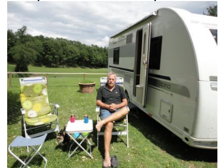
Sidder i "Nydningen"

Jeg vågnede kl. 08.00 og kunne fornemme, at solen allerede var ved at få magt, så jeg lavede en sprække ved rullegardinet, og kunne se, at solen stod flot klar på en skyfri himmel. Temperaturen i skyggen var allerede 17 °C, så stolene blev sat op foran campingvognen, så vi kunne nyde det i solen. Vi havde tænkt os at bruge dagen på afslapning og senere tage en køretur, men først skulle vi slappe lidt af i solen indtil frokost. Vi nød det rigtigt, så vi valgte at udsætte køreturen i det Toscaniske landskab til i morgen, og i stedet drikke et køligt glas Toscanisk hvidvin. Efterhånden blev solen lidt for skarp, og jeg blev nødt til at trække lidt i skyggen, men så kunne jeg få skrevet lidt, og vi kunne slappe af og nyde den flotte udsigt, vi havde fra pladsen foran campingvognen. Her kl. 13.45 er temperaturen i skyggen under campingvognen 23 °C, og solen stråler stadig fra en skyfri himmel. Resten af dagen blev brugt til "slappedag", så må vi se, hvad morgendagen bringer.