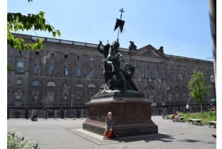
Skt. Georg og Dragen (dragerne)