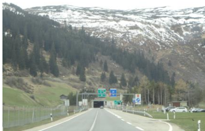
San Barnardino tunnelen