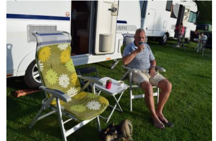
I "nydningen" Am Hohen Hagen