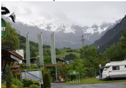
Aktiv Camping Prutz

Det er jo fars dag i dag, og det får mig til at tænke på, at man jo siger: "Fars er bedst når mor har rørt den", men vi fik hverken frikadeller eller det andet. ☺ Vi skal jo være klar til at fortsætte vores tur, så kl. 07.30 stod vi op i 12 °C, og fik gjort klar til afrejse. Det havde regnet det meste af natten, men nu var det tørvejr. Efter morgenmaden betalte vi € 40 for det 2 overnatninger på campingpladsen, som vi synes er rigtig skøn, og som vi gerne kommer tilbage til. I receptionen fik vi bekræftet, at Fernpass er Vignetten Freij, vi skulle bare holde os fra tunnelen fra Reschenpass på vejen ind til Landeck og motorvejen. Der kom regndråber på ruden, indtil vi kom til Landeck, og igen på en strækning efter vi var kørt over Fernpass. Der var stadig 12 °C, da vi kl. 10.00 kørte over Fernpass, og påbegyndte nedfar-