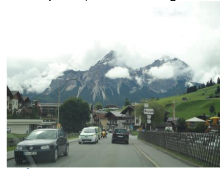
På vej mod Garmish-Partenkirchen

kirchen, men da der var lavtliggende skyer over bjergene, gjorde vi ingen ophold, men fortsatte mod München, hvor vi ankom til campingpladsen Thalkirchen, kl. 12.05. Vi fik os tilmeldt, og skulle bare finde en plads. Vi kørte ned langs Isar flodarmen og fandt en plads, der var lang nok til at campingvognen kunne stå med forenden ned mod floden. Pladserne er ikke særlig brede, så vi kunne kun lige have plads til bilen ved siden af os. Efter vi havde stillet op, fik vi den obligatoriske rejsegilde øl. Vejret blev bedre om eftermiddagen, og solen kom igennem skydækket, så vi besluttede os for at gå en tur i parken, som ligger langs floden og flodarmene på østsiden af campingpladsen. Her ligger i øvrigt også en golfbane. Da vi kom tilbage efter gåturen, satte vi os udenfor, hvor vi fik en "skraber" på en times tid i det dejlige solskin. Temperaturen var 17 °C, da vi ved 17 tiden trak indenfor, da skyerne begyndte at trække sammen, men heldigvis uden regn. Her på campingpladsen er der ingen Wi-Fi, så vi fik heldigvis hentet os en ny bog inden vi tog fra Prutz, og den vil vi hygge os med efter aftensmaden.