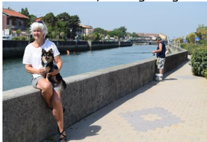
I Casal Borsetti

Vi vågnede op kl. 08.30 med 19 °C til en slappe af dag, hvor vi ville se lidt på nærområdet, og efter morgenmad var vi kl. 10.15 klar til, at gå ud at se på byen som campingpladsen ligger i udkanten af. Temperaturen var efterhånden steget til 23 °C, da vi gik ud af campingpladsen og drejede til højre ind mod byen, Casal Borsetti, som ligger helt ud til Adriaterhavet med Canale in