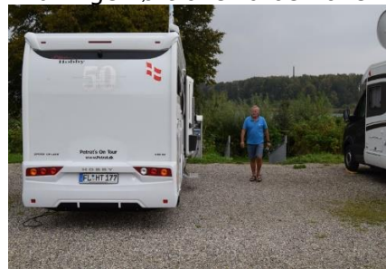
Petrat's On Tour på Stellplatz Kappeln

køre over på B203 med kurs mod Kappeln. Kl. 13.50 fandt vi en lille rasteplads, hvor vi holdt ind og spiste en let frokost, inden vi kørte det sidste stykke til Kappeln. Kun lige kørt over broen over Slien, drejede vi til højre langs havnen, og fulgte den frem til Lystbådehavnen, hvor de havde indrettet en Stellplatz på et fladt grusareal lidt udenfor lystbådehavnen. Her kunne vi kl. 14.30 køre camperen op på kiler under forhjulene, så vi holdt vandret. Da vi havde stillet op, gik jeg tilbage til indkørslen til lystbådehavnen areal og fandt automaten, hvor jeg betalte € 12 for at overnatte på arealet (Excl. Strøm). Da vi valgte ikke at betale for strømmen, satte vi køleskabet til at køre på gas, og da vi ikke har el-apparater, som vi absolut skal bruge, er det fint! Sene-re gik vi en tur ind langs havnen og et lille smut op i Kappeln. Tilbage ved camperen hyggede vi os indtil spisetid. Og da det var gået så godt med hyggen, så fortsatte vi efter aftensmaden og lige indtil, vi gik i seng.