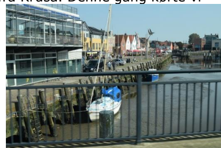
Lavvande i Husum Bådene ligger på bunden

Vi kørte ud til B200, som også er den vej vi kører ind i Tyskland fra Kruså. Denne gang kørte vi mod syd, og fortsatte på B200 helt frem til Husum. Fremme ved Husum ville GPS'en have os til at køre mod Brunsbüttel ad hurtigste vej, nemlig B5, men vi havde andre planer. Først kørte vi et smut ind i Husum og ned forbi havnen, hvor vi kunne se, at der var lavvande, så de små både lå på bunden af havnen. Vi gjorde et lille stop, så vi kunne få GPS'en stillet ind, så ruten til Brunsbüttel gik ud over marsken og hen over Eider Sperrwerk. Vi kørte på de små smalle asfaltveje ud gennem marsken, og havde en rigtig flot tur, hvor vi kunne nyde landskabet og de mange får og køer, der græssede på marsken. Vi kørte forbi vejen ind til Nordseecamping Zum Seehund, hvor vi