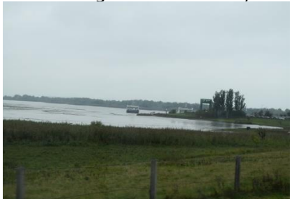
Færgen til Wischhafen