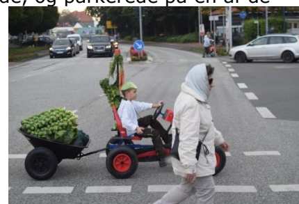
Dreng fra optog

fik vi vasket hænder, inde vi var klar til at fortsætte turen. Vi kørte igennem et stort område med vindmøller overalt hvor vi så hen. Vi kørte igennem Marne, som var en lidt større by, og her var der marked i gaderne. Vi så bl.a. en dreng som nok havde været med i et optog, for han havde en sæbekassebil med mas-