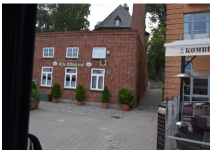
På havnen i Kappeln