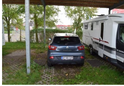
Klar til at bytte bil