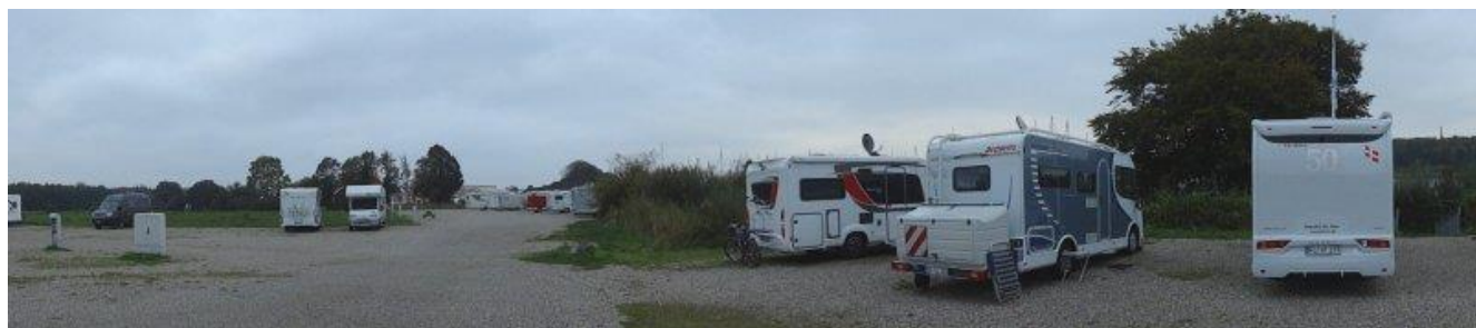
Stellplatz Norderhafen Kappeln