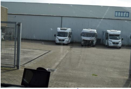
Trist syn på IMC

garagen. Atter var Petrat´s On Tour hjemme. 🐾