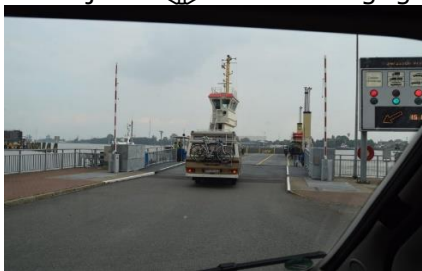
Ind på færgen over Kielerkanalen

ser af grønsager, hvidkål, rødkål, rosenkål, porrer mm, og på hovedet havde han et hvidkålsblad som hjelm. ☹️ Nu var vi rigtig kommet ud i Gemüsemarsken, og kunne se grønsager på markerne