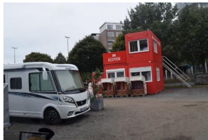
Wohnmobilhafen - Hamburg