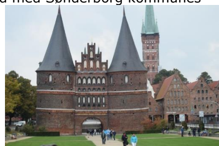
Holstein Tor i Lübeck

denheder. Vi satte nu kursen ad B207 mod Schwarzenbeck, og i Kröppelshagen fik camperen slukket sin tørst. Vi fortsatte til Mölln, hvor vi drejede ind gennem byen. Mölln var venskabsby med Sønderborg i 70-erne, og jeg havde været der for at spille fodbold med Sønderborg kommunes hold. (Vi vandt!) Jeg kunne nu ikke genkende noget, men det var måske også fordi, vi den gang var med til stor fest og fik et par fadøl. ☺ Mölln var en fin gammel hyggelig by, og vi fortsatte ad B207 frem til Lübeck, hvor vi kørte forbi Autocamperpladsen på Lastadie. Der var ingen faciliteter på pladsen, så vi fortsatte til Wohnmobil Treff Lübeck, hvor vi for € 11 (€1 mere end på Lastadie) har det, vi forventer af en Stellplatz. Vi kørte ind på pladsen kl. 14.15, og fik os koblet på strøm, og nød det gode vejr, hvor solen kom frem. Vi fik stolene frem og kunne