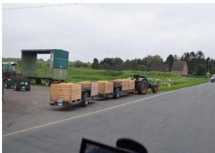
Æblehøsten køres hjem

byer, lå som en perlerække, med ca. 1 kilometer til næste by. Det var som at køre midt gennem en frugtplantage, med frugttræer helt ud til den lille vej, vi fulgte langs Elben. I byen Hollern var mange flotte bindingsværkshuse, og teglstenshuse, med flot udsmykkede gavle. Vi fortsatte langs "Haupt Deich, og pludselig var vi fremme ved Hamborg Containerhavn, hvor vi blev ledt ad en kringlet rute op over Köhlbrandbrücke og frem til Wohnmobilhafen, Grüner Deich 8. Vi ankom kl. 13.35 og fik betalt € 19, for at overnatte. Udsigten var ikke noget at råbe hurra for, men til gengæld, var her både strøm, bad og toilet. Efter vi havde spist