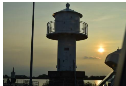
Stemningsbilleder fra Stellplatz "An der Nordermole, Glückstadt"