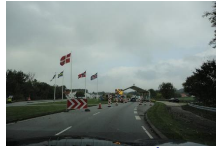
Grænsen i Kruså