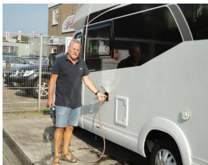
Jeg hælder vand på tanken

Vi stod op kl. 08.30 og fik lidt morgenmad, inden vi fik pakket det ud i bilen, som vi skulle have med. Klokken 10.00 var vi klar og kunne køre fra Nordborg i 15 °C med kurs mod Flensburg, hvor vi kunne låse os ind på IMC kl. 10.55, og køre ind til Camperen, der stod i carport nr. 49. Der var sat markise på, og vi skulle lige se den an, inden vi pakkede tingene fra bilen over i Camperen. Da vi var klar, fik vi byttet bilen med Camperen, så bilen stod i carport 49, mens vi var på tur. Inden vi kørte ud af porten, skulle vi have vand på tanken, så vi kunne klare os undervejs. Klokken 11.35 kunne vi låse os ud af porten og køre af sted på vores lille tur Schleswig - Holstein rundt, ca. 1½ time efter vi var kørt hjem fra.