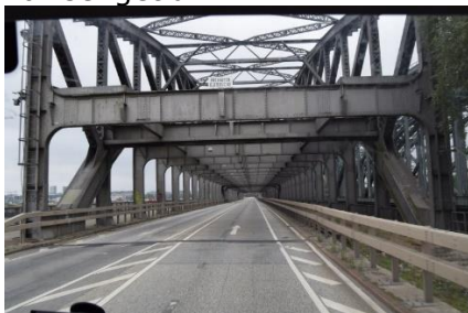
På vej gennem Hamborg havn