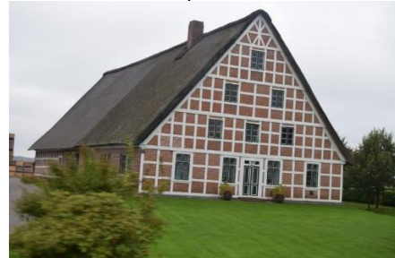
Flot hus i Obst-Marsken

Der var lang kø for at komme med færgen syd fra, og i køen var en del VW ældre "rugbrød", som var stadset godt op og nok skulle til et træf. Selv om det var valgdag i Tyskland, så var det ikke noget vi mærkede til, bortset fra valgplakater i byerne. Plakaterne var slet ikke i samme mængde som i Danmark, når vi har valg, og de var sat op, så de ikke skæmmede byerne, vi kørte igennem. 😊 Hvor vi i går kørte i "Gemüse-Marsken", så var det nu igennem "Obst-Marsken". Der var frugttræer overalt, stort set hele turen ind til Hamborg. De små