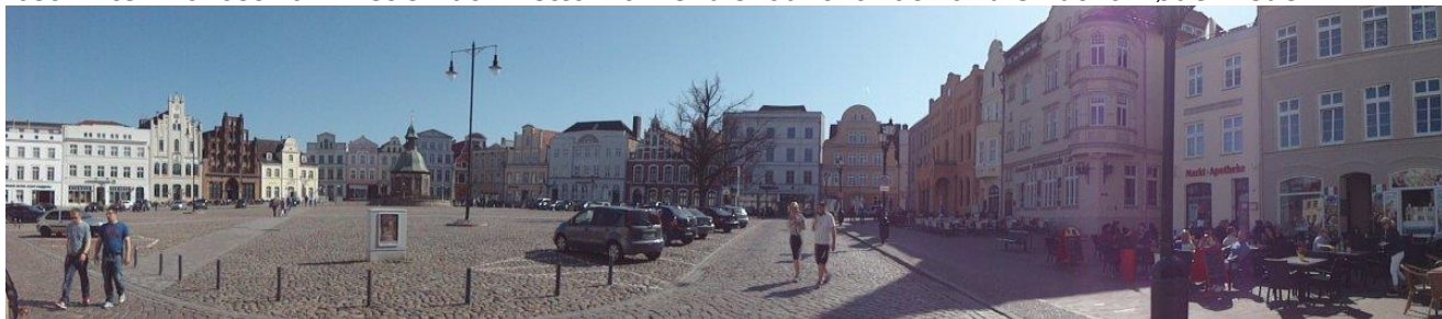
Markedspladsen i Wismar

Vi sov længere end vi plejer, for vi skulle først hente rundstykkerne kl. 09.00 i Røgeriet. Vi tog os også god tid til morgenmaden da, dagens etape kun var på 15 km til Wismar. Det var en flot strækning ad mindre veje, igennem et flot bølgende terræn. Fremme ved Wismar blev vi ledt ind gennem byen og frem til Wohnmobilpark Westhafen , hvor vi kørte en runde på pladsen og kunne se, at der ikke var mange ledige pladser. Vi valgte plads 21, som ligger ned til en lille kanal, så vi har et grønt areal foran Camperen, hvor vi kunne sætte vores stole 😊. Efter vi havde kørt Camperens forhjul op på klodser kunne vi tage stolene ud på det grønne areal og nyde de solstrejf som kom gennem skyerne. Senere delte vi en Hasseröder Schwarzbier og fik lidt røget fisk til frokost. Efter frokost var vi et smut i Netto Markendiskount for at handle lidt fornødenheder.