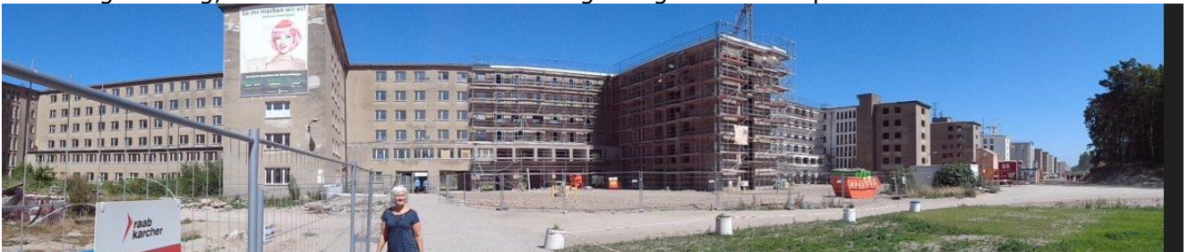
Ombygning af Kdf-Bad Prora er i fuld gang