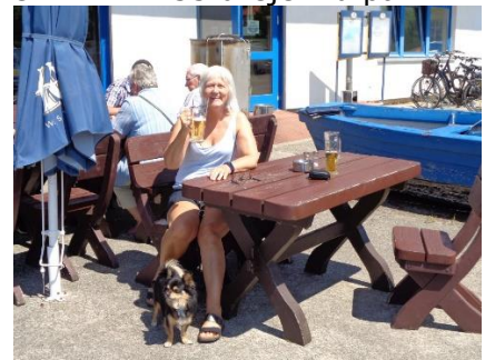
I nydningen ved Poeler Forellenhof