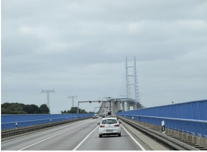
Broen over Strealasund

Efter velkomst øllen gik vi ind til Stralsund Altstadt, mens solen begyndte at få magt, og inden vi nåede tilbage til Camperen, var skyerne helt væk. Vi var rundt i Altstadt og nød synet af de forskellige seværdigheder, det dejlige solskin og stemningen. 😊