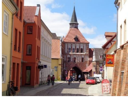
Et par motiver fra Stralsund Altstadt