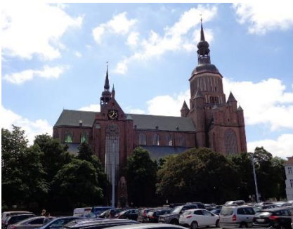
Domkirken i Stralsund