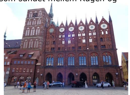
Brudepar foran Rådhuset

fastlandet hedder, blev vi ledt ud på A20, som er under udbygning til motortrafikvej. Lige nu er det en meget smal og trafikeret Bundesstrasse, det første lange stykke over Rügen og kun det sidste stykke mod Stralsund er det motortrafikvej i det, der i fagsprog hedder 2 + 1 vej (Skiftevis overhaling). Ikke nok med det første stykke er smalt og med mange lyskurver, så er der jo også vejarbejder på stykket ☹️, så vi sneglede frem med max 30 km/h. Vi nød det, da vi var kommet over " Neue Rügenbrücke " og skulle dreje af ved første afkørsel. Efter få hundrede meter var vi fremme ved Caravanstellplatz "An der Rügenbrücke" og kunne, kl. 11.15 trække en billet og køre ind for at finde en plads.