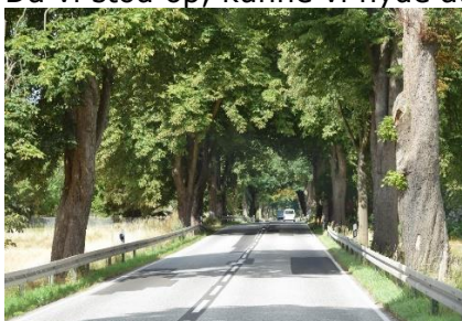
Ad små hyggelige veje