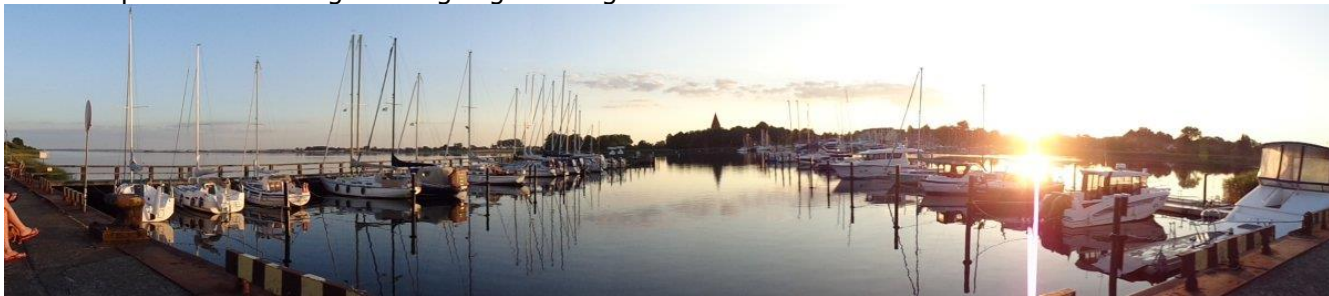
Solnedgang ved Poeler Forellenhof

Efter vi havde fået et velfortjent brusebad og skyllet støvet af og sveden fra solskinnet hyggede vi os i Camperen indtil vi "godt stegte gik i seng".