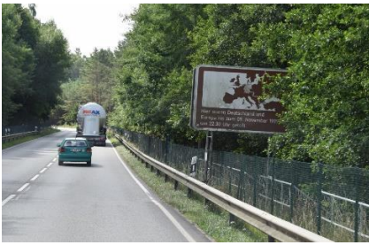
Vi kører ind i Mecklenburg-Vorpommern

"strøm" idet der var solfangere på større arealer. Da der manglede 100 km inden vi var fremme ved målet, var Autobahnen spærret, og vi måtte igennem ca. 8 km omkørsel ad små veje ☹️. Hastigheden var kun 30 km/h indtil vi igen kunne komme ud på Autobahnen, og sætte farten op til vores marchhastighed på 90 km/h. Senere delte Autobahnen sig, og vi tog grenen mod Stralsund, hvor vi kørte over en flot bro, og så var vi på Rügen . Vi havde stadig ca. 40 km, inden vi var fremme ved Binz, hvor vi, efter at have kørt på smalle veje, let fandt frem til kdf-Bad i Pro-