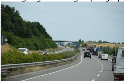
On the Road again ☺