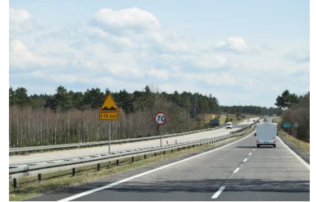
71 km ujævn vej i Polen

Jo længere væk vi kom fra Berlin, jo kedeligere blev landskabet. Flade marker og store kedelige skovarealer kørte vi igennem, men vejret var flot med klar sol og kl. 10.50 kunne vi måle 18 °C. Kl. 11.45 kørte vi over den Polske grænse, og drejede ind for at veksle til Zloty. Inden vi fandt vekselkontoret (Kantor), fik vi fyldt camperne med diesel. Inde på Kantor fik vi hver vekslet € 200 til 832 Zloty. Vi fandt ud til den 4 sporede hovedvej A4, som også er Europavej E36. Det var dog den værste vej, jeg nogensinde har kørt på. 🙄 Vi mødte det første skilt med ujævn vej (15 km). Når de i Polen skriver ujævn vej, så mener de ujævn vej. (Godt vi ikke havde forlorne tænder, for så var de faldet ud – Vi må vist bede tandlægen om, at se om vores plomber er løse, når vi kommer hjem) Efter de 15 km kom vi til vejarbejde, hvor vi blev ledt over i modsatte spor, men kun et par hundrede meter, og så stod der igen et skilt om ujævn vej (17,5 km) og sådan blev det ved. Vi nåede at køre 71 km fra vi tankede, indtil vi kom på almindelig belægning, som straks blev til Motorvej. Hvilken lettelse! 🙌