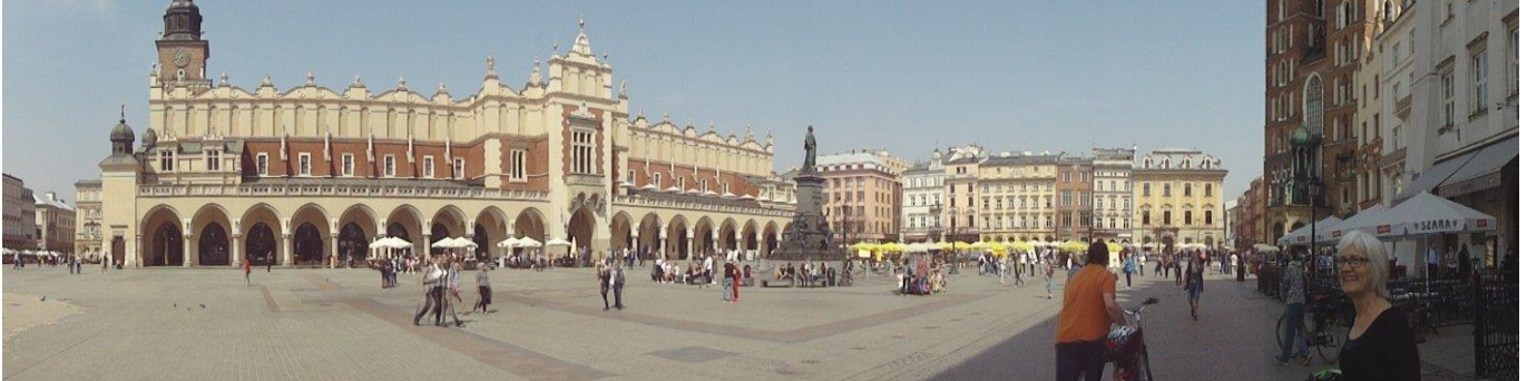
Rynek Główny (Det store torv i Krakow)

Nu var det blevet godt middag, så vi besluttede os for at finde et sted, hvor vi kunne få lidt at spise. Vi fandt en fin lille restaurant med Italiensk inspireret mad. Tidspunktet var velvalgt, for da vi fik vores mad begyndte det at styrtregne og tordne. Da det stadig regnede, da vi var færdig med maden, så var vi nødt til at få tre kopper cappuccino og en øl. Da jeg var færdig med øllen, var det så småt holdt op med at regne, så vi valgte at køre hjemad. Vi fulgte floden Wisla igennem Krakow, mens det småregnede. Da vi kom udenfor byen holdt det op med at småregne, og vi kunne køre hjem ad mod campingpladsen i tørvej.