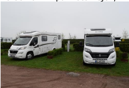
Stellplatz ved Schaffer-Mobil

Det var fint tørvejr og 11 °C, da vi stod op kl. 07.20. Solen lå og ventede bag skyerne, men kunne ikke få løftet dynen. Efter morgenmaden fik vi gjort klar til den videre færd, og kl. 09.15 kunne vi i 14 °C køre den lette vej ud af bagporten, og hurtigt var vi ude i den tætte trafik i Prag. Heldigvis skulle vi ud af byen, og efterhånden som vi nærmede os motorvejen, tyndede det ud med biler. Kl. 10.00 kom vi på motorvejen, hvor solen tittede ned til os og det var blevet 16 °C.