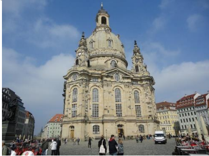
Domkirken i dresden

ud over Elben og de mange turskibe, der lå ved kajen, satte vi os på Kutscherschänke for at nyde en forfriskning i det dejlige solskin. Efter forfriskningen kørte vi over på den anden side af Elben, og fulgte Elb Radweg et stykke i modsat retning som Stellpladsen. Efter vi havde set Dresden fra den side, vendte vi cyklerne og kørte mod Stellpladsen. Vi havde set, at der lå nogle restauranter ud mod Elb Radweg, og da vi kom frem til " Zum Landstreicher ", parkerede vi cyklerne og fik dejlig aftensmad. Godt mætte efter maden, kunne vi igen sætte os på cyklerne, og finde tilbage til vores camper, hvor vi nød resten af aftenen.