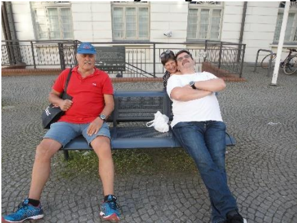
Afslapning i Wismar