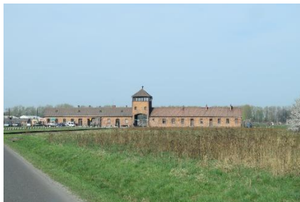
KZ lejr Auschwitz II - Birkenau