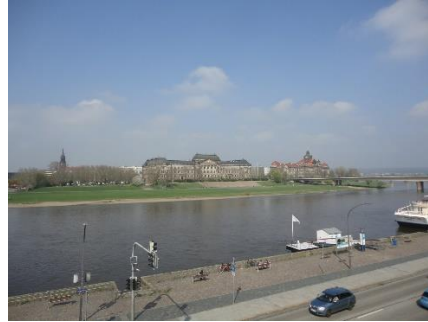
Udsigt fra Brühlische Terrasse