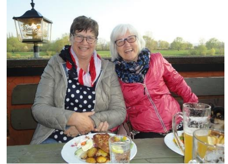
Aftensmad ved Elben