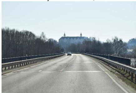
Slottet i Plön