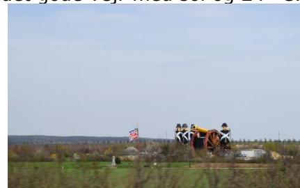
Udsmykning ved Colas asfaltværk