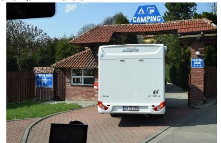
Indkørsel til Camping SMOK