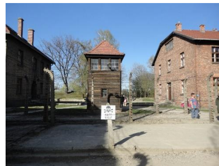
I Auschwitz I

Da vi var blevet mætte af dagens indtryk, gik vi tilbage til camperne, hvor vi satte os og nød det dejlige vejr med en lille forfriskning. Senere gik vi hver til sit for at spise, og hygge os til sengetid.