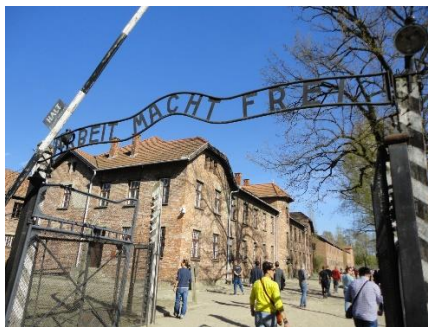
Indgang til Auschwitz I