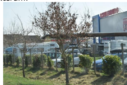
Indkik til IMC og vores Kadjar

Km: 10.851 – Dagens Etape: 229 km – Turens længde i alt: 2.526 km.