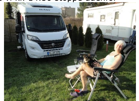
Afslapning i Wrocław