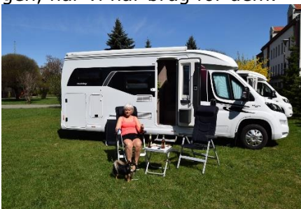
Afslapning inden besøg i Auschwitz