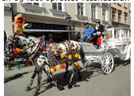
Hestevogn i Krakow

Efter at have oset lidt, kørte vi ned og gik igennem den jødiske bydel, hvor der havde været Ghetto under 2. verdenskrig. For at få "hele historien med", fortsatte vi cykelturen ud til Oskar Schindlers fabrik , hvor jøderne fra Ghettoen havde arbejdet. Har I aldrig set filmen " Schindlers Liste ", så burde I gøre det, så får I historien om Krakows jøder under krigen.