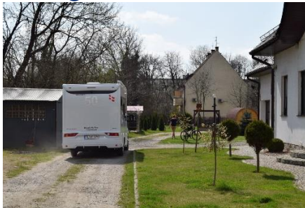
"Campingmutter" viser plads

Jo længere væk vi kom fra Berlin, jo kedeligere blev landskabet. Flade marker og store kedelige skovarealer kørte vi igennem, men vejret var flot med klar sol og kl. 10.50 kunne vi måle 18 °C. Kl. 11.45 kørte vi over den Polske grænse, og drejede ind for at veksle til Zloty. Inden vi fandt vekselkontoret (Kantor), fik vi fyldt camperne med diesel. Inde på Kantor fik vi hver vekslet € 200 til 832 Zloty. Vi fandt ud til den 4 sporede hovedvej A4, som også er Europavej E36. Det var dog den værste vej, jeg nogensinde har kørt på. 🙄 Vi mødte det første skilt med ujævn vej (15 km). Når de i Polen skriver ujævn vej, så mener de ujævn vej. (Godt vi ikke havde forlorne tænder, for så var de faldet ud – Vi må vist bede tandlægen om, at se om vores plomber er løse, når vi kommer hjem) Efter de 15 km kom vi til vejarbejde, hvor vi blev ledt over i modsatte spor, men kun et par hundrede meter, og så stod der igen et skilt om ujævn vej (17,5 km) og sådan blev det ved. Vi nåede at køre 71 km fra vi tankede, indtil vi kom på almindelig belægning, som straks blev til Motorvej. Hvilken lettelse! 🙌