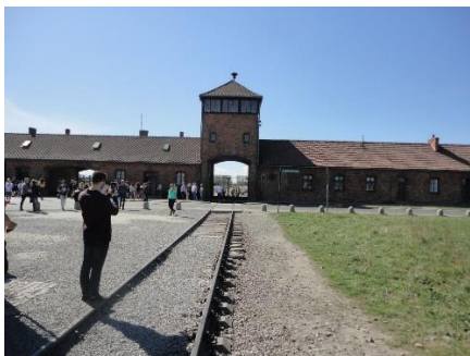
Indgang til KL Auschwitz II-Birkenau