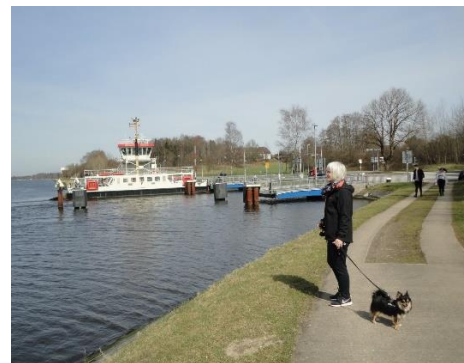
Færgen ved Nubis Krug

Ved Schleswig-Jagel fik vi tanket helt op med diesel, men inden vi var klar til den videre fart, skulle jeg have sat GPS'en op og indstillet på Stellpladsen i Osterrönfeld ved Rendsburg. Efter vi var kørt gennem tunnelen under Kielerkanalen, drejede vi af, og hurtigt var vi fremme ved Stellpladsen, men da vi ville trække en "billet", gav "maskinen" besked om, at alt var optaget. Nå skidt, så måtte vi sætte kursen mod Stellpladsen ved Schacht-Audorf , hvor vi har været før, og her var der stadig flere ledige pladser i anden række, så kl. 12.40 fik vi parkeret i 15 °C og flot solskin. 😊