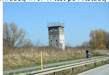
Minder om den Tyske deling 1945-1989