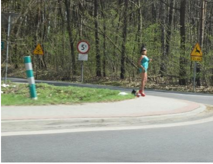
Rødhætte venter på bedstemor ☺

var de mange boligblokke, som var med mange flotte farver. Også vejret var en oplevelse, kl. 11.00 var det 21 °C, og solen skinnede fra en skyfri himmel. I Brzeg kørte vi forbi 2 kirkegårde, hvor alle gravene var et blomsterhav i mange forskellige farver – fantastisk flot.