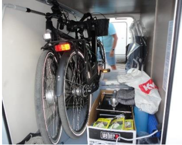
Der gøres klar til afgang fra Berlin