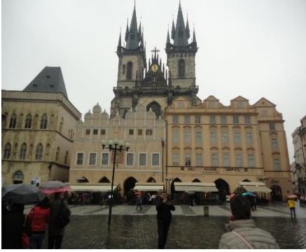
Teyn-Kirken (Thycho Brahe) ved Staromestske Namesti

Da receptionen er middagslukket fra kl. 11.00 til 16.00, fik vi travlt, og fik købt sporvognsbilletterne, så kunne gå ud og tage sporvognen kl. 11.00. Vi stod af ved Karlsbroen, men da det regnede, gik vi gennem butiksarkaden, og ventede lidt på tørvejret, der ikke ville komme. Vi kiggede ud over Karls-