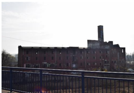
I Øst ses fortiden stadig

syn. Snart drejede vi ind på A24 og senere A10 mod Berlin. Her kom vi forbi mange marker, hvor der var opsat vindmøller og solfangere, eller man var ved at opsætte nye solfangere. Det er måske den nye afgrøde i Brandenburg? Langs A10 på over 50 km havde de, eller var i gang med at fælde træer i en bredde på 50 m fra motorvejen. Sikken et arbejde!