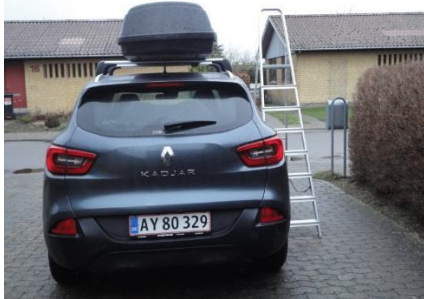
Så er skikassen sat på