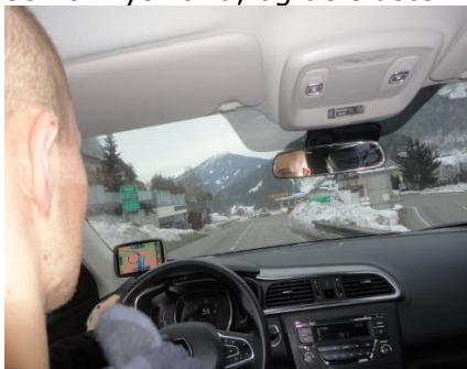
Vi ankommer til Ischgl