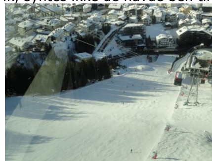
Pisten ned mod Elisabeth