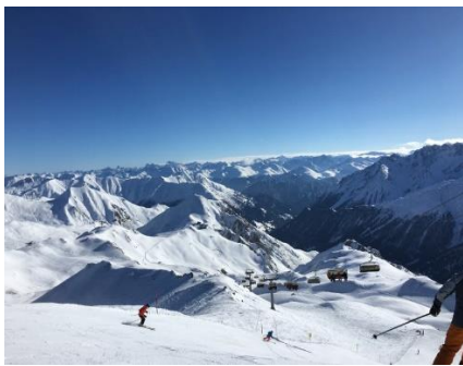
Vue over bjergene

På vej mod Fernpass og Tunnellen ved Füssen, var der flere gange meget tæt trafik, dog ikke "Stau". Til gengæld kunne vi se, at trafikken i modsat retning mange gange gik helt i stå. Efter vi var kommet ud af tunnelen og var i Tyskland, kunne vi se, at der var "Blok Abfertigung", hvor bilerne i modsat retning, holdt i kø ved rødt lys på motorvejen. Pyha, godt det ikke er os tænkte vi, mens vi satte farten op til 120 km/h. Vi skulle dog ikke glæde os for tidligt, for ved både Kempten og Memmingen sagde GPS'en at der var kø og 18 - 21 minutters forsinkelse. Heldigvis forslog GPS'en omkørsel, som vi fulgte, og sparede noget af tiden.