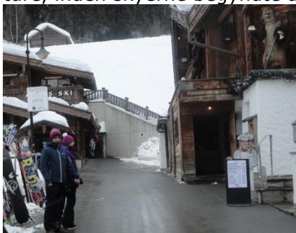
Udenfor Trofana Alm