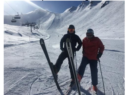
Klar til skiløb