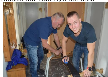
Skiene gøres klar

Torsdag, skal jeg have sat bagagestængerne på, så jeg kan sætte skikassen på om fredagen, inden vi pakker bagagen ud i bilen, og kører af sted.