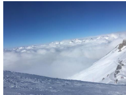
Skyerne som en blød dyne over dalen