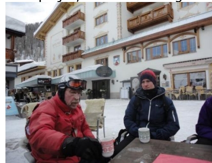
Chokoladen nydes i Samnaun