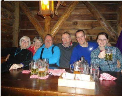
Til Afterski 🙄