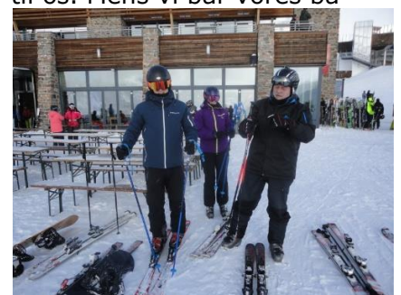
Vi er klar til at stå på ski 🎿