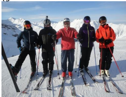
Holdet uden fotografen der mangler

Efter en god nats søn, stod vi op kl. 07.30 og fik morgenmad. Nogen fik Græsk Yoghurt med Müesli, andre Havregryn / Cornflakes med mælk og en kop kaffe til dem der havde lyst. Efter morgenmaden fik vi skitøjet på og kunne gå de ca. 500 m op til Skidepotet under Pardatschgrat-liften (gennem tunnelen under husene). Efter vi havde fået skitøjet på, og fyldt mine skistave op med