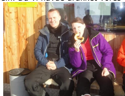
Pause ved Bistro Gampen

Fakta Box 📦: Skiløb: 22,1 km Højdemeter: 4.964 m. Temperatur: -17 °C til -8 °C