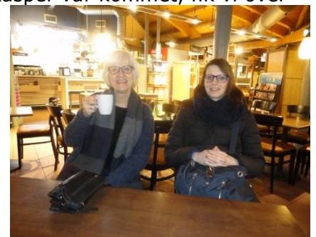
Der drikkes kaffe undervejs