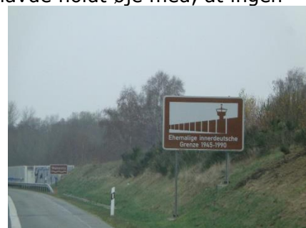
Markering af den gamle grænse

Wohnmobilpark Westhafen, Wismar, N 53 53 40 - Ø 11 27 06