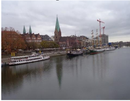
Skibe i havnen på Weser

Da vi gerne ville tidligt til Bremen, valgte vi at tage Autobahnen. Først skulle vi igennem Lüneburg, hvor folk var på vej til arbejde, men det gik let, og snart var vi på Autobahnen med kurs mod Hamburg. Ca. 20 km før Hamburg drejede vi over på A1, som vi fulgte frem til Bremen. For at nå frem til Stellpladsen skulle vi gennem Miljøzone, men da vi kører i en Camper med Euro6 motor, er det ingen problem. Vi blev lidt overraskede over, hvor få Campere der holdt på den store Stellplads. Der var slet ikke samme belægning som i Hamburg og Lüneburg, så vi kunne vælge lige den plads, vi havde lyst til, og kunne hygge os i Camperen indtil vi ville gå ind til Julemarkedet i Bremen Altstadt 🇩🇪.