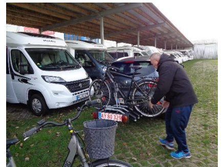
Cykler tages med hjem for vinteren

Det blev en dejlig tur, hvor vi flere gange så rådyr, en stor rov-fugl over os (nok en ørn). Efter vi kørte forbi Schleswig var man, over mindst en kilometer i gang med at stille solceller op. Så var det jeg tænkte, er det miljømæssigt en god ide 🤔 🌞?? Det var et flot landskab, og det ødelægges af "grimme solceller i miljøets navn" 🙄. Jeg synes, at man selv langs Autobahnen bør have gode oplevelser, og lad dem nu ikke ødelægge det i miljøets navn 🙄 🙄!