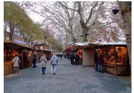
Julemarked ved Søroverne

Vi hyggede os fantastisk, mens vi gik flere gange rundt på markedspladsen og rundt om de gamle bygninger. Efter rundturen gik vi tilbage til den del af julemarkedet, som lå langs floden, og fik os en "Schnitzel mit Kloblauchsoße im Brot". På markedspladsen var der traditionelt julemarked med "Glühwein, søde sager og Bratwurst". Vi syntes det var hyggeligt og mere "luft", at gå gennem markedsdelen langs floden. Efter vi havde fået lidt godt at spise og drikke gik vi tilbage til Camperen hvor vi hyggede os, efter besøget på det, vi syntes, "var det flotteste / bedste Weihnachtsmarkt vi nogensinde har besøgt". 😊 🇩🇪