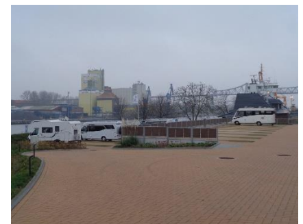
Camperpladsen i Osterrönfeld

Da vi ikke havde travlt, besluttede vi os for, at tage resten af dagens etape uden at køre på motorvej, så ved Schleswig drejede vi af, for at køre på Bundesstrasse ned mod Rendsburg. Vi havde en dejlig tur frem til Rendsburg, hvor vi lige skulle igennem et større vejarbejde ved tunnelen under Nord Ostsee Kanalen. Det ene tunnelrør er lukket for en større reparation, og trafikken skulle køre begge veje i det østlige tunnelrør. Trafikken gled stille og roligt, og ved første afkørsel efter tunnelen, drejede vi mod Osterrönfeld, og fandt let frem til Stellpladsen, hvor vi trak en billet og blev lukket igennem bommen. På Pladsen holdt kun 3 campere (10 %), da vi kom. Vi tog en af pladserne på nederste niveau, hvor man holder helt op til Nord Ostsee Kanalen (NOK), kun med en sti mellem os og kanalen 😊.