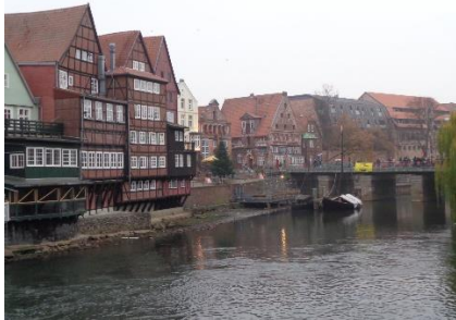
Hyggelige huse i Lüneburg

Vi havde kun en kort køretur til næste mål, så vi gav os god tid. Der var mange andre campere, som allerede var kørt, da vi satte kursen mod Lüneburg. Vi havde valgt, at vi ikke ville køre på motorvej, så vi blev ledt ud af Hamburg på nordsiden af Elben, og først efter godt 25 km, var det tid til at krydse Elben ved Geesthacht og køre ad B404 mod syd, gennem det flade landskab 😊. Fremme ved Lüneburg, blev vi ledt vest om byen og frem til Stellpladsen på Sülzwiesen, hvor vi fik parkeret Camperen, kun 3 minutters gang fra Altstadt ☺️. Midt på eftermiddagen gik vi ind til Altstadt, hvor vi nød at gå i de smalle gader med de flotte gamle huse. Butikkerne var lukket, da det jo var søndag, men vi fandt et hyggeligt lille julemarked i en smøge, hvor vi kunne varme os på et dejligt glas Glühwein mit Schuss ☺️.