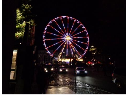
Indtryk fra Julemarkedet i Lübeck