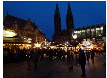
Indtryk fra Julemarkedet i Bremen