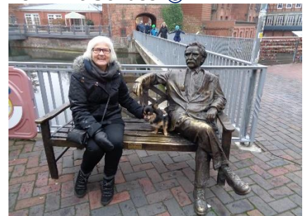
Hvil på bænken med Mark Twain

Efter at have varmet fingrene på glasset, fortsatte vi vandringen gennem den flotte by, op til Rathaus Markt, hvor der var gjort klar til julemarked, men da "Kirkeåret" først slutter i dag søndag, kunne man ikke få tilladelse til at åbne før mandag. (Det er også gældende for de andre byers julemarkeder ☹️). Efter et smut nede ved floden gik vi tilbage mod Camperpladsen. Her kom vi forbi et andet mindre julemarked i en større smøge, hvor vi ikke kunne stå for den dejlige duft af Grillbratwurst 😊. Efter vi havde spist hhv. Grillbratwurst og Krakauer grillwurst, fortsatte vi tilbage til Camperen, hvor vi hyggede os resten af dagen.