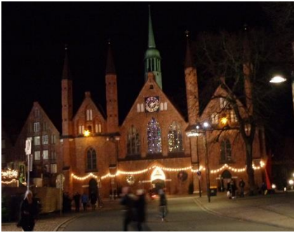
Oplyste gamle huse

under rådhuset på Markt Lübeck, og gik gennem julemarkedet. Det var lidt mere "sammenklemmt" end i Bremen. Vi fortsatte gennem "Historischer Weinachtsmarkt", inden vi, efter en "Glühwein und Knacker mit Brot", gik hjemad mod camperen, hvor vi hyggede resten af dagen med at læse lidt. 📖