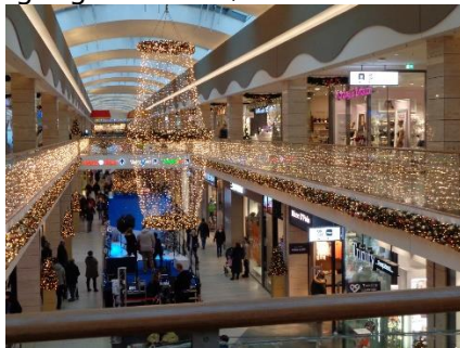
Det julepyntede indkøbscenter