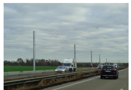
Master til hvad?

Det var mørkt, da vi stod op. At det var mørkt, var måske fordi camperpladsen lå skønt under nogle træer. At det var koldt, var nok fordi vi stod op en time tidligere op, end de andre steder, da vi skulle ud på turens længste tur, nemlig til Lübeck. Vi kørte ind gennem Bremen, som er "Miljøzone", men vi kører med "Euro6 motor" og har grønt Miljømærke, så uden problemer kunne vi køre ad hurtigste rute ud af Bremen og fortsætte på Autobahnen med kurs mod Lübeck. 😊