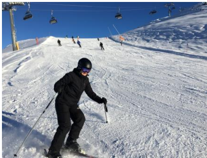
Skiløb i dejligt solskin ☺

Da vi stod op, kunne vi se, at solen skinnede på bjergtoppene ☺. Da vi kom op til liften, kunne vi se, at der var mange, der gerne ville tidligt op for at stå på ski. Selv om der var lidt kø, gik det hurtigt med at komme frem til gondolen, som tager 28 personer ad gangen. Da vi stod af liften, var der flot sol, men da vi kørte ned mod Idalp, var der stadig skygge fra bjergtoppene ned over pisten. Efter et par ture på vores "morgenbakke" var solen kommet op over bjergtoppene,