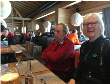
Middag på "Gampenalp"

Vejret var ikke helt med os i dag, vi kunne se, at der var slørskyer på himlen. Vi var oppe ved liften, lige da den åbnede kl. 08.30. Der var en lang kø, men det gik hurtigt med at komme ind i Gondolen. Efter en tur på "morgenbakken" tog vi over til Schweiz siden, for at køre i solen, der efterhånden fik sværere ved at skinne igennem skylaget. Vi besluttede os for at tage op over bjergkammen til Østrig siden og ned til den nye restaurant, "Gampenalp", hvor vi fik anvist et bord i den flotte restaurant. Her fik vi nogle rigtig gode, store Wienerschnitzler til frokost 😊.