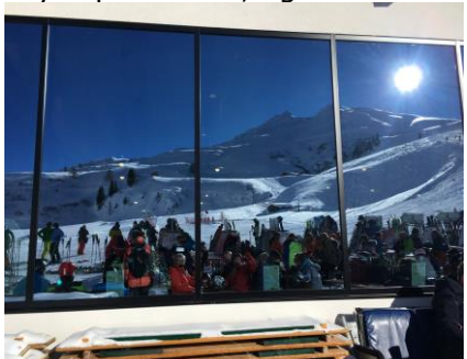
Panoramaet spejler sig i ruderne

Da vi stod op, kunne vi se, at dagen så ud til at blive en tro kopi af dagen i går. Der var ingen skyer på himlen, og da vi kom op i skiterrænet, var det til en dejlig skidag, hvor solen stod ned fra