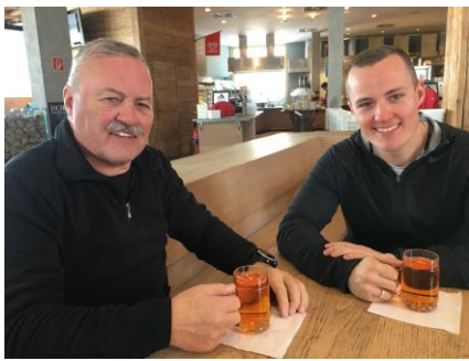
Tid til en Jagatee ☺