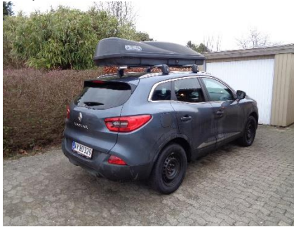
Så er skikassen sat på