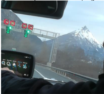
GPS stilles til hjemturen