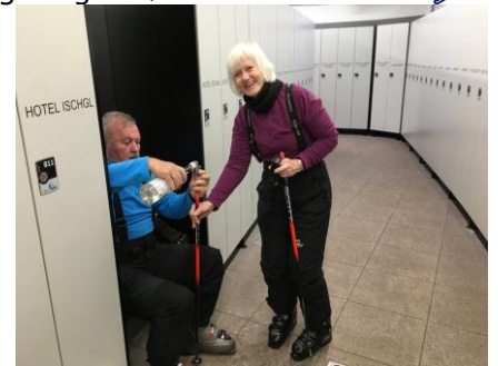
Så er skistavene tanket med Obstler 🇩🇪