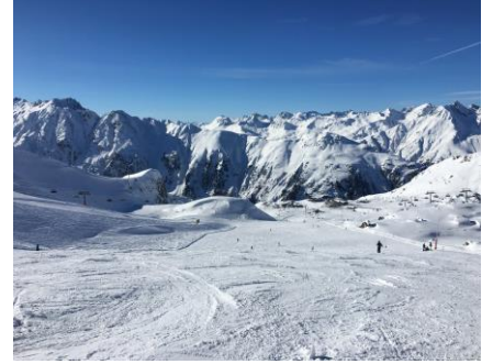
Kaiserwetter over Pisten