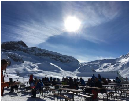
Solskin over bjergene