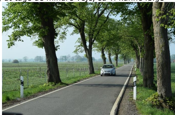
Ad smalle veje i det tidligere grænseland

Efter en stille og rolig nat, kunne vi efter morgenmaden, som den første Camper trille ud på vejen og sætte kursen mod syd. Vi havde besluttet os for, at tage de mindre veje, så vi kunne følge Elben mod sydøst, og frem til Magdeburg. På første stykke krydsede vi grænsen mellem Niedersachsen og Mecklenburg-Vorpommern (Vest og Øst) flere gange. Vi kunne tydeligt se, at der var stor forskel på vedligeholdelsen af husene og specielt i øst stod "gamle udrangerede / forfaldne landbrugsbygninger" fra tiden med de store kollektive landbrug. Efterhånden var vi helt inde i det "tidligere Østtyskland", hvor vi kørte gennem lange strækninger med skov. Nogen steder var der skilte i vejsiden, der fortalte, at det var livsfarligt, at gå ind i skoven, da der ikke var ryddet op for farlig ammunition. Da vi kørte igennem en landsby, kunne vi se, at der på en mindre gård, ud over køer, heste, grise og får også gik nogle langhårede lamaer i en indhegning. Lidt "sjovt."