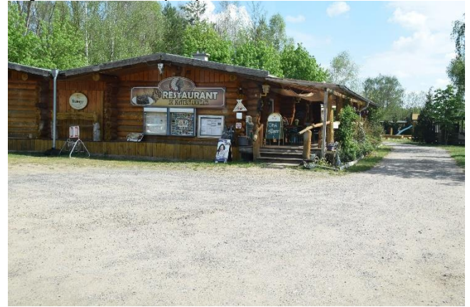
Receptionen ved Das Indianer und Tipi-Dorf

op. Vi måtte lige køre en runde og finde en anden vej frem til Camperpladsen " Am Winterhafen ". Her var fyldt godt op, og da vi syntes, det var noget simpelt, og uden orden, så besluttede vi os for, at finde en campingplads, som lå et stykke nord for Magdeburg. Vi satte kursen mod Das Indianer und Tipi-dorf , Bertingen. Det første stykke fra Magdeburg var på fin Bundesstrasse, senere ad landeveje og de sidste 5 km, ad betonvej, som var så ujævn, at det mindede os om vores tur til Polen. Heldigvis viste det sig, at vi kom frem til en hyggelig lille campingplads, hvor vi kunne holde på et dejligt engareal. Vi faldt pladask for receptionen og den lille restaurant i bjælkehuset, så vi var nødt til at gå derop til aftensmad, men desværre var der kommet flere udefra, så alt var optaget. Så i stedet nød vi en ostemad og et enkelt glas vin i Camperen.