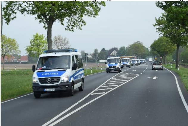
Politiet er undervejs