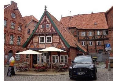
I Lauenburg Altstadt

indtil vi kom op til Rathaus og Fürstengarten. Vi var helt bange for, at vi ikke kunne komme ned igen, men vi fandt en stejl trappe med mange skæve/ujævne trin og kom ned til værftet igen. Det var samtidig med, at værftets fløjte lød for fyraften. Også her følte vi os, sat mange år tilbage. Snart var vi tilbage ved Camperen, hvor vi havde en lille opgave, inden det var tid til en velfortjent forfriskning. Vi skulle sætte Camperen navn "Haveje" på bagenden. Efter arbejdet var lavet, måtte vi gennem den officielle navngivning, med dåb, og skål i Rosevin. Bagefter sang vi Kim Larsens sang " Haveje ", som er skrevet af Jakob Haugaard. Nu har vi så en lille opgave, nemlig, at lave teksten om, så den passer til vores "Haveje". Efterhånden var det blevet tid til at finde på lidt til aftenmad, og lidt hygge resten af dagen.