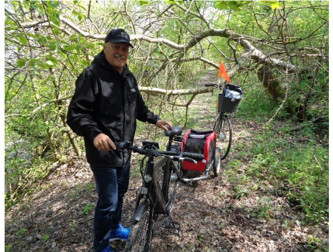
På stien mod Goslar

let frokost startede vi cyklerne, for at køre ind til Goslar . På min telefon, havde jeg sat Google-Maps til at finde en alternativ cykelvej, og det må vi sige, at den gjorde. Vi fulgte "den slagne vej" ned til Oker og gennem byen. Lige før jernbanen ville Google have os ad en alternativ rute langs jernbanen. Det første stykke var på asfaltvej, og da vejen endte "blindt", skulle vi følge en grussti, men efter kort tid var stien spærret. Så viste Google os en anden vej, og det viste sig, at være en trampesti, som fulgte banen og frem til en parkeringsplads til en fabrik. Det var noget af en oplevelse, da vi kørte igennem et vildnis, og måtte kravle under væltede træer, inden vi kom ud til den store vej, hvor vi kunne følge cykelstien ind til Goslar, hvor vi kørte gennem "Das Breite Tor", og ind på en af de smalle brostensbelagte gader. At den hed Breite Strasse, var vist et levn fra gammel tid, hvor der ikke var fortove og kun hestevogne. Nu var den i hvert fald ensrettet. Fremme ved midten af Altstadt kom vi til "Marktplatz Goslar", hvor der var opstillet en scene med musik, og boder som solgte alt som kunne fortæres. Vi var lidt skuffede, for heksene, der