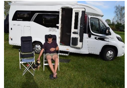
Stemningsbilleder fra Das Indianer und Tipi - Dorf