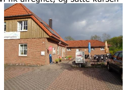
Camping am Waldbad i Neustadt

tog en af "Harald Nyborgs" en-gangs regn poncho på, og fik koblet en anden gasflaske på, så vi fik varme på. Efter morgenmad trillede vi op til receptionen, hvor vi fik afregnet, og satte kursen mod næste mål. Da vi kom ud fra Campingpladsen, valgte vi at køre en anden vej ud til den store vej mod Magdeburg. Vi ville hellere køre en mindre omvej, end på den ujævne betonvej. Vi fik set lidt andet, og slap for de store rystelser, inden vi nåede den store vej mod Magdeburg. Vi snakkede lidt om, det nu var klogt, at køre til næste overnatningssted, eller om vi ikke skulle køre til " Dora Mittelbau ", som vi ellers ville besøge i løbet af dagen. (Dora Mittelbau er hvor Hitler byggede sine V2 bombere, og som var et vigtigt mål, som de allierede og Russerne satte alt ind på at komme først til) Vi besluttede os for at køre til "Dora