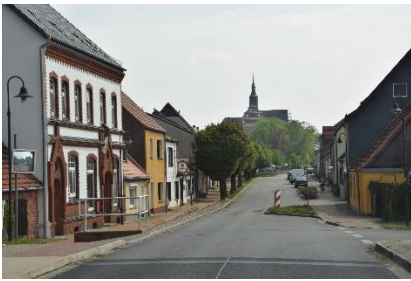
På vej mod Magdeburg