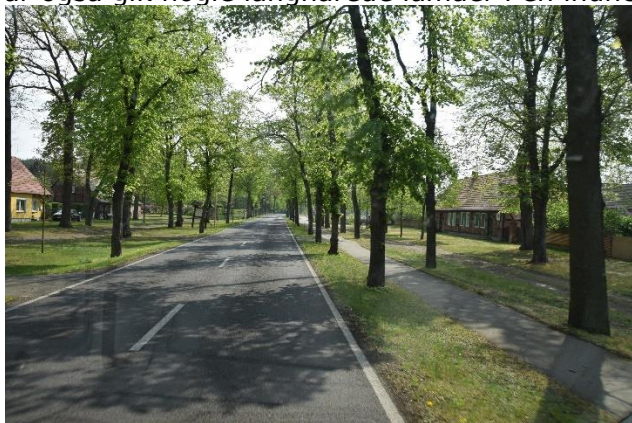
De typisk "østtyske landsbyer" ved Elben

Længere nede langs Elben, blev landsbyerne mere særprægede, idet husene lå 10 - 15 m fra vejen og arealet ind til husene var græsabat, hvor beboerne kunne parkere. De næste mange landsbyer, som lå med en afstand på ca. 2 km, var alle med græsabat foran. Jeg tror, det er et levn fra "Den kolde krig" eller måske Verdenskrigene, hvor der skulle være plads i landsbyerne til militærtransporter på langs af Elben, så man hurtigt kunne komme frem. Da vi senere kørte på endnu mindre veje, og kom til landsbyer, så var der brosten på vejen igennem byen. Ikke noget som Chico syntes om. Det gjorde vi heller ikke, for det rumlede og bumlede, men vi huskede vores tur til Polen sidste forår. Og ved siden af den, var dette småting. Efterhånden som vi nærmede os Magdeburg, blev vejene større og landet mere åbent. Snart kørte vi ind i Magdeburg, og blev snydt af GPS'en, eller var det af kommunen, der havde sat midlertidige skilte