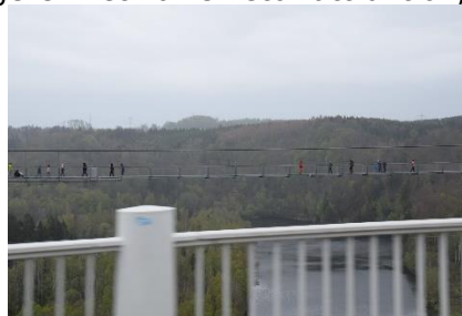
Hængebro ved Dæmning