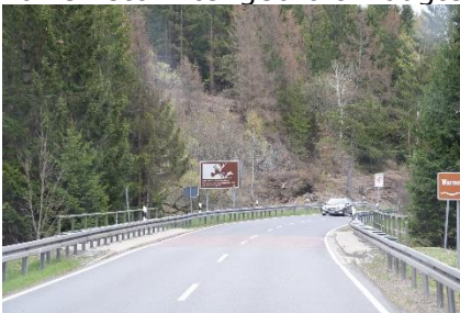
Zonegrænse krydses igen - igen

mødt af Hekse, som stod på gaden, hang i lygtepæle og i træer, og mindede os om Walpurgis. Kort efter Hohegeiß drejede vi mod Rappbodetalssperre , hvor der ved siden af den store dæmning var en stor hængebro til fodgængere. Det var en stor attraktion, for vi kunne se, at der var mange