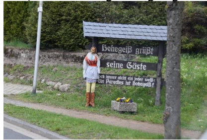
Hekse i Hohengeiß