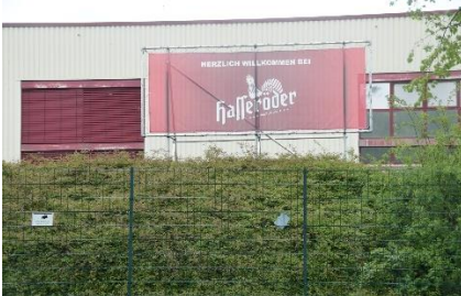
Hasseröder byder velkommen, men vi følte os ikke velkommen.

mennesker ude på broen. Vi var også kørt forbi mange gående fra parkeringspladserne, som gik langs vejen mod hængebroen. Da vi kørte over den høje dæmning, kunne vi se over til menneskerne, der gik parallelt med os ude på hængebroen. Der var godt nok langt ned. Senere kom vi til Rübeland, hvor der var mange mennesker på gaden, som ville besøge de mange huler i området. Vi fortsatte mod Wernigeode, hvor vi havde planlagt, at overnatte og besøge Hasseröder Bryggeriet . Men lige inden vi kom til Wernigeode, begyndte det at regne kraftigt, så vi blev enige om at springe en overnatning på en Parkeringsplads over, og i stedet køre til Harz Camping . Forinden var vi et smut forbi bryggeriet, men måtte opgive besøget, idet deres P-plads kun var til små personbiler, og ikke havde plads til en Camper på 7,5 m. Nå pyt, så må vi besøge Hasseröder Bryggeriet en anden gang, vi er i Harz, og vejret er godt. Vi