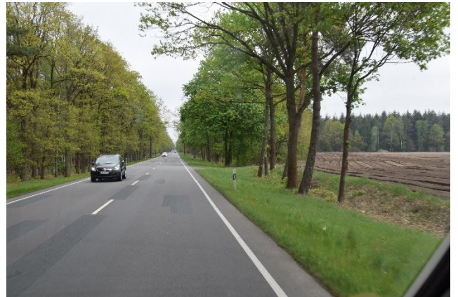
Undervejs over Lüneburger Heide