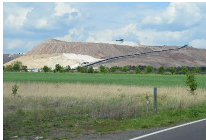
Lager ved Kali-værk