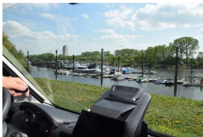
På Camperpladsen i Lauenburg