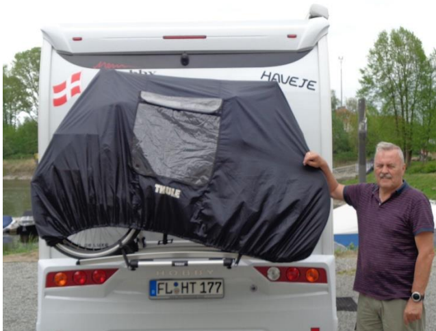
Så er der navn på "Haveje"

indtil vi kom op til Rathaus og Fürstengarten. Vi var helt bange for, at vi ikke kunne komme ned igen, men vi fandt en stejl trappe med mange skæve/ujævne trin og kom ned til værftet igen. Det var samtidig med, at værftets fløjte lød for fyraften. Også her følte vi os, sat mange år tilbage. Snart var vi tilbage ved Camperen, hvor vi havde en lille opgave, inden det var tid til en velfortjent forfriskning. Vi skulle sætte Camperen navn "Haveje" på bagenden. Efter arbejdet var lavet, måtte vi gennem den officielle navngivning, med dåb, og skål i Rosevin. Bagefter sang vi Kim Larsens sang " Haveje ", som er skrevet af Jakob Haugaard. Nu har vi så en lille opgave, nemlig, at lave teksten om, så den passer til vores "Haveje". Efterhånden var det blevet tid til at finde på lidt til aftenmad, og lidt hygge resten af dagen.