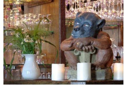
Trold i restauranten

Efter en forfriskning valgte vi at gå op gennem skoven til en borgruin , hvor vi efter den stejle opstigning nød borgruinen, men nok mest den dejlige fadøl, som vi fik i den hyggelige restaurant. Efter vi havde nydt udsynet ud over området, gik vi ned til campingpladsen, hvor vi fik et dejligt bad, inden vi nød det ved Camperen resten af dagen.