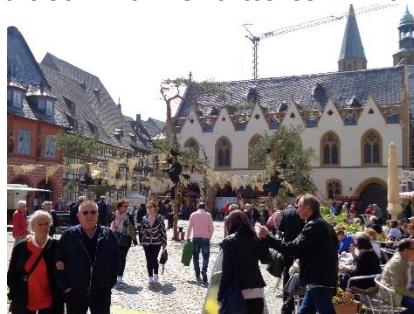
Indtryk fra Goslar