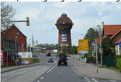
Undervejs mod Neustadt / Harz

Vi havde sovet godt, mens regnen havde trommet på taget, stort set hele natten. Vi vågnede tidligt ved, at det var lidt køligt i vognen – Gasflasken var løbet tør – Vi lagde os over på den anden side, for ingen gad gå ud i regnen for at skifte flaske. Vi sov alligevel til ved godt 7 tiden, hvor jeg