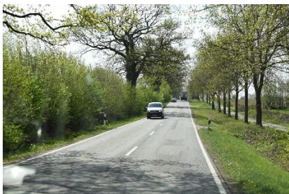
På vej mod Lauenburg