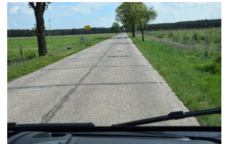
Den "Bumbede vej"

op. Vi måtte lige køre en runde og finde en anden vej frem til Camperpladsen " Am Winterhafen ". Her var fyldt godt op, og da vi syntes, det var noget simpelt, og uden orden, så besluttede vi os for, at finde en campingplads, som lå et stykke nord for Magdeburg. Vi satte kursen mod Das Indianer und Tipi-dorf , Bertingen. Det første stykke fra Magdeburg var på fin Bundesstrasse, senere ad landeveje og de sidste 5 km, ad betonvej, som var så ujævn, at det mindede os om vores tur til Polen. Heldigvis viste det sig, at vi kom frem til en hyggelig lille campingplads, hvor vi kunne holde på et dejligt engareal. Vi faldt pladask for receptionen og den lille restaurant i bjælkehuset, så vi var nødt til at gå derop til aftensmad, men desværre var der kommet flere udefra, så alt var optaget. Så i stedet nød vi en ostemad og et enkelt glas vin i Camperen.