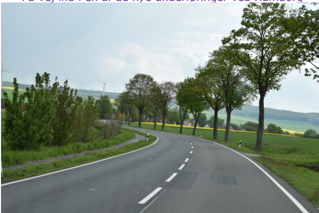
Gennem det flotte landskab på vej mod Weser Bergland