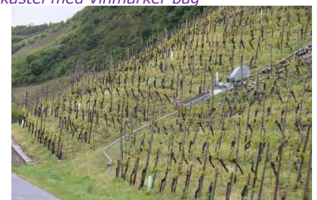
Vinmarkerne er i vækst