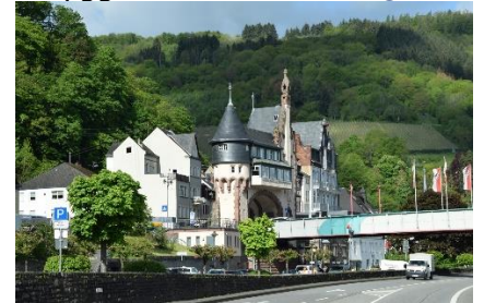
På vej fra Traben til Trarbach