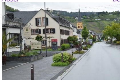
En af de kønne Mosel vinbyer