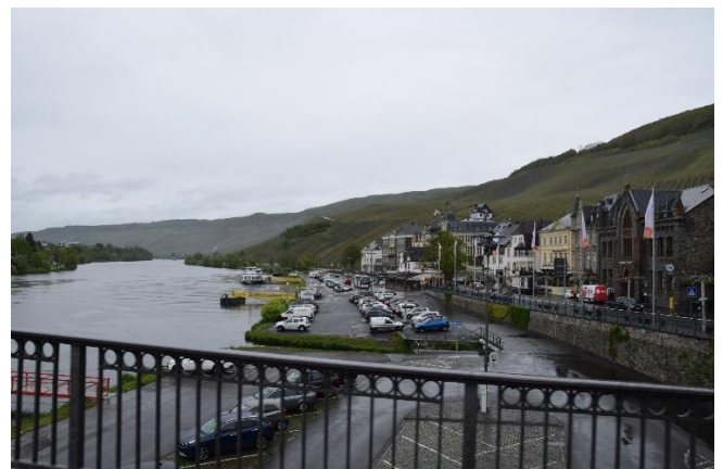
Bernkastel med vinmarker bag