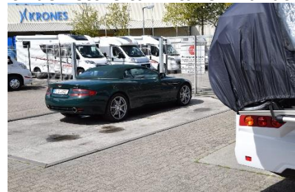
De 4 campere her kan sagtens købes for det denne Aston Martin koster i €

Tak for turen 😊: Vi har nydt turen, selv om der var lidt regn ind imellem. Vi har sluppet dejligt af, og er nu klar til den lange tur, Italien Rundt. 😊