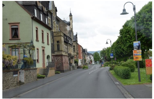
Fremme ved Mosel