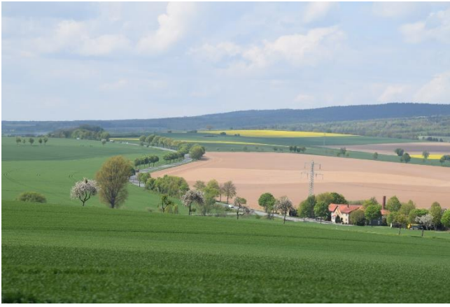
Det flotte Weser landskab