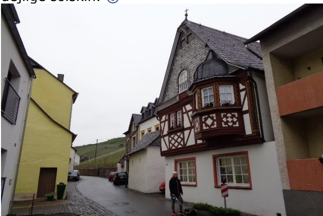
I udkanten af Graach an der Mosel

Der var regn i luften, da vi kørte fra Camperpladsen i Graach an der Mosel. Inden vi kørte langs Mosel, fik vi tanket i Bernkastel-Kues . Da der var vejarbejde i Bernkastel-Kues, valgte vi en alternativ vej, som ledte os ud gennem vinmarkerne, inden vi fandt tilbage til vejen langs Mosel. Efter at have kørt gennem mange små vinbyer i regnvejr, nåede vi frem til Weingut Feiten i Longuich. Den så hyggeligt ud, men da der ikke var sightseeing muligheder i nærområdet, og vi ikke havde godt af, at sidde og smage på vin en hel dag, besluttede vi os for at køre tilbage langs den anden side af Mosel, måske til Cochem. Her blev vi ledt ud på en omkørsel, hvor det var ren bjergkørsel, med hårnålesving, inden vi igen nåede ned til Mosel ved Trarben-Trabach. Nu i tørvejr, så vi kørte ind på Moselstellplatz , hvor vi fandt en fin plads. Senere gik vi en tur ind til Traben-Trarbach i det dejlige solskin. 😊