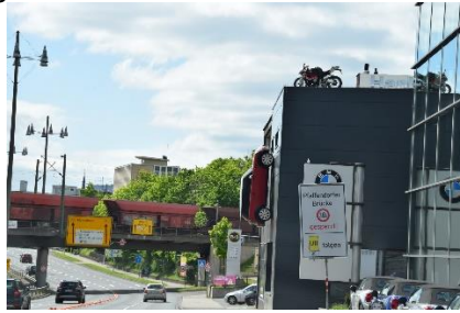
Undervejs langs Rhinen