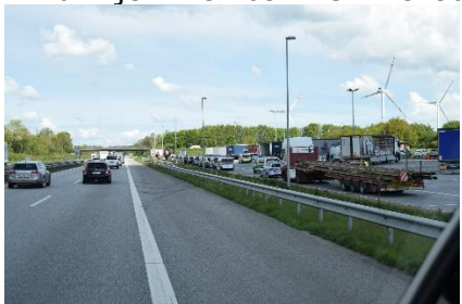
Polizei & Zoll i aktion med 17 biler

Vi kom let ud af Bremen, men på Autobahnen, var der lange køer af lastbiler ved afkørslerne ind til Bremen. Flere steder holdt de i 2 af de 3 baner. Ellers gik det let frem til Hamborg, hvor der var 10 km kø for at komme gennem Elbtunnel. Her kørte vi ad alternative ruter gennem Hamborg, og fandt frem til A1 og videre ad A21 og B205 frem til A7 nord for Hamborg. Nu gik det "gelinde", til vi var hjemme hos IMC i Flensburg, hvor vi fik Camperen gjort klar til den store tur "Italien Rundt"