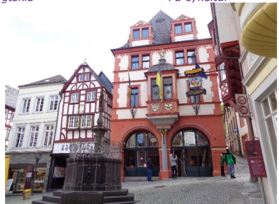
Torvet i Bernkastel - Flotteste by ved Mosel