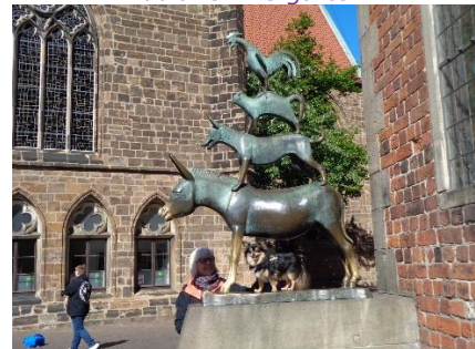
Chico med Stadtmusikanten