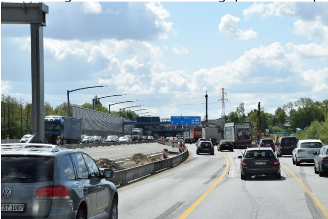
På vej ind i en af de nye underføringer ved Hamborg

Efter vi havde fået gas og købt lidt ind, kunne vi begive os ud på første del af turen, som var en ren transport ad A7, indtil vi passerede Hannover. Her drejede vi fra og kørte på flotte mindre veje frem til målet. Det var en fantastisk flot tur gennem det bakkede landskab og med mange skovstrækninger. Og helt fantastisk da vi kom frem til WeserBergland . Vi fandt let frem til Camperpladsen "Landhotel zum Anker" , hvor vi parkerede med "snuden" helt ud til floden Weser, og med udsigt til den lille kabelfærg, som transporterede biler og passagerer over floden. 😊