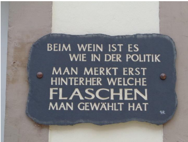
Hvor har husejeren dog ret!

“Beim Wein ist es wie in der Politik. Man merkt erst hinterher welche FLASCHEN man gewählt hat”