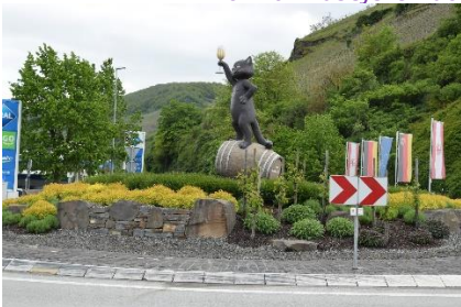
Rundkørsel i Zell am Mosel