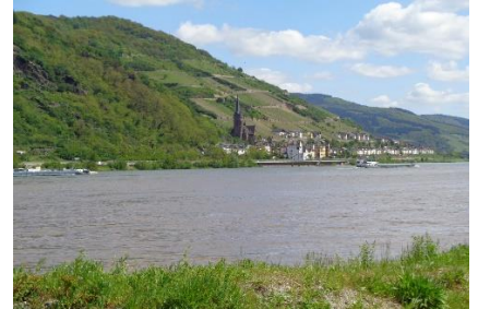
Stemningsbilleder fra Bacharach – Kønneste by ved Rhinen