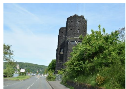
Resterne af Broen ved Remagen - vest