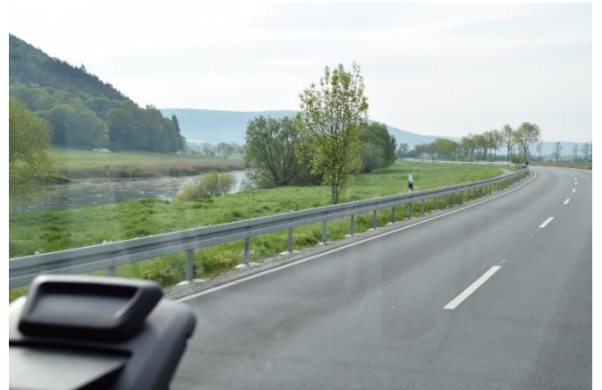
Gennem Weser Bergland