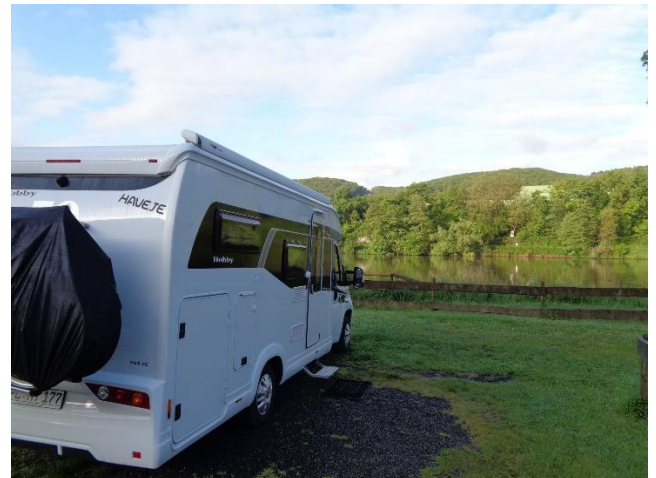
Vores Camper "Haveje" med snuden mod Mosel