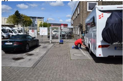
Der tømmes for vand