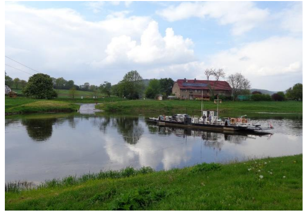
Kabelfærgen over Weser ved Landhotel am Anker