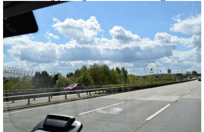
Snowdome og Riesenrad i Bispingen