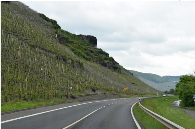
Mon det bliver til hvidvin