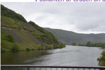
Mosel i gråvejr