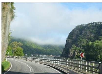
På vej langs med Rhinen