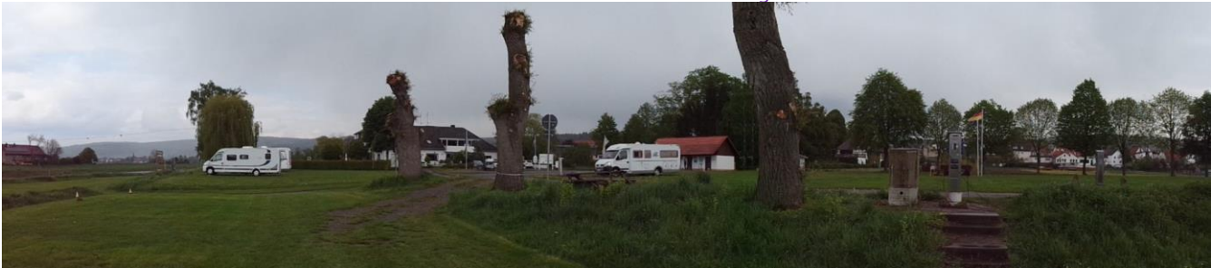
Camperpladsen ved "Landhotel am Anker" - Wahlsburg-Lippoldsberg