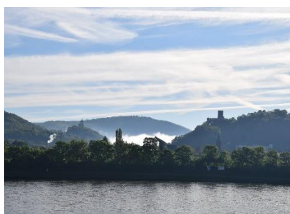
Morgendis ved Rhinen