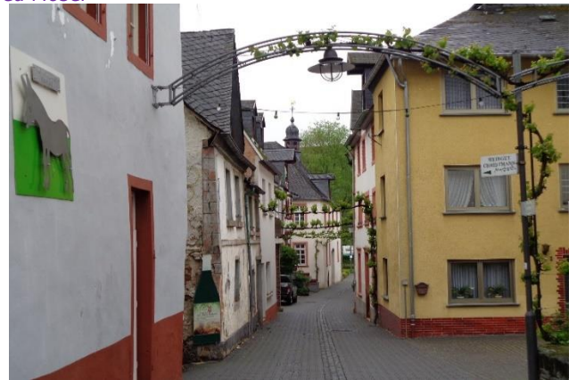
Smalle gader ved Mosel