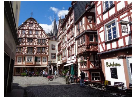
På rundtur i Berncastel