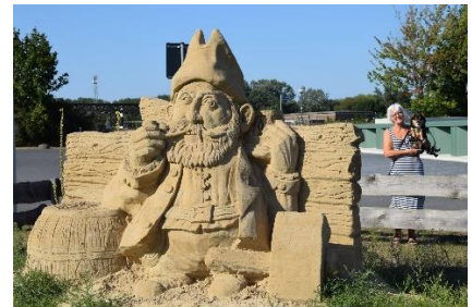
Sandskulptur af Klabautermanden

Senere gik vi en tur over på den anden side af havnen, for at se museet, som viser hvor "Hitler under WW2 udviklede sine V1 og V2 bomber". Efter et spændende og tankevækkende besøg gik vi tilbage til Camperen, hvor vi nød det fantastiske område, som Stellplatzen byder på. Et rigtigt "Klondike", hvor det er muligt, at leje sig ind og bo i et skib på land. Et større selskab af festlige unge boede i et skib lige bag os, og der blev festet igennem, selv om de blev lidt trætte hen ad dagen. "Gik vi virkelig også så tidligt døde???" Dem der skriver, at der er larm på pladsen, har vist glemt de selv har været unge, eller også har de haft et kedeligt liv 😊! Vores liv er ikke kedeligt og det bliver det aldrig 😊 😊.