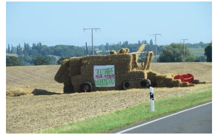
På vej mod Peenemünde / Usedom

Efter morgenmad fortsatte vi turen mod øst, og fandt gennem byen til A20, som vi fulgte mod den polske grænse. Vi var lidt spændte på, om de var færdige med at renovere Autobahnen, som var sunket sammen over hen over et blødt område. Det var de ikke, så vi endte i en længere Stau / Stoppender Verkehr, og kom gennem et stykke, hvor der kun var et spor i begge retninger. Køen i modsatte retning af os var i øvrigt "Megalang". Så er det man nyder, at vores vej trods alt var let 😊. Da vi drejede, fandt vi ud, at det hele gik ad Pommern til, men det gik straks bedre, da vi fandt ud af, at vi kørte ind i området som hed "Pommern". Kl. 12 kunne vi i 26 °C køre over broen til Usedom , og videre mod Peenemünde . Efter lidt problemer med GPS / vejlukninger / vejarbejder fandt vi frem til Stellplatz Peenemünde , lige op til flere museer. Det var en rigtig fin Stellplatz og ikke kedelig, selv om det var ved museer. Efter vi var landet (ordet passer vist godt til museet for verdens første raketter) spiste vi en "Fischbrötchen mit einen Dunkel" på et gammelt skib 😊.