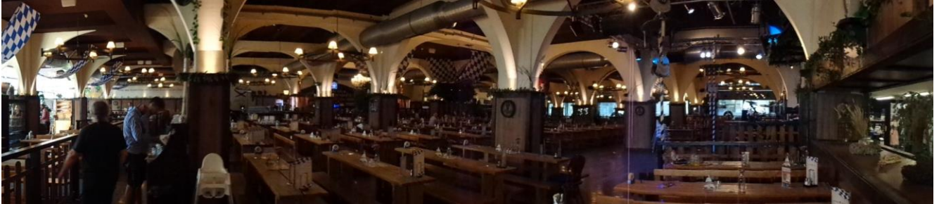
Et rundkik indenfor i Hofbräuhaus Berlin

Efter at have søgt lidt rundt var vi blevet tørstige, så vi besluttede os for at finde " Hofbräuhaus, Berlin ", som vi aldrig tidligere har besøgt. Her fik vi en dejlig Maas Bier, og da vi var blevet lidt sultne delte vi en "Schweins-Haxe". Der var Veganer-Festival på Alex, så da vi så, at de gik forbi