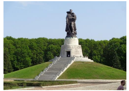
Det Russiske mindesmærke for sejren i slaget om Berlin 1945

Efter at have søgt lidt rundt var vi blevet tørstige, så vi besluttede os for at finde " Hofbräuhaus, Berlin ", som vi aldrig tidligere har besøgt. Her fik vi en dejlig Maas Bier, og da vi var blevet lidt sultne delte vi en "Schweins-Haxe". Der var Veganer-Festival på Alex, så da vi så, at de gik forbi