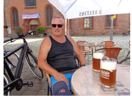
En dejlig øl nydes i Plön