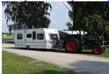
Ja, og med specielle campingtrækkere