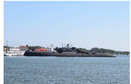
Russisk U-båd (Verdens største konventionelle U-båd)