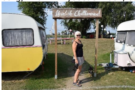
En Campingplads med særlige områder