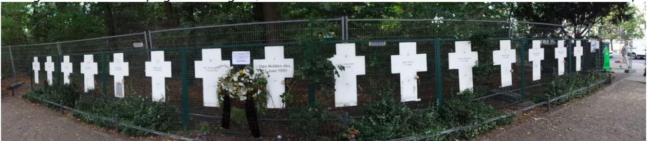
Mindesmærket for "Murens ofre"

var Veganer Festival. Vi fandt hurtigt videre, og op til Häckescher Markt, hvor vi nød "ein Kaltes Halbliter Bier" med en "Nachos med ost". Nu var det tid til at finde tilbage til Camperen, ad de små gader uden trafik, og vel tilbage nød vi det udenfor i solen. "Vorherre" var ikke helt med os,