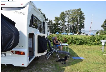
Udsigten over Plöner See nydes

Vi slog øjnene op til endnu en dejlig dag. Solen var stået op, og havde løsnat op i skyerne, så den kunne titte ned til os, dog lidt sløret. Efter morgenmaden satte vi kursen mod næste stop Plön. Efter et kort stykke kørte vi over Elben og et stykke på Autobahn mod Hamburg, og videre ad A1, og A21 mod Kiel. Trafikken gled fint, men i modsatte retning var der lang kø mod Hamburg. Da vi kørte op ad A21, blev vi overhalet af flere med trailer med "Stokcars". Jeg tror de skulle til Werner Rennen, som afholdes i den kommende Weekend. Jeg regner med, at I kender "Werner Beinhart", og øst for Neumünster er der hvert år Festival med musik og Race – Kendt som Werner Rennen.