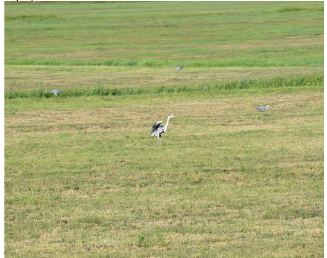
Traner søger føde