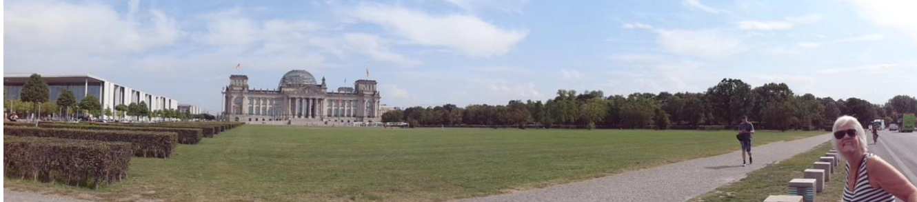
Reichstag med Fra "Merkelig's" kontorer til venstre

dybe vandpyt rundt om hans camper. "Hvor ondt vil I nok sige, men som Autocampist er man nødt til at more sig over egne og andres fejltrin. Det blev en dejlig aften, og den uheldige fik tørret op og kunne fortsætte sit ophold i Berlin. Vi nød resten af aftenen indenfor indtil sengetid.