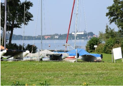
Udsigt fra Camperen på Camping Gut Ruhleben i Plön

Lidt skuffede kørte vi tilbage til Plön bymidte, hvor vi nød en lille forfriskning, inden vi kørte tilbage til den flotte udsigt fra Camperen. Det blev til en Schnitzel på campingpladsens lille restaurant inden vi nød aftenen ved camperen.