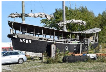
Udlejningshytte på Stellpladsen