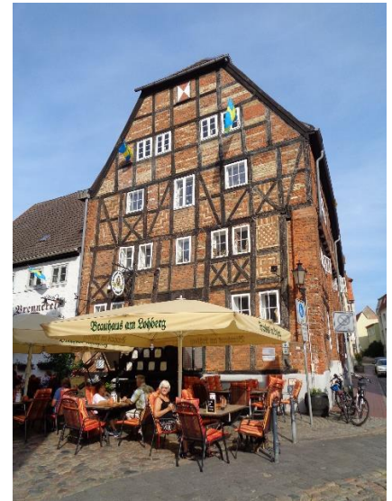
Vi nyder en "Mumme" på Brauhaus am Lohberg