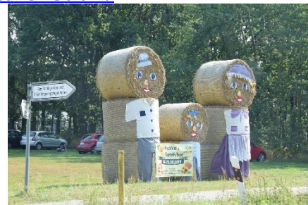
Et indtryk fra køreturen

Her fik vi meldt os i receptionen, og kunne køre over diget, for at finde en plads næsten nede ved Elbens bred. Her nød vi det dejlige vejr i skyggen, med godt 30 °C. Senere tak det op, og vi fik en regnbyge. Vi kunne høre det buldrede kraftigt i retning af Hamborg, så de har måske fået en lignende byge, som vi fik i Berlin. Vi nød aftensmaden imens og slappede senere af indtil sengetid.