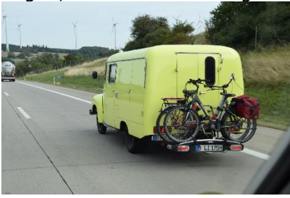
Brandbil ombygget til Autocamper

køre de 3 km frem til Campingplatz An der Havel . Her slappede vi af og hyggede os resten af dagen, kun afbrudt af en gåtur i Ketzin.