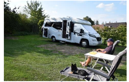
Afslapning på Haard Camping