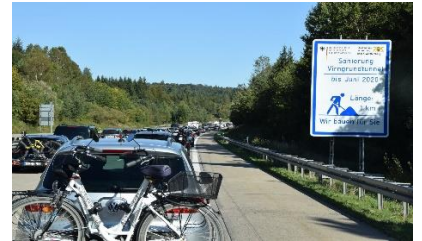
Kø ved Virngrundtunnel

Dagens etape var en af de længere, så der var mørkt, da vi stod op, så vi kunne komme videre, så snart receptionen åbnede. Det havde været en kølig nat, og da vi kørte ud gennem porten kl. 08.15 var der kun 5 °C, men temperaturen steg hurtigt. Vi fandt hurtigt ud på A96 mod Memmingen, hvor vi kørte over på A7, som ender ved den Danske grænse. Vi skulle nu ikke så langt, for ved Feuchtwangen drejede vi over på A6, som vi fulgte til Nürnberg. Inden vi drejede fra A7, nåede vi lige at komme i kø