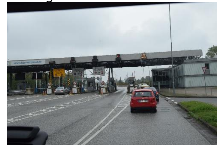
Mautstelle ved Herrentunnel