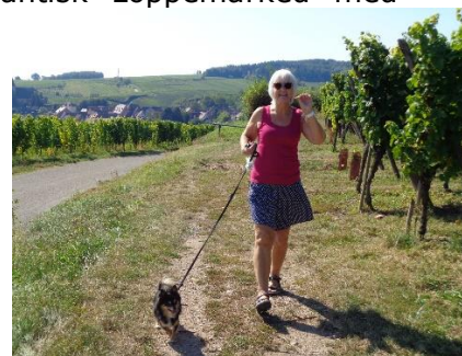
En lille smagsprøve på druerne

Vi fortsatte hele byen igennem og kørte et stykke udenfor byen, inden vi besluttede os for at vende om, og køre gennem vinmarkerne til Hunawihr. Undervejs nød vi det fantastiske dejlige vejr, med solen skinnende fra en klar himmel, ud over det flotte bølgende landskab med vinranker så langt øjet rakte. Helt ude bagved kunne vi ane højdedragene i Schwarzwald og mod syd, udkanten af Alperne. Fra Hunawihr kørte vi ad den "fladere" vej tilbage mod Ribeauville og Campingpladsen, hvor vi nød det resten af dagen med temperaturer, der nåede op på 28 °C sidst på eftermiddagen. 😊 😊 😊