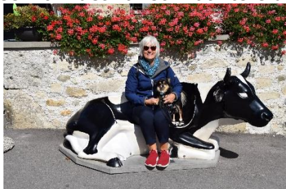
Afslapning inde vandfaldet skal ses

Ved middagstid kunne vi parkere på parkeringspladsen ved Burg Laufen, og gå den spektakulære tur ned til Rheinfall, som vi kunne beundre fra allernærmeste hold. Et sted var der max. 2 meter til det frådende og brølende, helt hvide vand, som for forbi. At stå at se på vandet var facinerende selv om det var som at være ude i støvregn. Oplevelsen kan ikke beskrives men skal opleves! 🇨🇭