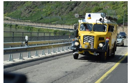
Gammel Brandbil ombygget til Autocamper

fandt en plads i 4 række fra Mosels bred 😊. Det var blevet lidt overskyet, men med lidt sol ind imellem. Vi nød vores velfortjente rejsegilde-øl, gik en lille tur i vinbyen Graach, og nød det ved camperen resten af dagen.