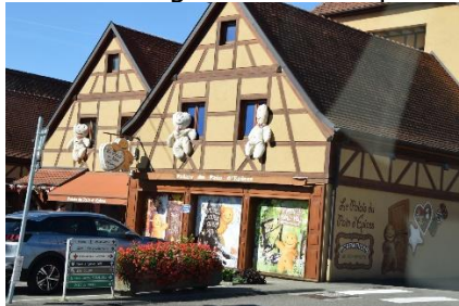
Velkommen til Alsace