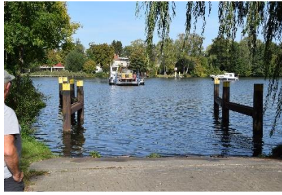
Færgen over Havel