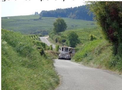
Turisttog i vinmarkerne

bakkede veje gennem vinmarkerne, for at få en forfriskning. 😊 Turen var kun ca. 5 km, men det gik virkelig op og ned, gennem vinmarkerne. Vi havde en fantastisk udsigt ud over det "store hav" af vinmarker, mens solen skinnede ned på os fra en skyfri himmel. Selv på en elcykel var det hårdt, at køre op og ned ad de stejle bakker. (Hårdt for både mig og batterierne). Det kunne godt mærkes, at jeg havde cykelanhænger med Chico bag på cyklen. Efter en dejlig lang nedkørsel kunne vi parkere vore cykler udenfor Dolder-tårnet (Gl. tortur- og fangetårn). Vi gik gennem porten i Dolder-tårnet og kom ind i den romantiske og