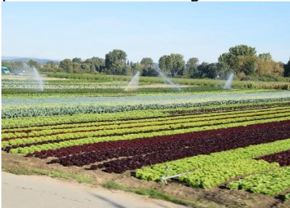
Salat på markerne

Vi sov længere end vi plejer, for dagens tur er en af de kortere. Vi kørte ad mindre vej, og var et smut i Lidl for at handle, inden vi tog vejen langs nordsiden af Bodensee, med kurs mod Lindau. Mange steder havde vi et flot vue ud over Bodensee, andre steder kørte vi langs marker med frugttræer. Ude i horisonten kunne vi over æbletræer og Bodensee, se Alpetoppene igennem disen. Det var en rigtig flot og afvekslende tur. Enkelte steder var der forsinkelse igennem byerne, men så fik vi set dem lidt bedre. Snart var vi fremme ved Camping Gitzenweiler Hof , hvor vi kl. 12.00 kunne tjekke ind, inden receptionen holdt middagslukket. Lidt sjovt, så holdt vi på samme plads, som da vi var her på vores forsommertur, Italien rundt . Vi hyggede os i solen på campingpladsen resten af dagen.