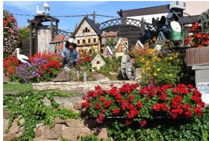
En privat have set undervejs