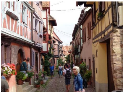
Rundt i Eguisheim