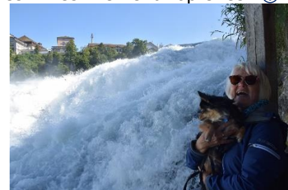
Lidt skræmmende at stå så tæt på