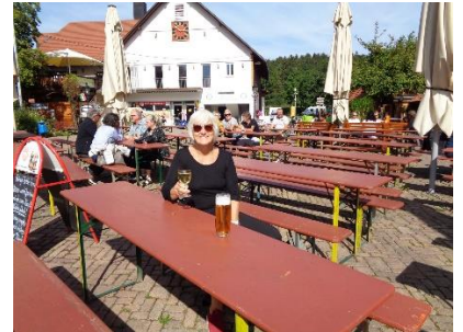
Afslapning på Gitzenweiler Hof