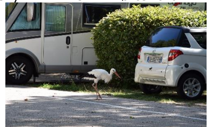
Stork på campingpladsen

Snart kørte vi ind i Region Alsace, hvor solen skinnede fra en helt skyfri himmel. Vi kørte forbi marker med Humle og Hvidkål til Choucrut, inden vi drejede fra motortrafikvejen, for at køre ad de mindre veje mod syd langs foden af Vogeserne. Fremme ved Ribeauville fandt vi hurtigt Camping Municipal Pierre Coubertin , hvor vi standsede i opmarchbåsen nede på vejen. Vi var heldige, sagde de i receptionen, de havde nemlig kun 1 ledig plads til vores Camper. Vi fik os placeret, og efter lidt frokost og afslapning, cyklede vi ind til centrum, hvor vi gik en tur i den gamle bydel. Vi nød atmosfæren med de mange mennesker og de smukke gamle huse. Vi var simpelthen nødt til at sætte os ved en restaurant, for at fordøje oplevelserne, og det hjalp et koldt glas Gewürzraminer os med. 😊