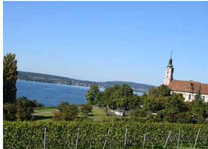
Udsigt til Bodensee over frugttræerne