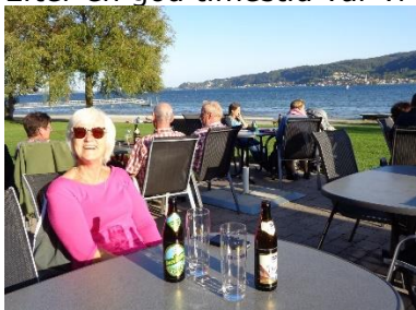
Oplevelsen af Rheinfall fordøjes

Efter en god timestid var vi klar til at fortsætte, ad mindre veje gennem Schweiz, inden vi drejede ind over grænsen til Tyskland. Heller ikke her var der nogen kontrol, så vi fortsatte videre langs Untersee frem til Campingpladsen Horn , hvor vi selvfølgelig ankom imens der var "Middagsruhe". Kl. 15.00 kunne vi tjekke ind og få parkeret Camperen i Rundel nr. 1, plads 8. Campingpladsen var inddelt i rundeller, så jeg fik associationer til Western-film, hvor vognene parkerede i cirkler, når indianerne angreb. Her var ingen indianere, men en hæk på bagsiden af camperen. Efter at have nydt det dejlige solskin i cirklen foran camperen, gik vi ned til See-Terrassen,