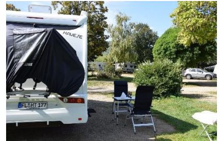
Vi fandt heldigvis "nydningen"