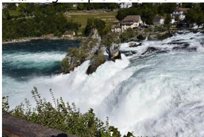
Rheinfall - Fantastisk!