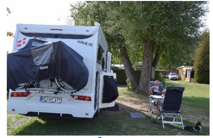
Afslapning på campingpladsen