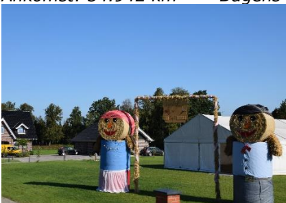
Der er Høstfest i området

Ankomst: 34.942 km - Dagens etape: 475 km Turen indtil nu: 547 km.