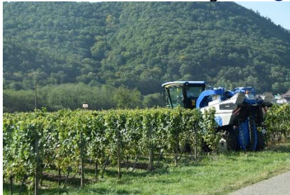
Høstmaskine i vinmarken

inden vi gik en tur ned i den gamle by, Eguisheim, hvor vi gik en runde i de smalle gader rundt om bycentrum. Vi må nok sige vi var lidt skuffede, for byen levede ikke helt op til det vi huskede. Der var ikke det samme "Leben"! Måske er det tidspunktet? Tilbage ved Camperen nød vi solen fra en skyfri himmel og op til 29 °C. Senere kom der lidt skyer på himlen. Efter aftenmaden nød vi det indenfor indtil sengetid. ☺