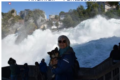
Fantastisk syn til det "brølende" vand!