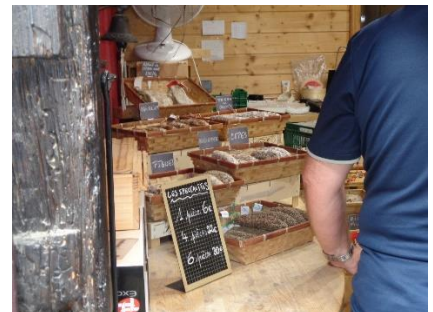
Salgssted for Pølser