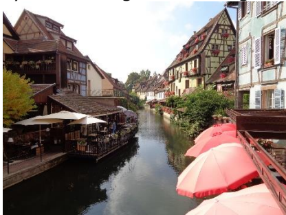
"Le Petit Venice" i Colmar

Vi stod op til endnu en dejlig dag med solen på vej op over horisonten. Hen ad formiddagen fandt vi cyklerne frem og satte kursen mod Colmar, hvor vi ville gå en tur i det gamle bycentrum ☺. Vi bad Google Maps om at lede os ind til byen, og efter 6 km på cykel i fladt terræn kunne vi parkere cyklerne ved Le Petit Venice ☺. Ligesom i Venedig kan man sejle på kanalen, men her er det ikke i gondol men i en fladbundet båd med El-motor. Efter vi havde taget de "obligatoriske foto" trak vi cyklerne ind gennem det gamle bycentrum, hvor vi nød de gamle huse og de store kirker.