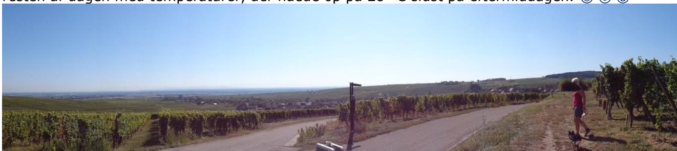
Vue ud over vinmarkerne i Alsace