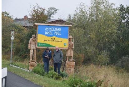
Oplevelser undervejs på Insel Poel