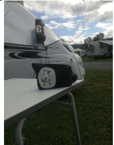
Stork på vej til Alsace