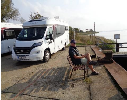
Afslapning på Poeler Forellenhof

Selv om der var spærret i byen pga. vejarbejde, kunne vi alligevel køre videre uden at skulle med den lille færge.