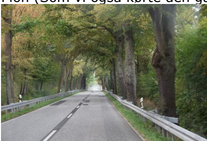
På vej hjemad

Vi kom nemt gennem Plön, men ved Kiel var der vejarbejde, med en bane gennem byen. Men skidt vi slap for kø og kunne køre over NordOst See Kanal og gennem Eckernförde uden problemer. I Schleswig kørte vi ud på A7 og snart var vi hjemme ved IMC, hvor vi kunne få tømt vand af og skifte bil, så vi kunne køre til Nordborg. Her fik vi læsset af og kunne slappe lidt af 🌊. Vasketøj, få varme på osv. var nu opgaven, men også det klarede vi. Afslutningsvis kunne vi skåle for en dejlig tur i et glas koldt "Rose", og ønske at vi næste gang får lige så skøn en tur.