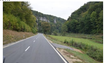
På vej gennem Fränkische Schweiz