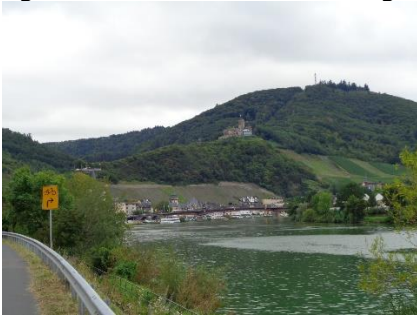
På vej mod Bernkastel-Kues