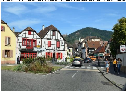
Farvel til Ribeauville

Vi kørte fra campingpladsen i solskin og klar himmel. Inden vi kørte ad de mindre veje mod syd, var vi et smut i E.leClerc for at proviantere. Vi fik det hele pakket ned, og fortsatte ad vinrouten mod syd, forbi Riquewihr til Ingersheim, hvor vi drejede mod Turkheim. Vi ville et smut forbi campingpladsen i Turkheim, hvor vi var første gang, vi var i Alsace. Vi fortsatte ad de mindre veje gennem vinmarkerne og ad vinrouten frem til Eguisheim, hvor vi fulgte vejen rundt om den "runde" gamle bydel, og videre frem til Campingpladsen Les Trois Chateaux 😊. Her valgte vi plads 53, hvor vi fik os placeret, så camperen kunne give skygge for middagssolen. Vi delte 2 Pelforth Brune som rejsegildeøl sammen med en lækker Croissant,