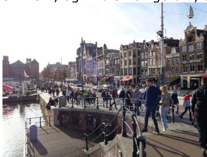
Masser af mennesker på gaden