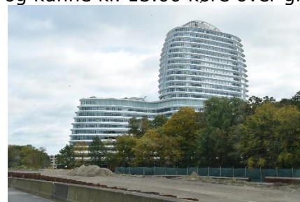
Nybyggeri i Groningen