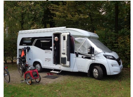
Klar til cykeltur

hjem), ind i centrum og forbi det store trafikcentrum med banegård, busstation og station for Troljebusser. Vi satte nu kursen tilbage mod campingpladsen og kunne nyde udsynet over store rekreative områder, inden vi var fremme ved Camperen, hvor vi slappede af resten af dagen 😊.