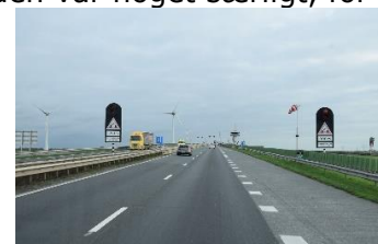
Klapbro på Motorvej

Velkomsten til Tyskland bestod af et vejarbejde, som spærrede Autobahnen, og sendte os ud på en omkørsel ad mindre veje, indtil vi igen kunne fortsætte på A31 mod nord ☺. Et sted så vi en helt hvid ko gå bagefter de andre køer i en flok. Vi tror, den syntes den var noget særligt, for den gik næsten, som når man ser "modeller", der går på Catwalken ☺. Det var ikke fordi, vi var ved at få hedeslag, selvom temperaturen, kort før vi nåede Bremerhaven, nåede op på 19 °C. Fremme ved Bremerhaven blev vi ledt gennem den sydlige del af byen og ned mod fiskerihavnen, hvor vi fandt " Stellplatz am Fischereihafen ". Sidst på eftermiddagen gik vi en tur ind langs havnen, til Schaufenster Fischereihafen, hvor vi gik ind på Restaurant Richard's. ☺