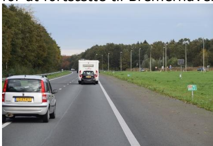
Bil sat på anhængertrækket

køre langt. Mens vi kørte ud over det flade land, nød vi kanalerne, der omkransede de store marker med græssende kvæg. Et sted kunne vi se ca. 20 store gå på en græsmark for at fange føde. Motorvejen førte os op langs østsiden af Ijsselmeer , og vi kørte over "klapbroer" på motorvejen. (Det er vist kun i Holland man har den slags) ☺. Vi så store flokke af fugle med hvidt bryst og sorte vinger, der sad på markerne, mon det er Viber på træk mod syd? Længere mod nord var landmændene godt i gang med store maskiner til kartoffelhøsten. Da vi kom frem til Groningen, besluttede vi os for at fortsætte til Bremerhaven, og kunne kl. 13.00 køre over grænsen til Tyskland i 17 °C.