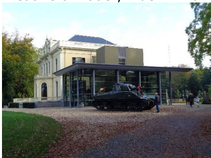
Airborne Museum Hartenstein