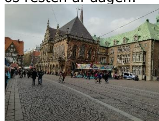
Fra Ischa Freimaak