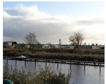
Kik over til Camperen på Stellplatz "Am Halbmond"