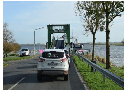
Færgeløjet i Wischhafen

med at drille os, idet den fortalte, at både den ene og den anden vej var spærret, og at omkørslen ville være 1274 km 😊. Det troede vi ikke på, så uden at tænke på GPS'en, satte vi kursen ad A27 mod Cuxhaven og videre ad B73 mod Wischhafen. Vi kørte gennem et meget fladt landskab, men vi kunne se, at markerne var i bølger. Vi blev enige om, at det nok var for at sikre at regnvandet lettere løb ud til de mange små kanaler, hvor vandet stod højt.