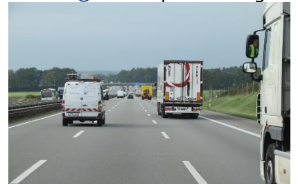
Undervejs mod Bremen