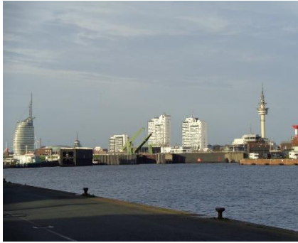
Udsigt fra Camperpladsen

Her fik vi turens første varme mad, bestående af en lækker "Krabben, Sahne Suppe" og "Richard´s Fischplatte mit Bratkartoffel" 😊. Godt mætte "vraltede" vi ud langs havnen til Camperen, hvor vi efter "En lille En" slappede af resten af dagen.