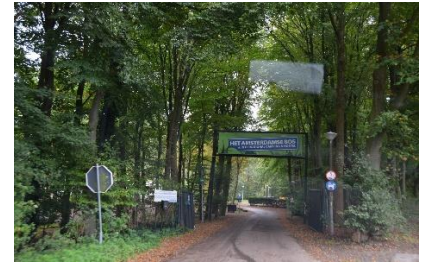
Camping "Het Amsterdamsebos"