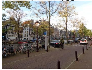
Ved Grachten "Singel"