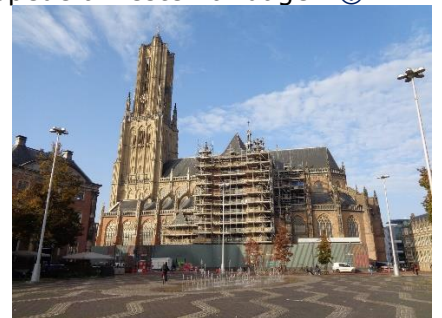
Domkirken i Arnhem