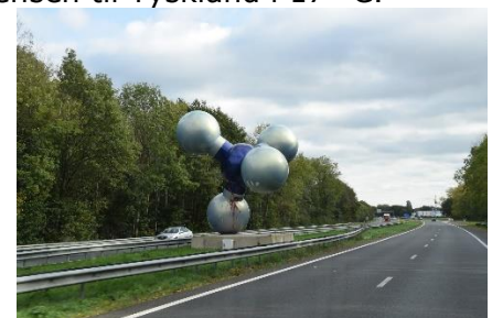
Udsmykning med motorvejen

Velkomsten til Tyskland bestod af et vejarbejde, som spærrede Autobahnen, og sendte os ud på en omkørsel ad mindre veje, indtil vi igen kunne fortsætte på A31 mod nord ☺. Et sted så vi en helt hvid ko gå bagefter de andre køer i en flok. Vi tror, den syntes den var noget særligt, for den gik næsten, som når man ser "modeller", der går på Catwalken ☺. Det var ikke fordi, vi var ved at få hedeslag, selvom temperaturen, kort før vi nåede Bremerhaven, nåede op på 19 °C. Fremme ved Bremerhaven blev vi ledt gennem den sydlige del af byen og ned mod fiskerihavnen, hvor vi fandt " Stellplatz am Fischereihafen ". Sidst på eftermiddagen gik vi en tur ind langs havnen, til Schaufenster Fischereihafen, hvor vi gik ind på Restaurant Richard's. ☺