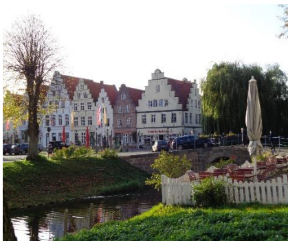
På gåtur i Friedrichstadt

Vi fandt færgen i Wischhafen og efter at have betalt 19 €, kunne vi sejle med over mod Glückstadt på nordsiden af Elben. På vej mod Brunsbüttel kørte vi forbi Atomkraftværk Brokdorf (Lukker 2021). Efter en enkelt omkørsel kom vi frem til Tönning, hvor vi kørte ud til Campingpladsen, som har 2 camperplads-afdelinger med udsigt ud over Ejderen. Vejret taget i betragtning, blev vi enige om at Tönning , nok var for kedelig at besøge, og fortsatte i stedet mod Friedrichstadt , hvor vi kørte ind på " Camperplads Am Halbmond ", og fandt plads "5 Molly". Camperpladsen ligger klemmt inde mellem dæmningen på nordsiden af Ejderen og Friedrichstadt. Om eftermiddagen gik vi en tur ind i Friedrichstadt, hvor vi nød kanalerne og de flotte huse. Der var ikke mange turister i byen, og forretningerne var lukkede, men flere cafeer og restauranter var åbne. Vel tilbage ved Camperen stod den på hygge og afslapning resten af dagen.