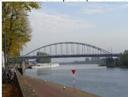
Broen ved Arnhem (Ny)