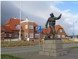
Statue på havnen