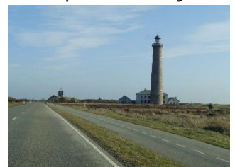
Det Grå Fyr