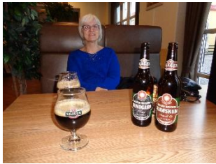
Skagen øl nydes

Der var ingen mennesker på havneområdet, og de små restauranter var lukkede, bortset fra en enkelt. Vi drejede op mod vores hotel, men besluttede at gå et lille stykke ud ad Sct. Laurentii Vej, forbi Slagter Munch og i rundkørslen ved Mindestøtten vendte vi om og gik tilbage til hotellet.