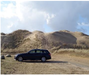
Klitten ud for Stokmilen

Efter et kort besøg ved Holger Drachmanns grav , fortsatte vi køreturen mod Skagen Nordstrand, hvor vi ville gå langs stranden til Danmarks nordligste punkt . Vi nåede ikke så langt, for lige efter vi var kørt forbi Radarstationen blev vejen, der nu var grusvej, væk i en stor vandpyt, som vi ikke turde køre igennem. I stedet kørte vi mod Højen eller Gl. Skagen , som det også kaldes. Vi kørte først ned til stranden, hvor vi tog en kort gåtur, og kunne se at de var i gang med et kystsikringsprojekt. Vi fortsatte videre gennem Gl. Skagen og gjorde et kort ophold ved "Solnedgangspladsen" , inden vi slog et smut forbi Ruths Hotel . Lige ved siden af var et vel 60 – 70 m 2 sommerhus til salg – 5.900.000,- kr. stod der på skiltet, utroligt 🤯. Vi havde ikke fået så mange penge med på