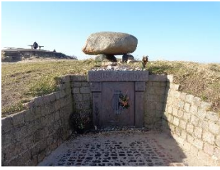
Holger Drachmanns grav