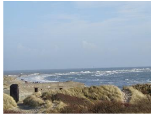
Udsigt til Grenens spids