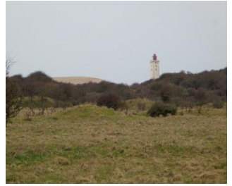
Rubjerg Knude fyr