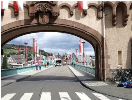
Et kig over broen mod Trarbach

I Traben-Trarbach kørte vi under den flotte bro, som forbinder de 2 bydele som giver bynavnet. Vi fortsatte lidt ad promenaden og drejede op i byen, så vi kunne komme over broen til den anden side af Mosel, hvor vi kørte gennem "Brückentor", og var i Trarbach. Her gik vi en tur i de gamle gader, inden vi fortsatte vores rundtur ad "Moselradweg" til Enkirch, hvor vi drejede ind gennem den smalle hovedgade. Fremme ved den "prisbelønnede" slagter fik vi købt kød ind til grillen, og ved bageren et dejligt brød. Den lille købmand havde middagslukket, så vi kørte tilbage til camperen, hvor vi fik en dejlig frokost, og slappede af efter en dejlig cykeltur på 22 km. Senere tog vi igen cyklerne og udforskede byen lidt, inden vi fik handlet lidt ved købmanden og kunne tage tilbage til camperen, for at smage på en af flaskerne. Senere grillede vi de lækre steaks med "grillede Bratkartoffel". En lækker aftensmad, som vi nød med et enkelt glas dejlig vin i det dejlige vejr. Men ad aftenen trak vi indenfor, så jeg kunne få skrevet lidt, men