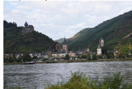
Kik over Rhinen til Bacharach

Ved Wiesbaden kørte vi over på A66 frem til Frankfurt, hvor der var vejarbejde og langsom kørsel. Kort efter kørte vi over på A5, som vi fulgte op gennem Taunustal. Efter et godt stykke kørte vi fra for at følge forskellige Autobaner og B3 i retning mod Kassel. I Kersten Hausen fik vi tanket diesel til 0,999 €. Det billigste på turen. Vi kørte nu over på A49, som vi fulgte til Hof Geismar, hvor vi igen kom over på B3, og senere ad mindre veje langs floden Weser til Lippoldsberg, hvor vi ankom kl. 13.20 på Stellplatz " Landhotel zum Anker ". Her fik vi parkeret med "snuden" ud mod Weser, så vi kunne se, de få kanoer der sejlede forbi, men vigtigst så vi kunne se den lille færge " Märchenfähre Lippoldsberg ", som blev trukket over floden af strømmen. (Strømmen i Weser sørger for at færgen sejler. Der er en wire tværs over Weser, hvor den hænger