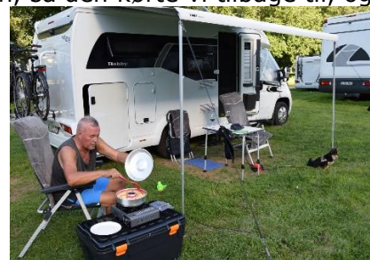
Så er der gang i vores Omnia

vinmarker, og med slotte på bjergene langs Rhinen. Kort før Koblenz kørte vi over Rhinen og videre ned mod Mosel, som vi, i 20 °C og solskin, fulgte frem til Traben-Trarbach, hvor et skilt i indkørslen til pladsen fortalte, at alt var optaget – 0 ledige pladser. Nå, vi havde set en Camperplads, hvor der var ledige pladser, ca. 4 km før Traben-Trarbach, så den kørte vi tilbage til, og fandt en dejlig plads. I 21 °C fandt vi kl. 13.30 en plads på " Wohnmobilstellplatz Enkirch ", hvor vi fik os placeret med udsigt til Mosel. Efter en velfortjent "rejsegilde-øl" fik vi set os om på Camperpladsen, og senere en lille tur i vinbyen Enkirch, hvor vi fik købt et par flasker lokal Moselvin ved en ældre mand, som havde en lille købmandsforretning. Tilbage ved camperen nød vi resten af dagen i solen, og fik en smagsprøve på den ene af de nyindkøbte moselvine. Det var nu ikke vinen, der fik os til at beslutte, at blive nogle dage her, men de gode muligheder for cykelture langs Mosel. Nu glæder vi os til morgendagen, hvor vi tager en rundtur på cykel til Traben-Trarbach. Godnat!