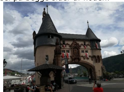
Port til Broen i Traben-Trarbach

Vi startede med at køre "nedstrøms" langs Mosel til broen, som førte os over til Reil. Her kunne vi køre langs Mosel, ad en mindre vej og senere en cykelsti frem til Traben-Trarbach.