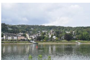
Stemning ved Rhinen

Dagens etape: 332 km. Turen indtil nu: 814 km.