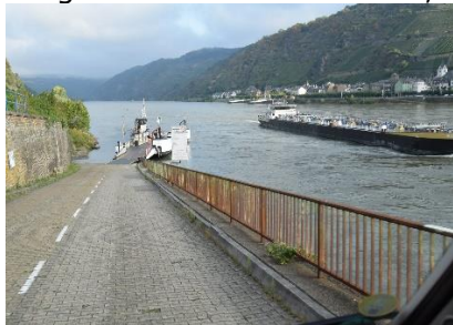
Vi tager færgen over Rhinen til Kaub

Efter vi havde nydt morgenmaden, gjorde vi os klar til at forlade Bacharach for denne gang, men vi kommer igen! Vi havde besluttet os for, at vi ville køre langs Rhinen mod Rhüdesheim, så vi tog færgen over Rhinen til Kaub, og kørte mod syd på B42. Der var vejarbejde tre steder, men vi var