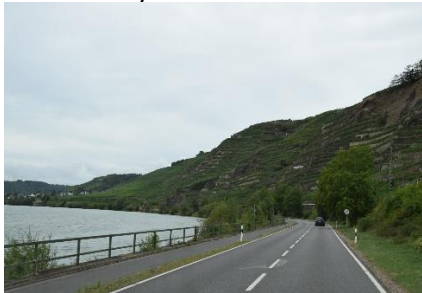
Vinmarker ved Mosel

mundten. I en af Ruhrbyerne, kunne vi se busserne køre i midterrabatten på Autobahnen, lidt specielt så det ud, men trafikken hindrede os i at finde den logiske forklaring. Efter vi kom fri af Ruhrområdet tyndede det ud i trafikken, og vi kunne nyde turen videre, nu ad Bundesstrasse gennem