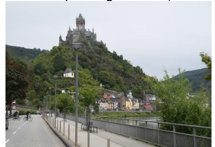
Borgen i Cochem

tidligt afsted, besluttede vi os for at følge Mosel til Koblenz. Det var en dejlig tur, kun afbrudt af et indkøb i REWE i Cochem. Efter indkøbet fortsatte vi mod Koblenz, hvor vi kørte over på B9, så vi kunne køre langs Rhinen, med udkig til de mange borgruiner og ikke at glemme Loreley klippen, hvor mange søfolk i gamle dage måtte lade livet da "die Loreley" sang så kønt, at de glemte at styre skibet, og derfor forliste. Vi kom fint forbi Loreley, godt nok på modsatte bred af Rhinen, og kunne