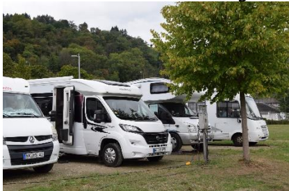
Vi holder i forreste række mod Rhinen

Det havde regnet lidt om natten, men da vi stod op, var det dejligt vejr, og det så ud til at solen kunne få jaget nogle af skyerne væk. Formiddagen nød vi med at kigge på skibene, som sejlede forbi. Efter frokost startede vi en gåtur, hvor vi ville gå langs med den gamle bymur, som er resterne af et stort fæstningsværk, fra ca. år 1320, med mange tårne og en større borg. Mange af tårnene er restaureret, og står som de så ud for mange hundrede år siden, andre er delvis restaurerede og giver sammen med borgen og bymuren indtryk af et næsten uovervindeligt fæstningsværk. Borgen er helt restaureret og benyttes i dag som "Jugendherberge" (Vandrerhjem). Det er meget bogstaveligt, at det er "Jugendherberge" for det er kun unge, som kan gå op ad den stejle sti med bagage, og stadig have luft til at bede om overnatning. Fremme i syd enden af Bacharach fandt vi starten på stien rundt om bymuren.