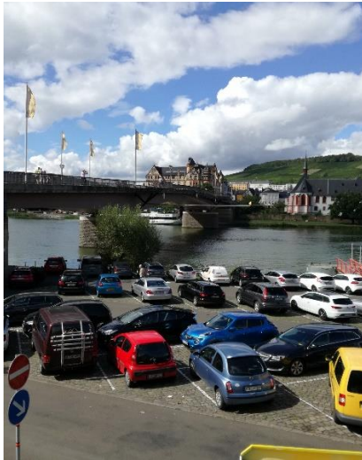
Så er vi nået til Bernkastel-Kues

Vi vågnede efter en god nats søvn, og kunne se at skyerne hang lavt ned over dalen. Vi nød morgenmaden, og kunne se skyerne kravle længere op mod bjergtoppen, og efterhånden begyndte solen at titte frem mellem skyerne. Nu var det tid til at begynde dagens "mission", nemlig en cykeltur til Bernkastel-Kues ad Mosel Radweg, en tur på 55 km inden vi igen kunne være tilbage ved Camperen. Heldigvis har vi elcykler, så vi startede den kønne tur langs Mosel, hvor vi kørte forbi Traben-Trarbach, og kunne se ind til Camperpladsen, vi kørte forgæves til i torsdags. (Vi er glade for byttet til Enkirch). Længere fremme kom vi til Graach am Mosel, hvor den fine Camperplads er lukket. Mosel Radweg går mellem floden og