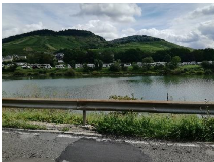
Vi ser over Mosel til Camperpladsen

Vi havde god tid og nød morgenmaden, inden vi fik cyklerne taget ned fra camperen og gjort klar. Chico's vogn blev samlet og sat fast på min cykel, og kl. 10.45 kunne vi trille af sted i det dejlige vejr. Havde besluttet os for at tage en lille rundtur med 2 broer, så vi kunne køre langs Mosel på begge sider af floden.