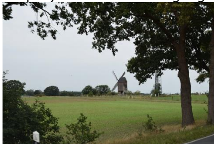
Vi kører på Deutsche Mühlenstrasse