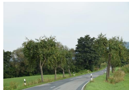
Frugttræer som vejtræer

Vi nød morgenen lidt længere, end vi plejer, da vi kun skulle ud på en tur på ca. 200 km. Vi havde hørt, at der var store problemer med vejarbejde og køer på A7 omkring Fulda, så det passede fint, at vi ikke ville køre på motorvej. Vi kørte fra Camperpladsen kl. 08.30 og kørte ad snoede veje gennem skove og over de små bjerge i Weser Bergland. Undervejs på turen mod Uslar, kunne vi se ned til Lippoldsberg, vi lige havde forladt. Efter vi havde handlet lidt fornødenheder i Uslar fortsatte vi ad Märchenstrasse, hvor der på en strækning, groede æbletræer langs vejen. Senere kørte vi igen, igen over på B3, hvor vi flere steder så campingvogne med hjerter på. (Nok ikke fordi de var glade for os – men at de var glædespi...) Selv om vi flere gange kørte over på andre veje, så kom B3 til at forfølge os, idet vi 4 - 5 gange kom ind på B 3 igen. Undervejs kørte vi forbi Kz Bergen - Belsen, og fremme i Bergen forbi det store militære område, som også stammer fra 2 verdenskrig. Længere fremme kørte vi forbi " Bechlingen War Cemetery " for faldne allierede soldater. Endnu en gang kørte vi over på B3, inden vi det sidste stykke kørte på en kommunevej frem til " Süd-See Camp " hvor vi kl. 12.30 fik parkeret, og sagt tak for en dejlig afslappende og afstressende tur, med fantastisk flotte landskabelige oplevelser. Her nød vi den sidste eftermiddag og aften på denne tur.