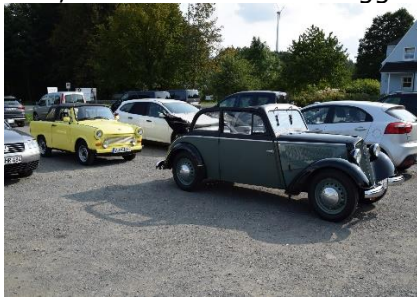
Trabi og IFA luftes