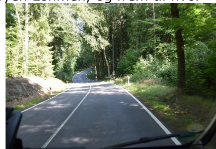
Vejen mod Bastei

borgen "Königsstein" og nogle af toppene fra "Bastei". Nu kriblede det lidt, for vi var "brændt af" 2 gange og skulle 3. gang være lykkens gang, at vi fandt en plads for natten? Vi drejede fra Autobahnen og ned mod Pirna, som ligger ved Elben, som vi kørte over og blev ledt gennem byen Lohmen, og frem til hvor vejen mod Bastei starter. Her skulle være en Camperplads, så vi drejede ind på parkeringen, men kunne ikke få det til at passe med, at der skulle