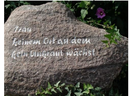
Der er noget om det!

Vi kørte gennem området med floderne Saale og Orla, hvor vi kørte ad små veje igennem flotte skove og forbi mange "Teiche" (damme), hvor der opdrættes Karper, som er "en stor spise" i området. Efterhånden var vi fremme ved Jena, som er en stor by, vel mest kendt for Optik til briller og kikkerter. Da der var vejarbejde, blev vi ledt ind gennem bycentrum, inden vi kom ud på landevejen mod Weimar. Ved Weimar blev vi