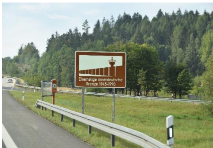
En af de mange mindetavler

Dagens etape: 202 km. Turen indtil nu: 1.332 km.