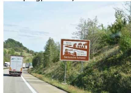
Vi kører ind i Sächsische Schweiz

kun for at få et vide, at alt var optaget. Vi kørte nu efter andre campingpladser / Stellpladser i Lübbenau, og efter en del omkørsel i byen, endte vi på en parkeringsplads, hvor vi kunne overnatte for 12 €. Da