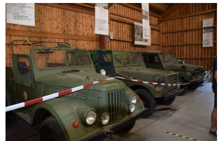
Udsnit af DDR vognpark