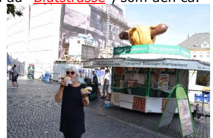
Vi nød en Original Thüringer Bratwurst

5 km lange vej ind til " Kz Gedenkstätte Buchenwald " hedder. Vi skulle dog kun køre 1 km, inden vi drejede ind i skoven, og ad skovveje kom tilbage til camperen, hvor vi fik et stort glas vand, inden vi nød et glas kølig hvidvin i skyggen bag "naboens" camper. Resten af dagen nød vi det dejlige vejr ved camperen. Det meste af eftermiddagen i skyggen, idet temperaturen udenfor nåede op på 31 °C, ihvertfald efter termometret i skyggen under Camperen (Har nok været et par grader lavere i skyggen). I camperen var det 32 °C selvom vi havde termomåten på forruden. Da det begyndte at blive mørk, trak vi indenfor, selv om temperaturen udenfor stadig her kl. 08.45 er 26 °C. Forhåbentligt falder temperaturen, så vi kan få en god nats søvn, inden vi i morgen tager cyklerne til "Kz Gedenkstätte Buchenwald", som i øvrigt var " Sowjetisches Speziallager Nr 2 " i tiden efter 2. verdenskrig.