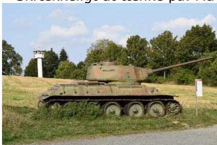
Russisk T33 Tank