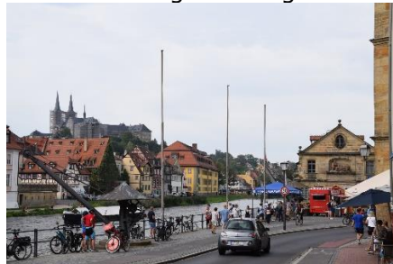
På vej ind i Bamberg

Wald. Kort efter kørte vi forbi Ulla, ja det var altså ikke Karins søster, men en mindre by der hed sådan. Vi kørte gennem det fantastisk flotte landskab i Thüringer Wald . Land-