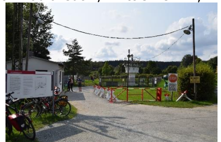
"Little Berlin" - Mödlareuth

14.10 på parkeringspladsen for "Museum zur Geschichte der Deutschen Teilung". Efter en velfortjent rejse-øl gik vi over for at se Mödlareuth, hvor der er genrejst mur og restaureret nogle af de gamle effekter fra delingen af Tyskland. For dem som ikke kender til Mödlareuth / "Little Berlin", så er det en landsby, hvor der løber en lille bæk, som er grænse mellem Thüringen og Bayern og dermed var grænse mellem DDR og Vesttyskland. (Mit første kendskab til byen var i forbindelse med en ZDF-serie " Tannbach " som DR viste på dansk fjernsyn for et par år siden – Lige siden har det været et stort ønske at se byen. Du kan se mere her: www.museum-moedlareuth.de – Stedet ligger tæt på A9, som mange tager på bilferie mod syd, så hold en pause og lad historien give dig en oplevelse.) Som sagt parkerede vi Camperen på parkeringspladsen, hvor flere Campere kom til for at overnatte. Vi brugte eftermiddagen og aftenen på at udforske byen og området, og kunne gå i seng med en stor oplevelse og eftertænksomhed om, hvordan historien kan ramme forskelligt, bare i en lille landsby med 50 indbyggere. Her var nogen heldige og andre uheldige, alt efter på hvilken side af bækken de boede. Og så var der dem der flygtede eller prøvede, og dem der blev taget / skudt var de rigtig uheldige – Skrækkeligt at tænke på. Må noget lignende aldrig ske!