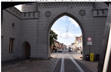
Et indkig i Potsdam

Vi vågnede til dejlig solskin, og kunne kl. 09.15 sætte kursen mod Lübbenau. GPS'en ledte os gennem Potsdam, hvor vi fik indkig til Zansussi og Holländische Viertel. Vi nåede lige et fejltrin og måtte køre en lille omkørsel, inden vi igen kom på kursen igennem Potsdam og videre mod A 10, hvor vi måtte forbi en "Polski Conwoy" af lastbiler, inden vi kørte over på A13 mod Dresden.