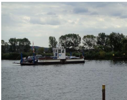
Aftenturen gik til Havel-færgen

krydset valgte vi den smalle vej, som gik gennem Paretz, som er en gammel by med et slot. Der var også brosten på gaderne gennem byen, så vi blev rystet igennem, inden vi kort efter kunne køre ind i Ketzin, og finde frem til " Campingplatz an der Havel " ", hvor der var middagslukket. Vi brugte ventetiden til at få lidt frokost og en dejlig "sort" øl. Efter pausen fandt vi en fin plads, hvor vi kunne parkere Camperen i dejligt solskin og 24 °C. Vi fik fundet stolene frem, så vi kunne nyde solen og et enkelt glas Rose'. Senere gik vi en tur ned til Havel, hvor den lille færge sejler biler over på den anden side. Tilbage ved Camperen var det blevet tid til hygge i solen, aftensmad og hygge i Camperen resten af dagen.