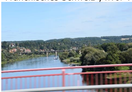
Vi kører over Elben ved Pirna

vi ikke havde lyst til at holde på en P-plads, blev vi enige om at fortsætte til Dresden, hvor vi havde gode minder. Efter et stykke på mindre veje, kom vi igen ind på A13 mod Dresden, og i 20 °C og stærk sol kørte vi nu mod Dresden. Fremme ved Dresden drejede vi ind mod Camperpladsen, ved en Camper forhandler, men her blev vi vinket væk af en Camper på vej ud – Alt optaget. Vi blev hurtigt enige om, at så kørte vi bare efter næste mål ved Bastei, syd for Dresden. Kort efter Dresden kørte vi ind i "Sächsisches Schweiz", hvor der er små bjerge, som ligner dem vi kender fra "Fränkisches Schweiz", hvor vores Bayeriske venner bor. Undervejs på Autobahnen kunne vi se