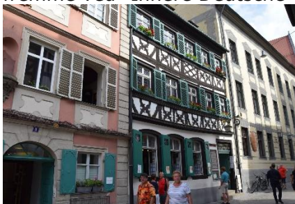
Her fås: Schlenkerla Rauchbier

skabet bølgede sig, og vi kunne nyde udsynene over det flotte skovlandskab fra de høje broer, vi kørte over. Ved Rennsteig kørte vi gennem en 7,9 km lang tunnel. Efterhånden var vi fremme ved "Innere Deutsche Grenze", og kørte nu ind i "Freistaat Bayern", hvor det flotte bølgende landskab fortsatte. Eneste forskel var, at vi i Thüringen kørte på nyere asfaltveje, og