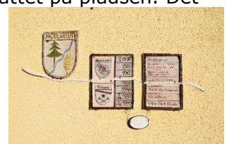
Opdeling på husmur

Da vi vågnede, kunne vi se, at der var 9 andre campere, som havde overnattet på pladsen. Det var den flotteste morgen at vågne op til med skyfri himmel og solen der var stået op og skinnede ned til os. Efter morgenmaden kunne vi kl. 09.20 i høj sol og 16 °C køre ud fra pladsen, mens tankerne om fortiden, for ikke ret længe siden, rumsterede i hovedet. At mobilsignalet var væk i Mödlareuth havde nok forstærket vores følelse af, at være tilbage i tiden. Vi kørte op mod Juchhöh, og der var igen signal på vores telefoner. Oppe på toppen drejede vi mod Gefell og fulgte de mindre veje mod