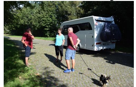
Tid til at sige "på gensyn"

A21 øst om Hamborg. GPS vidste åbenbart noget om et vejarbejde ved Soltau, så den ledte os gennem et flot skovområde, og først ud på A7, hvor vejarbejdet sluttede. Trafikken gik fint på A7 forbi Hamborg afkørslen som var lukket. Det gik dog rimeligt, og trafikken fordelte sig, da vi fortsatte ad A1 mod Putzarden. Senere kørte vi over på A21 mod Kiel. Her var kun lidt trafik, så vi kunne nyde turen frem til Kiel, hvor vi måtte igennem en omkørsel, men det