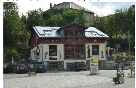
Her sælges træsnitte arbejder

Vi kørte fra Camperpladsen kl. 09.00, i 20 °C og sol fra en skyfri himmel i retning mod Elben og Pirna, hvor