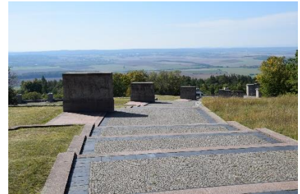
Fra Mindeparken med den flotte udsigt fra Ettersberg