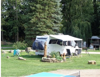
Vores plads i Weimar

Weimar, igen ad Alleenstrasse. Vi kørte igennem " Rennstadt Schleiz ", hvor der var store brede veje, hvilket vi undrede os over. Det viste sig, at der i Schleiz hvert år køres motorløb på trekantet vejstrækning, som lukkes af for almindelig trafik. (Nutidens løb er på 3,8 km for motorcykler og veteranbiler. Tidligere var der Formel 3 mesterskaber på en 7,6 km strækning).