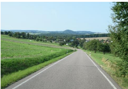
På vej mod Erzgebirge

Dagens etape: 251 km. Turen indtil nu: 1.024 km.