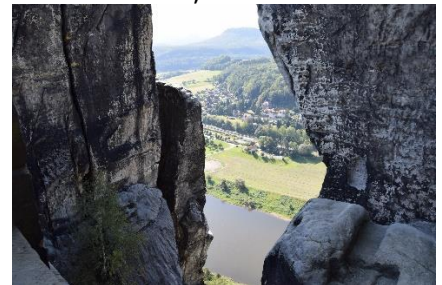
Udsigt til Elben fra Basteibrücke