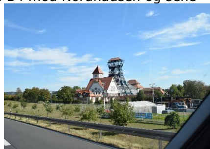
Mineskakt ved Nordhausen

et stykke gennem køen, hvor der herskede anarki. Bilisterne skiftede frem og tilbage mellem banerne, og vi mødte 3 politibiler, da vi endelig var kommet af afkørslen. Mon ikke de skulle sørge for at bilisterne kørte ordentlig på A7. For ikke at komme i