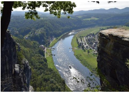
Udsigt fra Bastei til Elben

dens tuden, når den lagde til ved anløbsbroerne dybt under os. Området har for mange år siden været en fæstning, som ikke kunne indtages, og der er stadig velbevarede rester fra fæstningen, bl.a. Basteibrücke som stadig hænger mellem klippeformationerne, og giver adgang til selve fæstningskomplekset. Hvis man går forbi fæstningskomplekset, kan man ad stejle stier komme de mange meter ned til bredden af Elben. Det var nu ikke noget for os, for så skulle vi jo igen op ad bakken, for at komme til cyklerne, så vi kunne køre tilbage til Camperpladsen. Vi nød de mange fantastiske vue over Elben