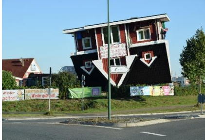
Det omvendte hus i Bispingen

Da vi stod op var solen fremme, men der var kun 7 °C, hvilket var det koldeste på vores tur. Kl. 08.45 havde vi fået morgenmad og kunne begive os af sted mod Flensburg. Vi havde besluttet, at vi ikke ville køre gennem Elbtunnellen og de mange kø problemer videre frem, og så i stedet tage