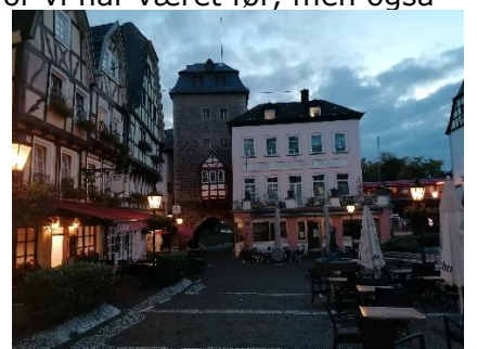
Linz am Rhein, Flot og hyggelig by