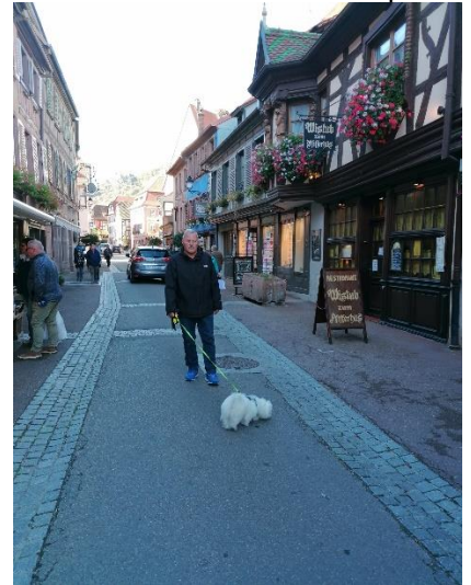
Gåtur i Ribeauville

og kunne starte på turen mod Ribeauville. Vi besluttede os for at følge vinruten gennem de mindre vinbyer og fremme i Ribeauville drejede vi fra og kørte forbi det store vin kooperativ og ad Rue de Landau frem til "Camping Pierre de Coubertin", hvor vi holdt i ventebanen langs vejen. I receptionen sad Isabelle, som taler dansk, og vi blev sendt ud på campingpladsen, så vi kunne vælge en plads. Det blev plads 10 vi kunne køre ind på og parkere Camperen. Selv om det var køligt, nød vi frokosten udenfor i solen, og jeg nåede også at få en lille povernap, inden vi valgte at gå en tur ind i byen. Vi gik ad Grand Rue gennem den flotte by, og fik minderne på plads, inden vi gik tilbage til Camperen. Jeg havde set et tilbud på vin, så på vej tilbage var jeg nødt til at få 6 flasker med under armen. Tilbage ved Camperen var det tid til at drikke et glas vand og nyde et køligt glas vin som aperitif inden aftenmaden, hvor menuen bestod af Baguette, Alsaciske pølser og dansk ost. Efter dejlig aftenmad slappede vi af i Camperen, til det blev sengetid.