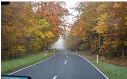
Gennem skovens flotte farver

Dagens etape: 205 km. Turen indtil nu: 1.983 km.