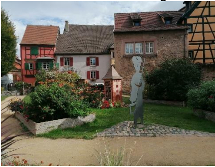
Grøn plet med Insekthotel og vagt

Efter en god nats søvn, vågnede vi til en morgen, hvor vi ikke skulle gøre klar til at køre videre. Vi kunne derfor sidde længe over morgenmaden og fik en lille en til. Senere gik igennem "Porte de Munster" eller "Obertor", som den vestligste byport hedder på hhv. fransk og tysk. Den omvekslende fortid for Alsace fornægter sig ikke, idet der på gadeskiltene både er franske og tyske gadenavne. Vi gik gennem den flotte gamle by og Karin gik ind i Boulangerie for at hente et Pain (brød), som vi tog med tilbage til Camperen. Vejrudsigten havde lovet, at det skulle blive dejligt lunt om eftermiddagen, så vi besluttede os for at gå en tur op igennem vinmarkerne. Vi gik op forbi "Cave de Turckheim", som er en sammenslutning af 240 vinbønder, og har en årlig vinproduktion på 9 millioner flasker. Vi fortsatte op ad en grusvej, og drejede op ad en sti, som førte os gennem vinmarkerne højt