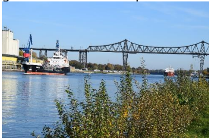
Udsigt over NordOstsee Kanal (NOK)

Det var en flot morgen, da vi stod op i 4 °C. Da vi kørte af sted var det klart vejr og vi kunne se en fantastisk flot rød morgensol komme op over træerne. Fremme ved "det omvendte hus" i Bispingen kørte vi ud på A7, og først ved Seevetal kom vi til første vejarbejde, og det varede til gengæld indtil vi havde passeret Hamborg. Trafikken gled fint mod, og gennem Hamborg, nok mest fordi der var 3 kørebaneer, og at lastbiler havde overhalingsforbud. Det betød at højre spor var fyldt med lastbiler, og at vi andre kunne køre med rimelig hastighed forbi alle lastbilerne.