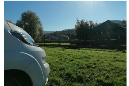
Udsigt til Mosel