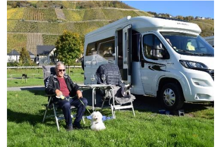
Hygge i solen

par vejarbejder undervejs, hvor kun 1 bane var fri, så vi glædede os over, at det var søndag og derfor ingen lastbiler på vejene. Ved Mehring drejede vi fra i 11 °C, for at køre ad mindre veje frem til Mosel, så vi kunne følge floden frem til Graach an der Mosel. Det gik ned ad mod Mosel, og vi kunne se ud over et hvidt hav af dis, som lå i dalene under os, Snart måtte vi køre ned igennem disen og efterhånden kunne vi se Mosel, og nu var det, der før havde været dis for os, ændret til at være skyer over vore hoveder. (Som vi var med fly.) Skyerne lettede mere og mere, og vi så en stor flok stære som ved "sort sol", men solen manglede. Efterhånden fik solen mere magt, og flere steder kunne vi køre i sol det sidste stykke frem til "Sun Park" i Graach, hvor solen skinnede, da vi kl. 11.30 parkerede på plads 19 med næsen ud mod Mosel. Her kunne vi se, at skyerne langsomt kravlede op ad skråninger på den anden side af Mosel, og til sidst forsvandt helt, så vi havde en skyfri himmel. Om eftermiddagen nød vi solens dejlige varme og et glas kølig hvidvin i stolene udenfor Camperen. Efter vi havde gået en tur i Graach, kunne vi, inden solen forsvandt bag vinskråninger, nyde aftensmaden udenfor. Da solen forsvandt blev det hurtigt køligere, og vi trak indenfor for at nyde aftenen i Camperen.