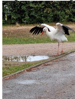
Storken inspicerer campingpladsen