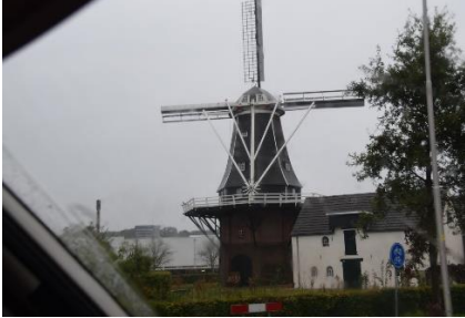
På vej mod Obelink Vrijetijdsmarkt

Vi nød morgenmaden og havde god tid, inden vi ville besøge Obelink Vrijetijdsmarkt , som går for at være Europas Største Campingudstørsbutik. Vi havde dog lidt problemer med, at komme ud af vores flotte græsbelagte plads, idet regnen i løbet af natten havde gjort pladsen endnu mere blød. Hjulene havde svært ved at tage fat, men med en langsom start, og bakke ud fra pladsen, så forhjulstrækket kunne få lidt fat, så kom vi ud til fast grund. Med godt beskidte hjulkasser og op ad siden, kunne vi sætte kursen ind mod Winterswijk, og fremme ved Obelink, blev vi ledt ind på en kæmpe P-plads, hvor der var plads til langt over hundrede Campere. Det regnede let, da vi parkerede, og tog 2 indkøbsvogne med os ind i butikken. Den ene til indkøb, og den anden til at transportere Boris og hans hundekurv. Vi skyndte os i