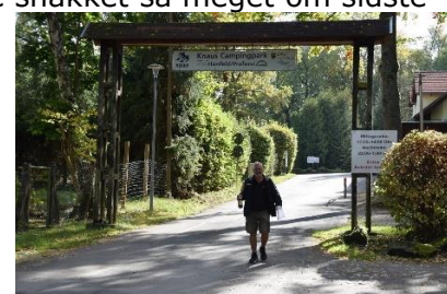
Knaus Camping, Hünfeld

Vi syntes dog, det var for tidlig at holde rast, så vi fortsatte til Rast Allertal, hvor vi blev lettet og fik lidt at spise. Efter 3 kvarter kørte vi videre, og da GPSen sagde, vi kom alt for tidlig frem til " Knaus Camping, Hünfeld " som havde midt-dagslukning til kl. 14.00, besluttede vi os for at køre ad mindre veje. Vi blev nu ledt igennem Hannover, hvor der flere steder var vejarbejder og omkørsler. Det blev vi trætte af, da vi kunne se, at vi havde brugt "overskudstiden", så vi fandt igen ud til A7, som vi tog frem til Göttingen, hvor vi kørte over på B27, som vi fulgte frem til Hünfeld, hvor vi kl. 14.05 kunne parkere Camperen på plads 87 i flot solskin og 10 °C. Efter en gåtur rundt på pladsen slappede vi af ved / i Camperen resten af dagen.