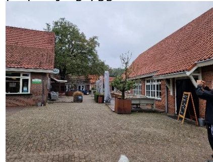
Receptionen på "Het Winkel"

en anden rute, så vi måtte selv tage beslutningen, og besluttede os for at køre over på østsiden af Rhinen, og følge B42, som var hhv. motorvej og motortrafikvej. Oppe på bjergryggen ved Siebengebirge, kørte vi ind på A3 med kurs mod Arnheim. Der var særdeles tæt trafik igennem Ruhrgebiet (Köln, Leverkusen og Düsseldorf), hvor trafikken nogle gange stod næsten helt stille for kort tid efter at køre med 80 km/t. På et stykke med 4 banet vej, kørte der lastbiler i 3 af banerne, så det var med at sno sig. Heldigvis er det i Tyskland forbudt for lastbiler, at køre i venstre spor, når der er 3 baner eller flere. Efter Ruhr blev trafikken mere normal, og det var kun vejarbejder, der gav lidt tæt trafik. Efterhånden var vi kommet forbi de større byer, og kunne køre over på A31 mod Emden, og senere B58 (motortrafikvej) mod Haltern. Vi kørte næsten parallelt med grænsen til Holland, drejede ind på B70 mod Borken og de sidste 10 km mod Winterswijk. Fremme ved Winterswijk drejede vi ind ad "De Slingeweg" og kom frem til " Camping Het Winkel ", hvor vi kl. 11.45, i 11 °C, meldte os i receptionen. Her fik vi en plan over nogle pladser, vi kunne vælge imellem, så vi