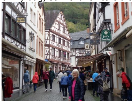
Gåtur i Bernkastel gamle bydel