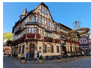
Torvet i Bacharach

FAKTA: Stellplatz Sonnenstrand , Strandbadweg 9, Bacharach - N 50.03.12, Ø 07.46.22 – Pris: 19,00 € / døgn