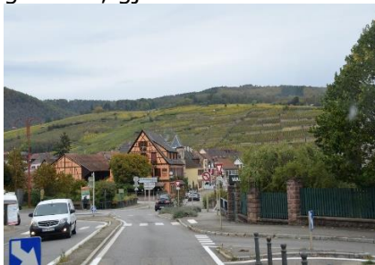
Ankomst til Ribeauville'

Vi fik samme plads 66, som de sidste par gange, og fik Camperen parkeret, og så var det tid for lidt frokost og afslapning, mens vi kunne høre regnen på taget. Ved 14 tiden kunne vi høre, regnen var stoppet, så vi gik en tur ind til Ribeauville' Altstadt, og en tur op ad hovedgaden, hvor det er på fodgængernes præmisser. Det blev en dejlig tur på næsten 5 km, hvor vi nød den flotte gamle by, og det blev også til et par indkøb hos "Ostemanden" (2 specialoste - den ene med brændenælder) og senere et stykke brød hos bageren, der laver næsten 2 m lange brød (m/ nødder og rosiner). Vi kunne næsten ikke vente med at komme tilbage til Camperen, hvor vi hurtigt fik det nyindkøbte brød og ost sat på bordet med en flaske hvidvin. Vi nød hver en bid, og glæder os til vi skal smage igen. Vi kunne også glæde os over at vejret holdt, så der først kom lidt regn kort før sengetid. Vejrudsigten for de næste dage var desværre ikke blevet bedre, så vi besluttede os for at ændre på planen, så vi kun bliver her i 2 overnatninger, men lad os nu se, hvordan virkeligheden er i morgen.