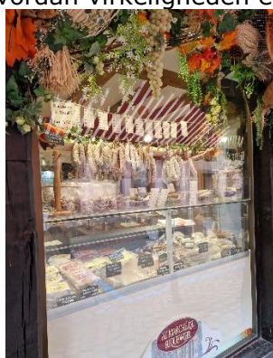
Lidt forskellige butiksudvalg