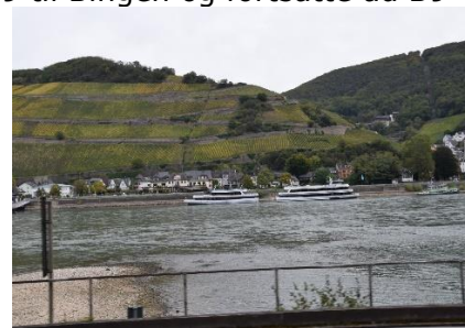
Udsigt mod Rhinen

Ludwigshafen, og senere over på A61 mod Koblenz. Det sidste stykke inden vi kørte over på A61, kunne vi se, at der blev arbejdet på markerne, med løg, asparges, Kürbis og kål mm. Vi kørte nemlig igennem "Gemüsegarten Rheinland-Pfalz". Efter vi kørte over på A61, var der vinmarker på begge sider af vejen, så langt øjet rakte. Dog med enkelte undtagelser, hvor der blev dyrket frugt eller landbrugsafgrøder. Efterhånden var vi fremme ved afkørslen til Bingen, og nu blev regnen tættere, og der var tåge / dis ud over markerne. Vi kørte ned på B9 til Bingen og fortsatte ad B9 langs med Rhinen til vores "Favorit-by" Bacharach, hvor vi kørte ind på " Stellplatz Sonnenstrand ", hvor vi fandt en plads i første række med udsigt ud over Rhinen, hvor skibene kæmpede sig mod strømmen, eller gled ubesværet med strømmen. Til at begynde med måtte vi se ud ad den regnfulde forrude, men hen ad eftermiddagen stoppede regnen, og vi kunne nyde skibstrafikken. Da alt udenfor "søppede" blev det kun til turer med Boris, og en enkelt tur ind i Bacharach Altstadt til den lille købmand for at hente et "Klöben". (Vi havde købt et, da vi var her for en ugestid siden, og det var så lækkert, at vi måtte have et igen). Efter indkøbet blev der sluppet af i Camperen, og da restauranten var lukket, måtte vi også nyde aftensmaden i Camperen. Vi nød udsigten og hyggede os til sengetid.