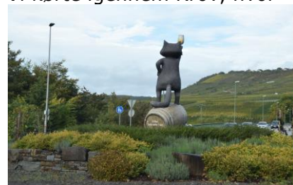
Zeller Schwarze Katz

Karin havde forberedt sig til at tage et foto af figuren, hvor en mand klasker et barn bagi den bare bag. Deraf hedder deres mest berømte vin "Kröver Nacht Arsch". Desværre kom vi fra den forkerte retning til at tage et godt foto, så det var sur røv. (Undskyld mit sprog). Vi kunne se, at der var spærrede veje mod Bernkastel, så det passede os godt, så vi kunne få handlet lidt i LIDL i Kues, inden vi kørte tilbage til Wehlen, for at køre over Mosel, så vi kunne komme frem til " Sun-Park " i Graach an der Mosel. Her fandt vi en plads, hvor vi kunne holde "med snuden ud mod Mosel". Da vejrudsigten sagde regn resten af dagen fra kl. 14.45, gik vi ind til Bernkastel efter en hurtig frokost. Vi gik lidt rundt i den gamle bydel og vendte hjem med lidt vin. Vi nåede det fint, inden regnen skulle komme, men endnu en gang slog vejrudsigten fejl, Ja, der kom 17 dråber kl. 15, men ellers har det været tørt og flot solskin, indtil solen gik ned bag bjerget på den anden side af Mosel. Nu hygger vi os i Camperen, og glæder os til en ny dag i morgen.