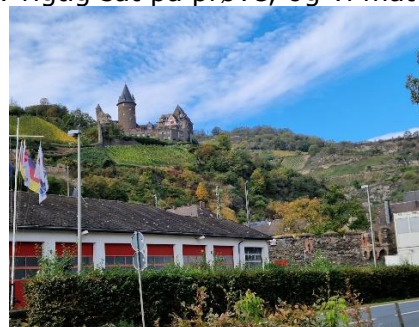
Burg Stahleck - Jugendherberge

os en plads, hvor Camperen holdt med snuden helt ud til Rhinen. (Kun med en gangsti foran). Efter vi havde spist lidt frokost, kom solen rigtig frem, så vi besluttede os for, at gå en tur ind i den gamle by, Bacharach . (Weltkultur Erbe). Vi startede dog med at gå op ad de stejle stier til Burg Stahleck, som er "Jugendherberge". En tur hvor benmusklerne blev rigtig sat på prøve, og vi måtte holde et par pauser, idet udsigten ned over Bacharach og ud over Rhinen, næsten tog vejret fra os. Vi gik en tur ind i borggården og nød den velrenoverede, flotte gamle borg, og udsigten over landskabet. Vi fortsatte et stykke yderligere op ad de stejle klipper til et højt beliggende udsigtspunkt, med en betagende udsigt. Nu var det tid til at gå ned ad stejle klippestier til Bacharach, hvor vi startede på byrundturen ved det skønne hotel Im Malerwinkel og gik igennem den lille byport i Steeger Tor, og var inde i Bacharach. Her var vi et lille smut inde ved den lille købmand, hvor vi købte et par flasker Rhinskvin, inden vi gik igennem hovedgaden og senere ned til Rhinen, hvor vi fulgte gangstien tilbage til Camperen. Da vi syntes, vi havde fortjent det efter den hårde gåtur, gik vi ned i Campingpladsens Gaststätte, hvor vi spiste "Knoblauch – Pfefferrahm Schnitzel", som dagens sidste gerning.