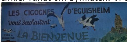
Skilt til Storkeparken

køre). Vi nød at se det mange gamle flotte huse, og det "Leben" der var i byen. Tilbage ved Camperen nød vi det udenfor i solens stråler foran Camperen, hvor vi også spiste aftensmaden. Da solen forsvandt over Vogeserne, trak vi indenfor, hvor vi fortsatte nydningen indtil sengetid.