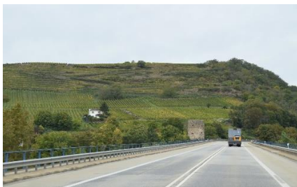
Turen langs Rhinen

med Frankfurts lufthavn, med mange store lufthavnsbygninger, samtidig kunne vi se de store fly, som lettede hen over os, og da vi var forbi lufthavnen, kom de hen over os med landingslys og hjulene nede for at lande. Efter lufthavnen kørte vi ad A60 forbi Rüsselsheim, som er hjemsted for Opels hovedkvarter, men vi så ingen Opel bygninger kun henvisningsskiltene. Snart krydsede vi Rhinen og kørte syd om Mainz, og senere på B9 langs med Rhinens sydside fra Bingen til Bacharach, hvor vi drejede ind på " Stellplatz am Sonnenstrand ", og kl. 11.40, i 8 °C fandt vi