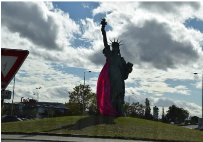
Frihedsgudinden ved Colmar