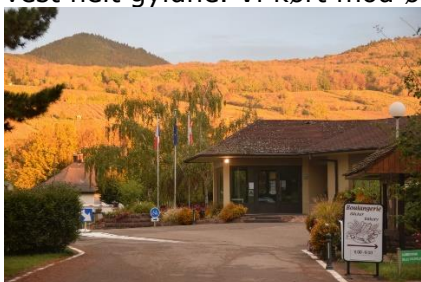
Solopgangen giver et fantastisk farvespil over vinmarkerne.