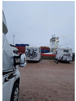
Kig til skibstrafikken (NOK)

Vi vågnede tidligt, idet vi vågnede op ligesom vi plejer. Det indre ur kører stadig sommertid. Vi tog os god tid til morgenkaffen, og snakkede om vi skulle tage den planlagte overnatning i Osterrönfeld. Vejrudsigten lovede regn, så vi blev enige om at køre hjem i stedet. Efter morgenmaden gjorde vi klar, og kunne køre ud i regnen, med kursen mod Flensburg. Efter en times kørsel, kunne vi låse os ind på IMC, og parkere Camperen i vores carport. Inden vi kunne læsse tingene over i vores bil, skulle den lige skylles lidt af, idet den var blevet rigtig godt beskidt, at uvejret for nogle dage siden. Cirka en times tid senere kunne vi parkere bilen hjemme i indkørslen, så regnen kunne skylle bilen noget mere. Efter bilen var blevet tømt, kunne vi nyde frokosten i køkkenet, og slappe lidt af inden der skulle ryddes op og vaskes tøj.