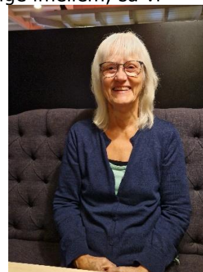
Stemmingsbilleder fra restaurant "Reuselink"