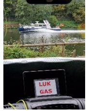
Politiet raser forbi på Mosel