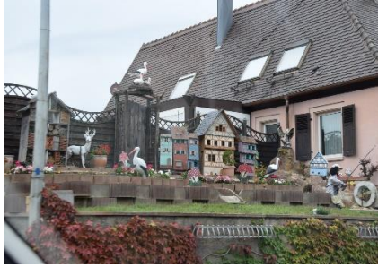
Speciel have undervejs