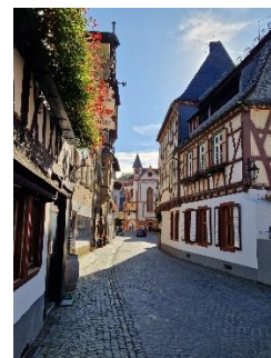
Hovedgaden i Bacharach