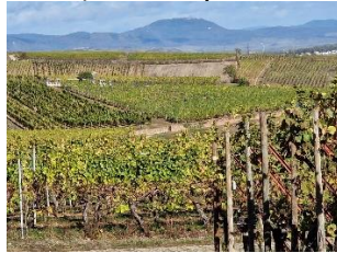
Gåtur igennem vinmarkerne