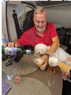
Indkøbet skal nydes