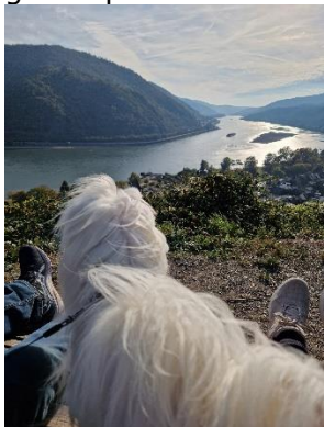
Udsigt over Rhinen