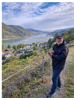
Gåtur til Burg Stahleck