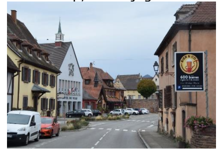
Ad Vinruten i Alsace