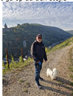
Gåtur i vinmarkerne

lige have den dejlig morgenmad, med kaffe, blødkogt æg og en "lille en til". Efter vi havde nydt morgenmaden, slappede vi lidt af og fik gjort klar til en gåtur i den dejlige solskin sidst på formiddagen. Vi havde set at vejrudsigten truede med dårligt vejr med regn hen ad eftermiddagen. (Det viste sig senere, at vi igen, ikke kan stole på vejrudsigterne). Ved 10.30 tiden, syntes vi, det var tid til at gå ind til Bacharach og frem til byporten, Steeger Tor, hvor vi gik rundt om, for at gå op ad den stejle klippeside med Vinmarkerne. Vi gik op forbi Postenturm, og videre stejlt op til Spitzer Turm, hvor vi holdt en pause, og nød udsigten mod syd ud over Bacharach og Rhinen. Vi var noget i tvivl om vejvisningen, men vi fortsatte et kort stykke nedad ad den lille vej mellem vinmarkerne, og kom til en stejl trappe, som vi gik op ad, og slyngede os ad en stejl sti op ad bjerget, forbi Rheinblick og kom op til en asfalteret vej gennem vinmarkerne oppe på det fladere stykke. Vi havde lidt svært ved at tyde skiltene, men endte med at følge en stil langs vinmarkerne og kom frem til dagens mål: Heinrich Heine Blick. (Vi kom til at tænke på derhjemme, hvor vi har en Blickenslager som kaldes Heine blick). Efter vi havde sluppet af, og nydt den fantastiske udsigt ud over Rhinen, beslut-