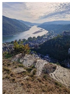
Udsyn ned over Bacharach