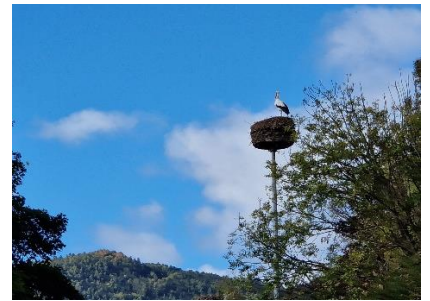
Stork i Storkeparken

vinen. (Auslese, Berenasulese eller Eisberenasulese). Tilbage ved Camperen fik vi lidt frokost og slappede af, inden vi besluttede os for at nyde, at solen stadig hang på himlen. Vi gik derfor en tur ned til Eguisheim Altstadt, og nød gåturen ad de ovale gader rundt om bycentrum. Flotte smalle gader hvor der ikke kunne køre biler. De kunne køre på gaderne bag husene på begge sider. Vi var et smut forbi den store P-plads ved Mairie (Rådhuset), hvor de har taget en del af P-pladsen til Camperplads. Vi fortsatte ind gennem centrum, og nød solen og den flotte by, inden vi gik tilbage til Camperen, hvor vi nød resten af dagen. Det blev mest indenfor, idet skyerne overtog himlen, og det begyndte at blive lidt køligt.