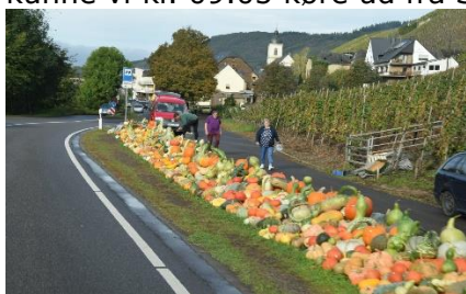
Salg af Kürbis langs Vinruten

Efter en dejlig nat, hvor regnen lige havde været forbi, vågnede vi op til endnu en dejlig dag, hvor solen prøvede at få bugt med disen / tågen over bjergene langs Rhinen. Efter dejlig morgenmad kunne vi kl. 09.05 køre ud fra Stellplatz Sonnenstrand, og nogle få kilometer langs Rhinen, inden