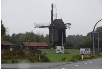
Undervejs mod Holland

Efter en lidt urolig nat stod vi tidligt op og fik morgenmad, og gjorde klar til den videre tur. Kl. 07.45 kunne vi i 10 °C og tørvejr køre ud fra Stellplatz am Sonnenstrand, og køre langs Rhinen og