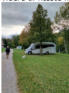
Morgen i Hünfeld

tede vi os for at gå tilbage til Bacharach, nu den modsatte vej, med stejle stier og trapper. Vel tilbage i Bacharach gik vi den afslappende tur, ad stien langs Rhinen tilbage til Camperen. Vores ben var godt brugte efter 2 dages dejlig gåtur i bjergene, med høj sol, så resten af dagen blev brugt til afslapning ved Camperen, og vi sov alle 3 godt, da vi gik i seng, med udsigt til en køretur videre til næste mål.