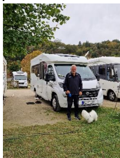
Ankommet til Bacharach