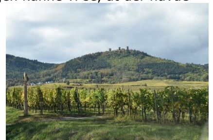
Udsigt til "Les Trois Châteaux"

gik det 8% ned og igennem store flotte skovområder, frem mod Hagenau, hvor vi kørte ind på den betalingsfrie motorvej A4 mod Strasbourg. Markerne langs vejen kunne vi se, at der havde været afgrøder som bruges til en af Alsaces Signaturretter, Choucrute . Et enkelt sted stod de bare stolper og virer fra høsten af Humle. Efterhånden var vi kommet frem til Strasbourg, hvor vejen rundt om byen, vekslede mellem 2 og 5 vejbaner i hver retning. Efter Strasbourg fortsatte vi ad A35, "St. Die des Vosges" indtil vi drejede fra mod Münster / Koenigsburg. Vi blev ledt ind mod Colmar, og kørte igennem rundkørslen, hvor der står en mindre udgave af " Frihedsgudinden " (Originalen er en gave fra Frankrig til USA). Vi fortsatte ad større veje og igennem et dusin rundkørsler, inden vi drejede ad en mindre vej frem til Eguisheim. Her ledte campingskilte os ind mod udkanten af byen, og videre rundt om byen, inden vi kom til en vej gennem vinmarkerne og frem til " Camping Trois Chateau ", hvor vi kl. 14.00 i 17 °C og solskin kunne stille Camperen på plads 76. Efter vi havde spist frokost, nød vi det dejlige solskinsvejr, mens vi gik ind til Eguisheim, hvor vi gik ad en af de smalle gader, der går som cirkler rundt om bymidten. Vi drejede ind igennem den næste bilfrie bymidte. (Kun beboere må