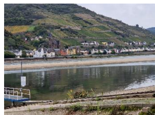
Kig til Lorchhausen