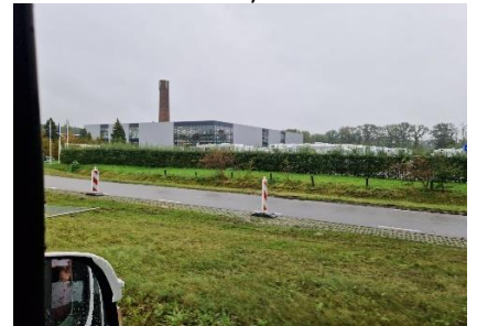
Obelink "Here We come"

finregnen, og fandt rundt om flere hjørner inden vi kom til indgangen. Det var en fantastisk butik med 3 etager, vi var kommet ind i. Vi fulgte skiltningen (a la Ikea) rundt i butikken, men måtte indimellem lige slå et slag tilbage, da der var noget som havde fanget vores interesse. Vi havde en fantastisk oplevelse og brugte næsten 3 timer rundt i den store butik, hvor vi også var i restauranten, hvor vores frokost bestod af en Burger med "Pulled Pork og Pommes frites". Dejligt mætte kunne vi finde ned til stueetagen, hvor vi efter betaling af indkøbet, kunne gå ud til Camperen, igennem regnen. Eneste klage over Obelink er, at de ikke havde skaffet tørvejr, når der er så langt fra kasserne til Camperparkeringen. Tilbage på campingpladsen, turde vi ikke parkere på den opblødte græs plads, så vi valgte at holde på en af stierne, så vi var sikre på at kunne komme videre på egen hjælp i morgen. Jeg var lige forbi receptionen, for at fortælle om vores beslutning, som de sagde god for. Efter afslapning og aftensmad i Camperen, sagde vi godnat og tak for en god oplevelse i Obelink. (Vi ses igen)