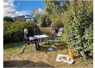
Afslapning efter gåturen

FAKTA: Camping Les Trois Châteaux, Rue du Bassin 10, Eguisheim - N 48.02.34, Ø 07.17.58 - Pris: 20,32 € / døgn