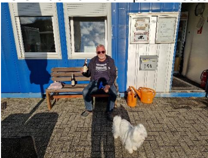
Sol og den gode øl nydes