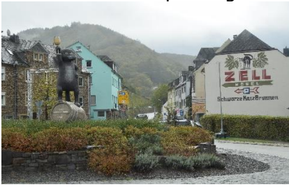
Skulpturen af Zeller Schwarze Katze

vand i Mosel, og vi kunne fornemme, at der havde regnet meget de seneste dage, måske uger, men der var Campere og andre campister overalt på campingpladserne. Kort før Zell forlod vi B49