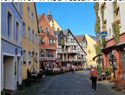
Hovedgaden i Bernkastel