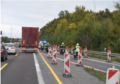
Politieskorte med blå blink

Det havde regnet i løbet af natten, men heldigvis havde vi ikke problemer med at køre ud fra vores plads. Vi havde nemlig hørt, at 3 - 4 Campere måtte trækkes ud i går med traktor. Kl. 07.10 kunne vi trille ud fra "Sun-Park" og køre mod Bernkastel-Kues, hvor vi fik tanket diesel, lige inden vi kørte ud af Kues. Vi satte kursen væk fra Mosel og op mod