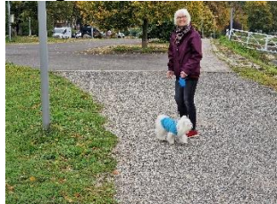
Ad stien langs Rhinen