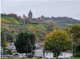
Udsigt op til Jugendherberg