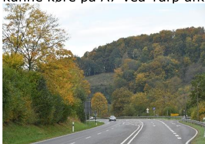
Efterårets farver nydes undervejs

Vi vågnede ved 3-tiden, og kl. 03.55 var vi klar til, i 8°C, at kunne låse os ud af porten ved IMC, og sætte kurs mod A7. Da vi kom frem til A7, var tilkørslen til Autobahnen lukket pga vejarbejde. Vi havde ganske enkelt kørt den sædvanlige vej og IKKE set på GPS'en, som viste en anden rute. Nå skidt nu var vi fremme, og GPS'en ledte os ud på landevejene fra Handewitt og mod syd til vi kunne køre på A7 ved Tarp afkørslen, og sætte kurs mod Hamburg. Trafikken gled uden problemer, og kl. 04.45 kunne vi konstatere, at Camperen rundede 100.000 km. Da vi kom frem til Hamburg kl. 06.00, kunne vi se, at trafikken var blevet meget tæt, men heldigvis gik trafikken ind mod Hamburg centrum, så vi kom let igennem Elbtunnel, og ud i vejarbejdet syd for Elben. Vi var fremme ved Raststätte Lüneburger Heide kl. 06.40, og holdt ind for at blive lettet, og købe kaffe, så vi kunne få lidt velfortjent morgenmad. Efter en halv times pause kørte vi videre, og GPS'en fortalte, at vi ville være fremme, inden campingpladsen var middags lukket, hvilket glædede os. Fremme ved Göttingen kørte vi fra A7 og over på B27, som vi fulgte udenom Kasseler Berge og frem til " Knaus Camping, Hünfeld " hvor vi meldte vores ankomst kl. 11.30 i 15 °C. Vi nød eftermiddagen på campingpladsen og gåture i nærområdet. Desværre var værtinden" syg, så vi måtte selv komponere aftensmaden. Lidt ærgerligt, for vi havde glædet os til Schnitzel med Champignon-Rahm Sauce og en af de gode Hochstift øl – "Pilgerstof".