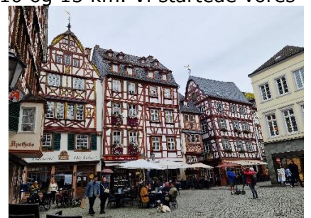
Torvet i Bernkastel

Vi hyggede os med morgenmaden, indtil disen var drevet op ad bjergsiderne, inden vi besluttede os for, at gå en runde på 9 km, rundt på begge sider af Mosel. Vi mødte mange motionister, som var med i et motionsløb på hhv. 10 og 15 km. Vi startede vores gåtur langs med Mosel, den vej floden løber, indtil vi kom frem til broen, hvor vi gik over Mosel til Wehlen: Her fulgte vi den anden side af Mosel ad en bred grussti mod Kues, hvor vi handlede lidt ind i Edeka, inden vi gik over broen til Bernkastel, hvor vi lige var et smut inde i den gamle by, inden vi fortsatte vores rundtur langs Mosel tilbage til Camperen. Solen havde lidt svært ved at komme helt igennem, men hen ad eftermiddagen kunne vi nyde solen foran Camperen. Senere trak vi indenfor, hvor vi nød resten af dagen indtil sengetid.