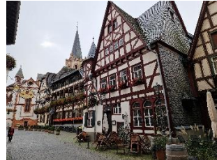
På hovedgaden i Bacharach