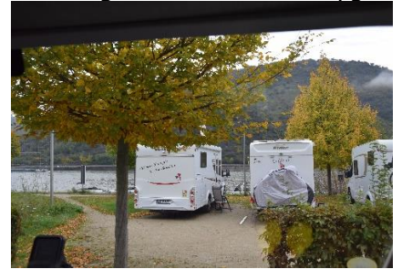
Udsigt til Rhinen

11.15, i 13 °C fandt vi os en plads, hvor vi fra Camperen kunne se ud over Rhinen. Efter vi havde spist lidt frokost, kom solen rigtig frem, så vi besluttede os for, at gå en tur ind i den gamle by, Bacharach . (Weltkultur Erbe). Vi startede med, at følge stien langs Rhinen, indtil vi drejede ind i Bacharach igennem en af de mange porte i bymuren. Her var vi et lille smut inde ved den lille købmand, hvor vi købte et par flasker Rhinskvin, inden vi gik igennem hovedgaden og senere ned til Rhinen, hvor vi fulgte gangstien tilbage til Camperen. Da vejret ikke egnede sig til at lave mad ude i det fri, besluttede vi os for at gå ned i Campingpladsens Gaststätte, hvor vi nød en Schnitzel med pommes, og bagefter en Irish Coffee, inden vi slaptede af i Camperen indtil sengetid.