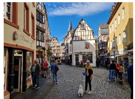
Den gamle bydel i Bernkastel