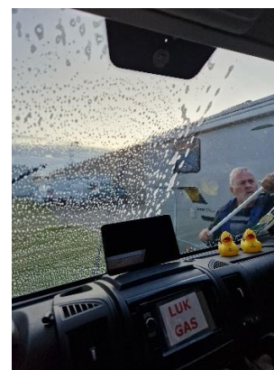
Camperen gøres klar

Denne gang var vejret ikke rigtig med os, så ud over at pakke Camperen, blev det kun til en tur ind i Citti Park, hvor vi fik handlet lidt ind, og fik indkøbt lidt "kineser-mad", som vi kunne nyde til aftensmad, sammen med en dejlig blød Störtebecker Schwarzbier. Efter aftensmaden hyggede vi os i Camperen, med lidt musik fra NDR1 – SH indtil det var tid til, at give Boris en lille travetur, så han kunne blive lettet, og ligesom os, være klar til at gå tidligt til køjs.