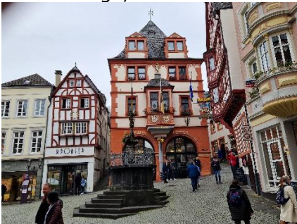
Rådhuset i Bernkastel-Kues