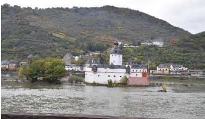
Burg Katz i Rhinen

Efter en dejlig nat, hvor regnen lige havde været forbi, vågnede vi op til endnu en dejlig dag, hvor solen prøvede at få bugt med disen / tågen over bjergene langs Rhinen. Efter dejlig morgen kunne vi kl. 09.10 køre ud fra Stellplatz Sonnenstrand, og ad B9 langs Rhinen, hvor der sejlede mange krydstogtskibe og flodpramme. På begge sider af Rhinen kunne vi se passagertog og lange godstog. Kort før Koblenz kørte vi forbi Privatbräuerei Koblenzer, og snakkede om, at vi havde set bryggeriet mange gange på vores ture, men vi havde endnu ikke smagt en