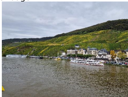
Turistskib i Bernkastel