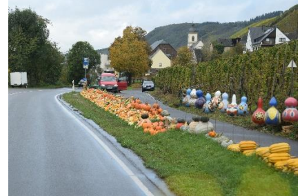
Gadesælger med Græskar

og kørte i rundkørslen med skulpturen "Zeller Schwarze Katze" over på B53, som vi fulgte frem til Enkirch, hvor vi drejede ind på den store stellplatz. Vi undrede os noget, da vi så, at der kun holdt et par håndfulde Campere, men kunne fornemme, at der var meget vådt og sumpet, så græsset nok ikke kunne bære. Vi besluttede os for at køre videre ad B53 mod Graach an der Mosel, hvor vi kl. 12.12 og i fint solskin, kørte ind på stellpladsen "Sun-Park". Her undrede vi os også over, at der ikke var ret mange Campere, men da vi kørte igennem pladsen, kunne vi se, at der var meget blødt og store vandpytter på mange af pladserne. Efter en runde på pladsen fandt vi dog en fornuftig plads i anden række, hvor pladsen foran os var spærret af, så vi havde fuldt udsyn til Mosel. Vi besluttede os for at tage 3 nætter, og da jeg gik op for at betale fortalte pladsmanden, at det havde regnet i strid strømme de seneste dage, men at de stadig led af efterveer af, at der i Pinsen havde været oversvømmelse på næsten 1 meter over hele pladsen. De kæmpede stadig med problemer med el på flere standere. Efter en dejlig frokost, besluttede vi os for at nyde solskinnet, og gå en tur ad den befæstede sti ind til Bernkastel - Kues, for at se på byen og handle lidt ind i Aldi. Tilbage ved Camperen slappede vi af i solen foran receptionen, med en dejlig øl, fra det lokale kloster, og senere indenfor i Camperen resten af dagen.