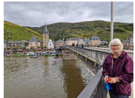
Udsigt mod Bernkastel fra Moselbrücke