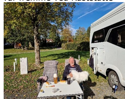
Vejret nydes med en forfriskning