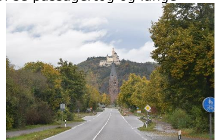
B9: Kirke foran borg

"Koblenzer" og ikke en gang set et sted, hvor man kunne købe øllen. Fremme ved Koblenz drejede vi ad B49 langs med Mosel, som vi fulgte frem til vores bestemmelsessted. Der var meget