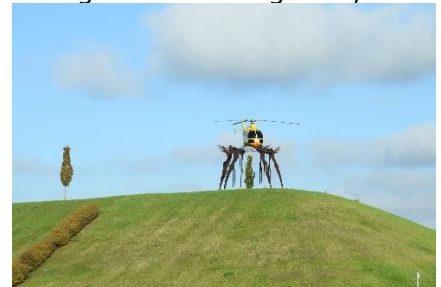
Helikopter som blikfang for firma

B50 på "Hochmoselbrücke" og videre mod Autobahnnettet op gennem Tyskland. Vi fulgte A1 og A 48 med Koblenz og videre på A61 og ved Bonn, kørte vi over Rhinen, og videre på A59 forbi Köln, hvor en stor kolonne af politibiler, og politimotorcykler, som med blå blink holdt trafikken tilbage. Vi blev enige om, at de nok eskorterede en civil bil med en prominent person. Efterhånden kørte vi over på A1 mod Hamburg og ved Düsseldorf,